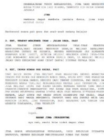
Gambar 3. Script film Djiwa

Script yang akan diidentifikasi pada tahap ini bermaksud untuk mengetahui scene berapa saja yang dipakai foley , penggambaran visual serta penulisan audio yang lebih lengkap sebagai referensi pembuatan foley nanti. Berikut adalah potongan naskah film Djiwa.