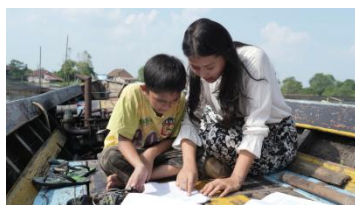
Gambar 4. Screening film Djiwa di scene kapal

Sebelum merekam suara foley , soundman harus melihat Picture Locked (film yang sudah jadi tetapi tidak memiliki foley ). Hal ini dilakukan untuk memberikan gambaran tentang bagaimana suara foley akan dibuat dengan menggunakan bahan-bahan yang tersedia dan pada scene mana saja yang akan diberikan suara foley .