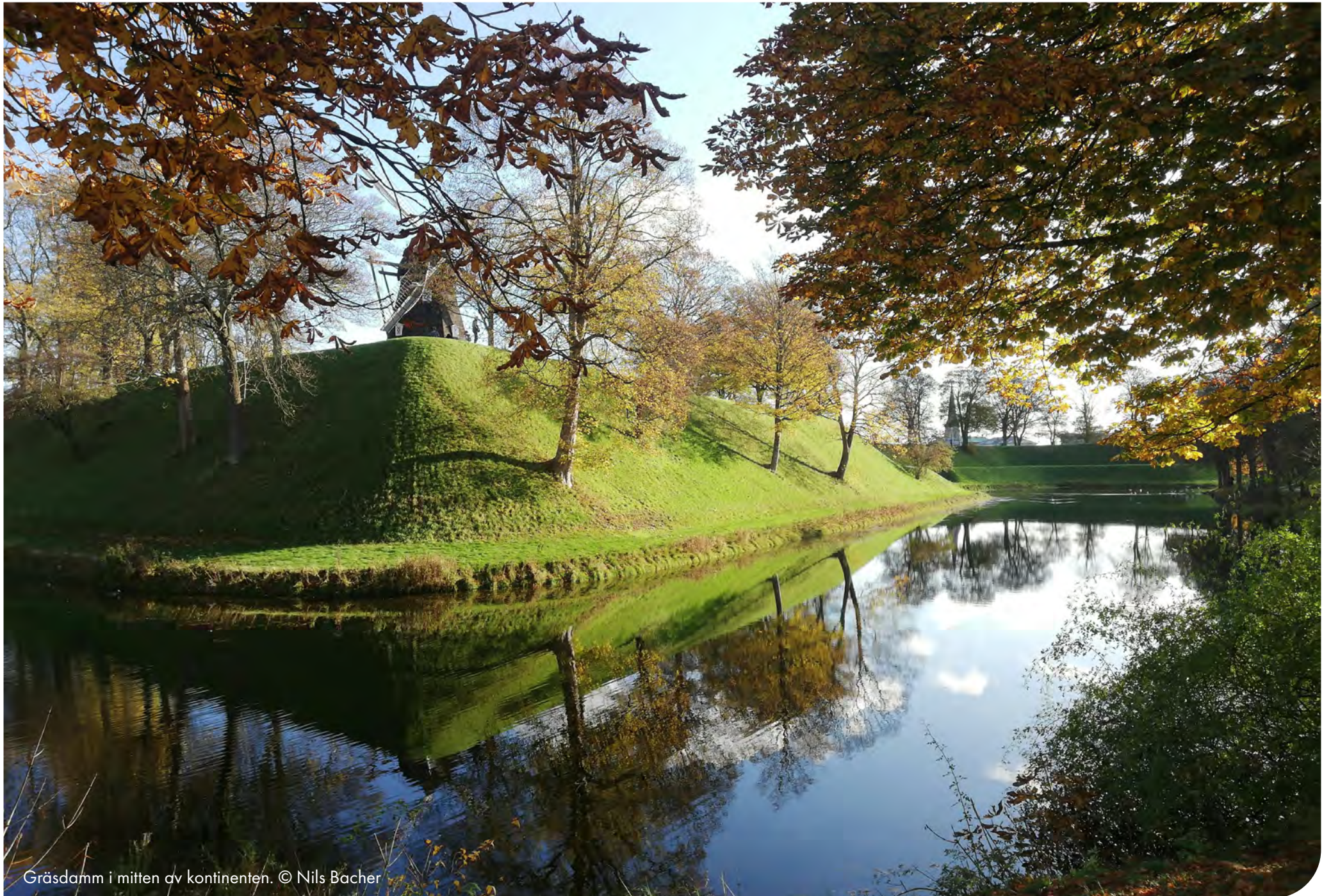
Gräsdamm i mitten av kontinenten. © Nils Bacher