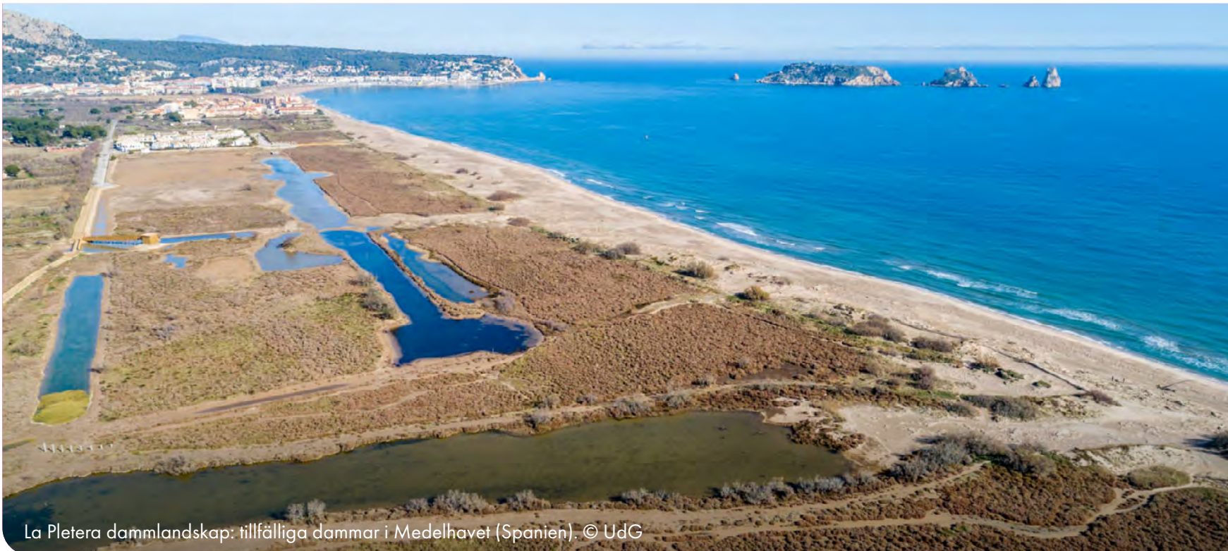
La Pletera dammlandskap: tillfälliga dammar i Medelhavet (Spanien).

Förslaget till en "konvention om skydd av dammar" innehåller några värdefulla förslag för beslutsfattare som arbetar med förvaltning av mark och vatten.