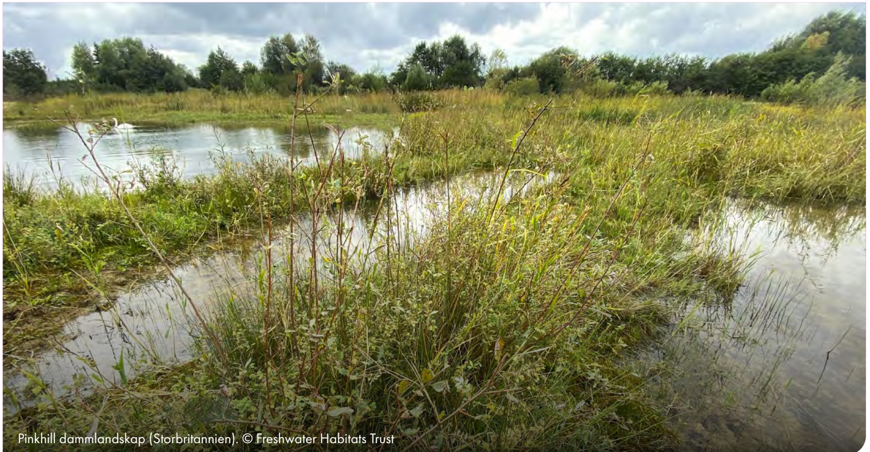
Pinkhill dammlandskap (Storbritannien).

PONDERFUL Sustainable Finance Inventory i PONDERFUL Technical Handbook identifierar 24 olika "finansieringsinstrument" som förvaltare av dammlandskap kan använda för att betala för dammar, inklusive: inkomstgenererande åtgärder för statliga eller privata markägare, offentliga subventioner och bidrag, privata donationer, lån, investeringar och avtalsmässiga tillvägagångssätt.