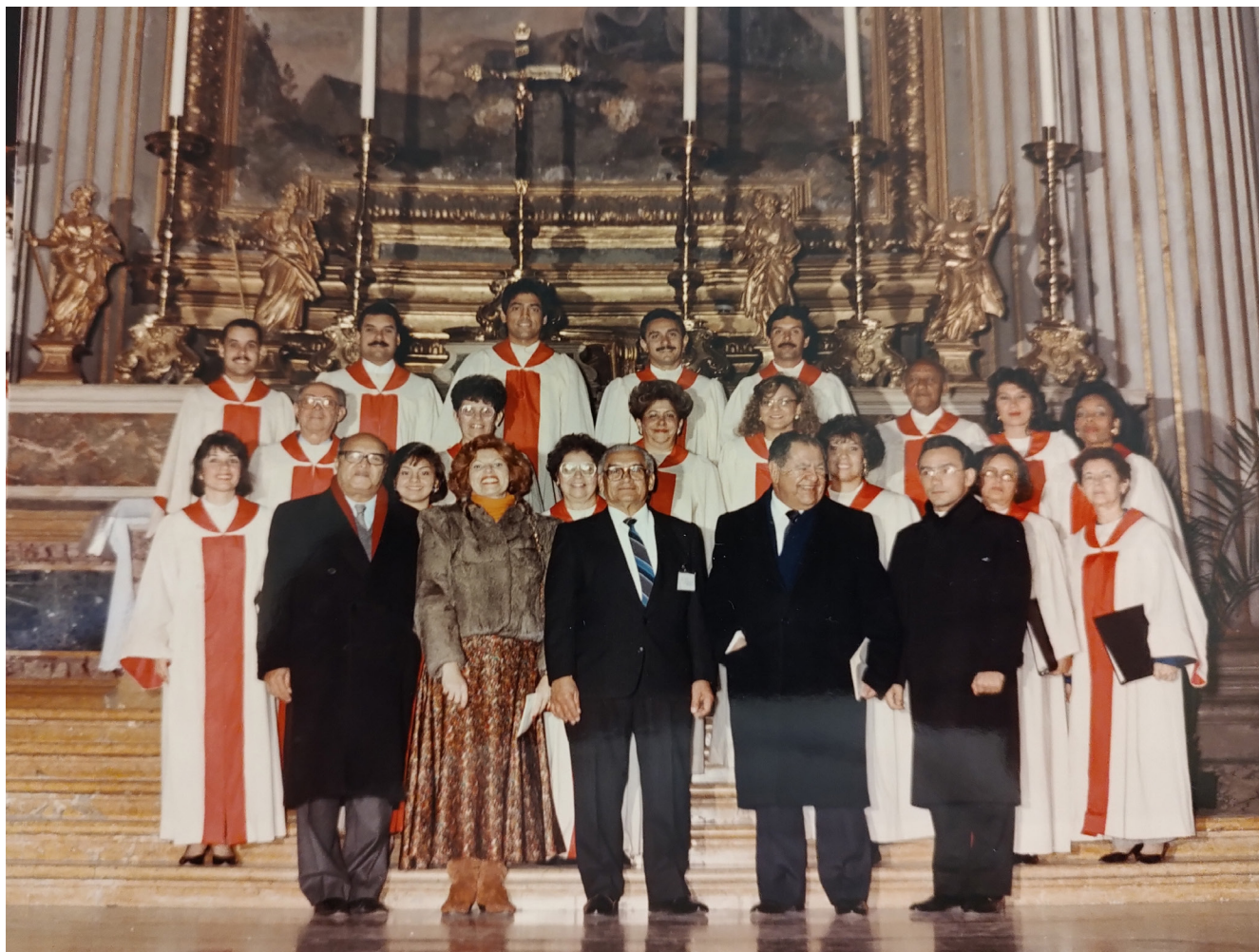
GRUPO CORAL ZULIA AL FINALIZAR EL CONCIERTO EN LA IGLESIA DE SAN IGNACIO DE LOYOLA, ACOMPAÑADOS DEL EL AGREGADO CULTURAL, MTRO. ALIRIO DÍAZ, EL EMBAJADOR DE VENEZUELA ANTE LA SANTA SEDE Y SU SEÑORA ESPOSA, Y EL REV. PADRE EDGAR PEÑA PARRA, ACTUAL SUSTITUTO DE ASUNTOS GENERALES DE LA SECRETARÍA DE ESTADO DE LA SANTA SEDE