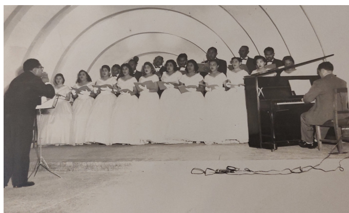
CORAL SAN JOSÉ