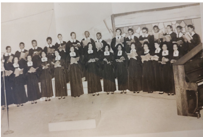
CORAL SAN JOSÉ