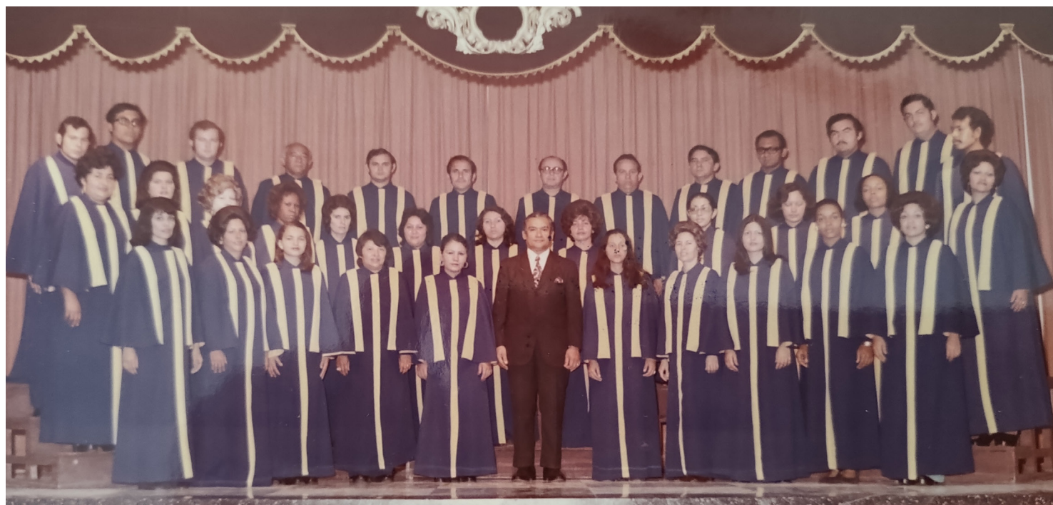
CORAL FILARMÓNICA CVP-ZULIA