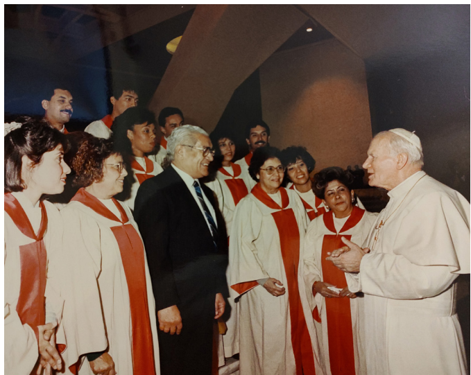
AUDIENCIA DEL GRUPO CORAL ZULIA CON SU SANTIDAD JUAN PABLO II SALA DE AUDIENCIAS PABLO VI DE LA CIUDAD DEL VATICANO