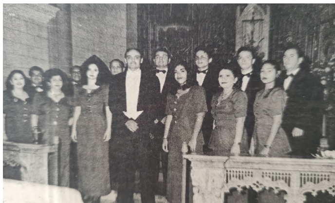
MAX ALLIEY CORO DE CÁMARA & ORQUESTA