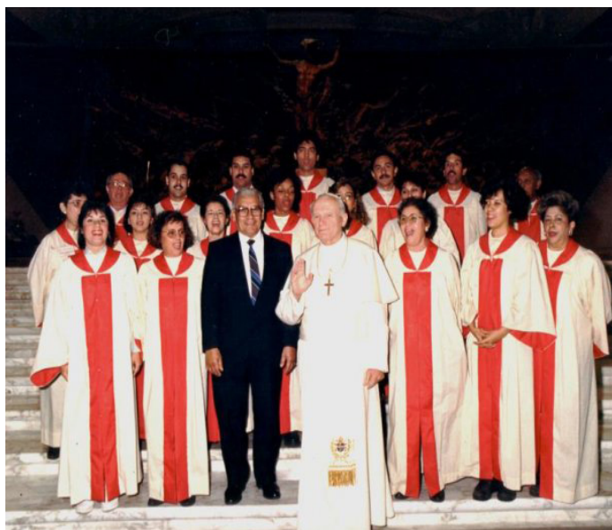
AUDIENCIA DEL GRUPO CORAL ZULIA CON SU SANTIDAD JUAN PABLO II SALA DE AUDIENCIAS PABLO VI DE LA CIUDAD DEL VATICANO