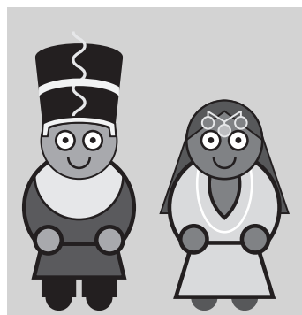
mainzed-Figuren des Studiengangs

Außerdem ist mainzed unter @_mainzed auf twitter aktiv.