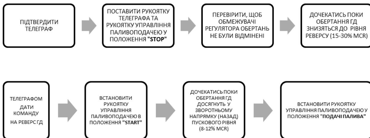
Рис. 3. Алгоритм аварійної зупинки судна

Якщо швидкість судна надто висока, необхідно більше часу, щоб досягти пускових обертань головного двигуна, що приведе до більших втрат пускового повітря. В такому випадку студенту необхідно встановити рукоятку телеграфу та рукоятку паливоподачі в положення «STOP», дочекатись поки обертання головного двигуна знизяться ще більше (15–30% MCR), потім повторно зрeversувати головний двигун телеграфом, встановити рукоятку паливоподачі у положення «START» та, дочекавшись обертань головного двигуна близьких до пускових у зворотному напрямку (назад) (8-12% MCR), встановити рукоятку управління паливоподачею у положення подачі палива.