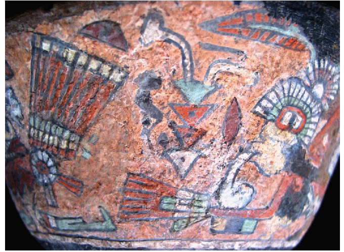
Figura 12. Posible representación de una biznaga de acuerdo con la interpretación de un mural de Teotihuacan.

vés del intercambio comercial. Me inclino a pensar que originalmente serían teotihuacanos que enseñaron la técnica a los locales, quienes la asimilaron completamente y desarrollaron su propio estilo siguiendo los cánones ideológicos propios de la cultura Chalchihuites.