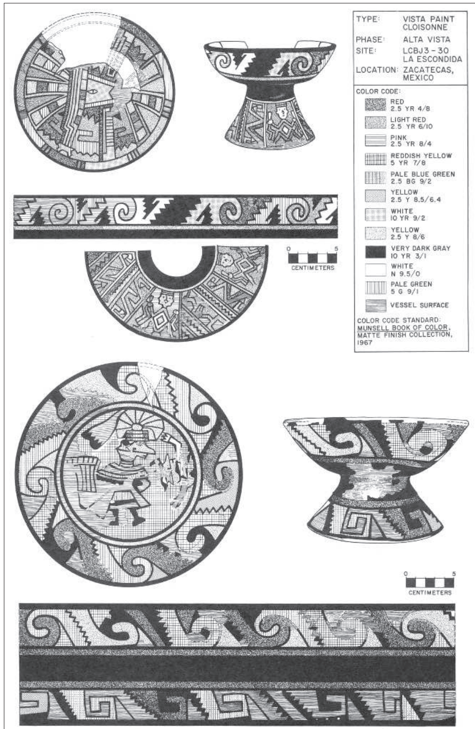
Figura 8. Dibujo de una copa de Alta Vista.

serva la técnica decorativa pseudo-cloisonné aplicada a los motivos geométricos dominantes en la cerámica pintada, esgrafiada e incisa con adición de elementos humanos, vegetales y animales característicos de la región como son las biznagas, el águila y la serpiente. Los personajes portan grandes tocados sin llegar a tener la magnificencia de los teotihuacanos. Lo anterior podría deberse, como antes señalé, a la manera en que acostumbraba a vestirse y adornarse la gente chalchihuita, lo cual nos conduce a pensar que son representaciones locales de la sociedad que las creó.