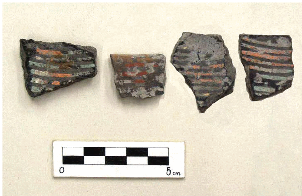
Figura 1. Tiestos pseudo-cloisonné de La Florida.

co) 7 (Cabrero 2005; Cabrero y López 2002). El contacto comercial permitió a los moradores del cañón de Bolaños la adopción de rasgos propios de los pueblos del exterior. En esa forma se explica la presencia de estilos cerámicos propios de las culturas de Chalchihuites, La Quemada y Nayarit, así como las tumbas de tiro características de las culturas de Nayarit, Jalisco y Colima (Kan, Meighan y Nicholson 1970; Kelley 1971).