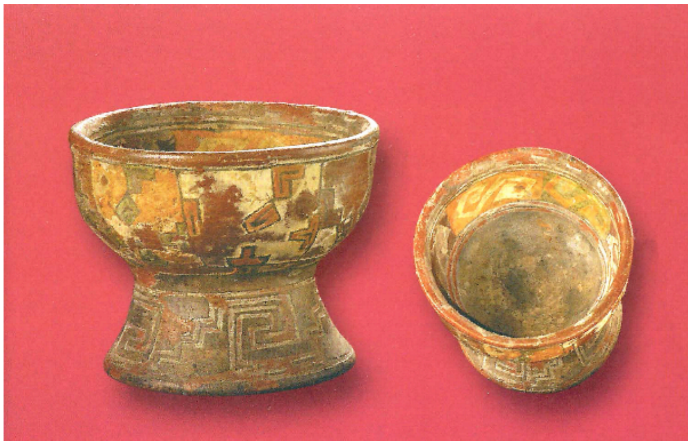
Figura 7. Copa de Alta Vista, Zacatecas (foto tomada del libro Alta Vista ).

emitido por este autor de que el área de Chalchihuites, cuyo sitio principal fue Alta Vista, constituyó una avanzada teotihuacana (Kelley 1976, 1980). Por último, añade que esta cerámica debió de ser elaborada por artesanos especialistas foráneos, llegados a la región a través del comercio entre 300 y 500 d. C. (Kelley 1971: 161-162) (fig. 10).