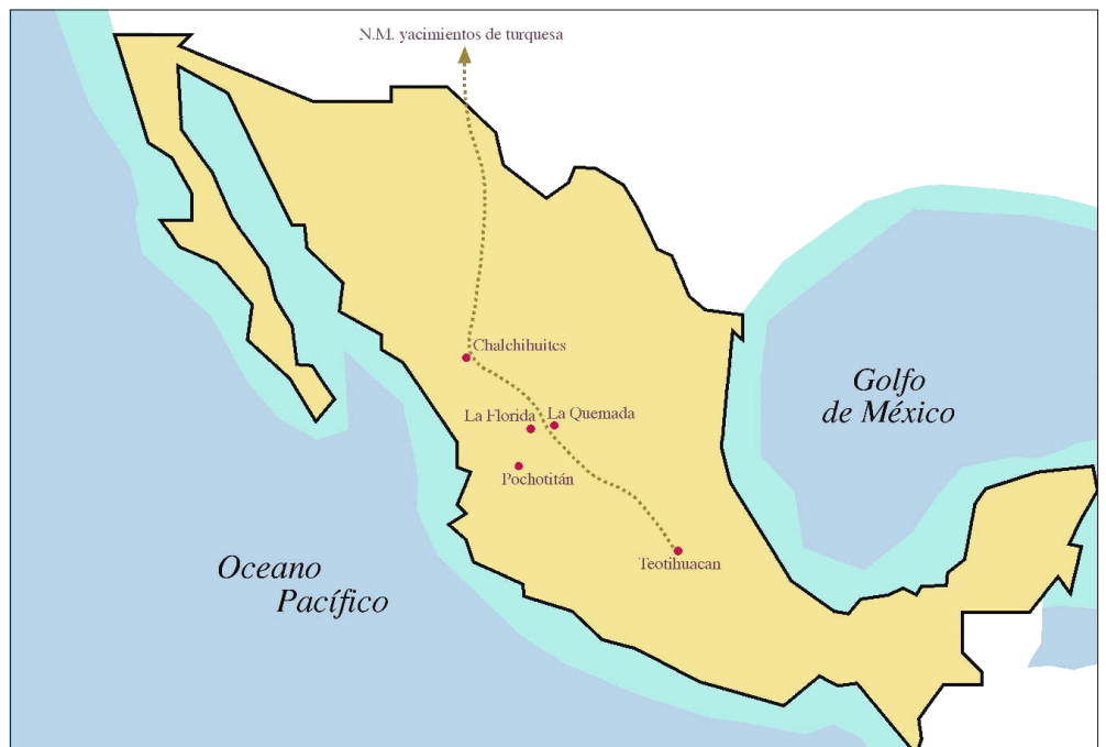
Figura 10. Mapa del comercio regional.

experiencia de las culturas en las regiones de Chalchihuites y de Bolaños, de su medio ambiente y su propio desarrollo; lo anterior no significa la veracidad de la realidad pasada, simplemente mi especial forma de ver las culturas en cuestión. Aun cuando reconozco la presencia de un complejo ceremonialismo religioso en estas representaciones pictóricas, también pienso que tendrían como base su entorno natural asociado con