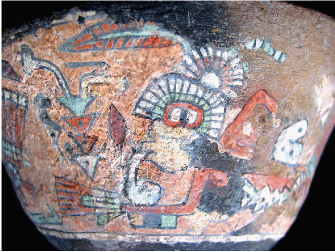
Figura 11. Personaje con una posible vírgula en la vasija de La Florida.