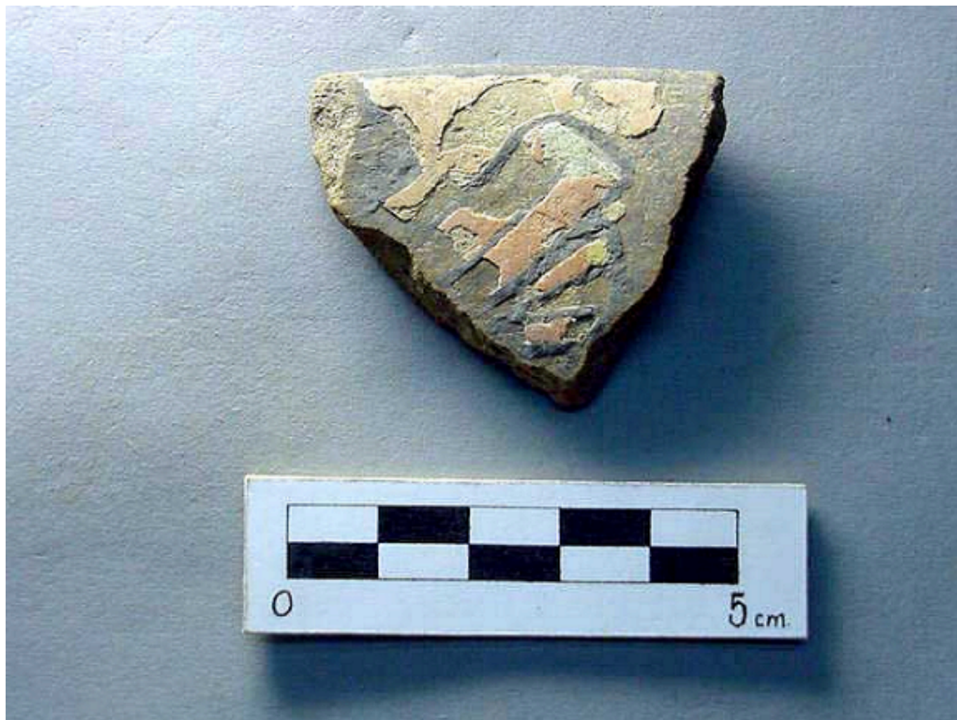
Figura 4. Tiesto de Pochotitán.

«Una forma primitiva de barro poroso y oscuro sobre cuyas paredes exteriores está adherida una capa de arcilla de diversos colores. Se nota primero una serie de contornos de arcilla negra de 2 a 4 mm y de 0.5 mm de espesor, los espacios libres presentan figuras humanas, de animales, frutos, flores, formadas por arcillas incrustadas en los espacios con colores: azul, verde, rojo y blanco» (Gamio 1910: 486).