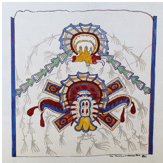
Figura 14. Palacio Atetelco en Teotihuacan. Representación de una biznaga. Dibujo: José Francisco Villaseñor.

cerámica arqueológica de México . Serie Investigaciones 16. México: INAH.