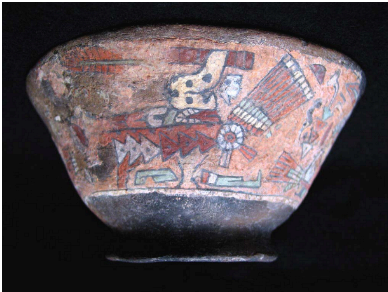
Figura 3. Vasija restaurada con decoración pseudo-cloisonné.

siones la cal fue substituida por material arcilloso» (Castillo 1968: 48).