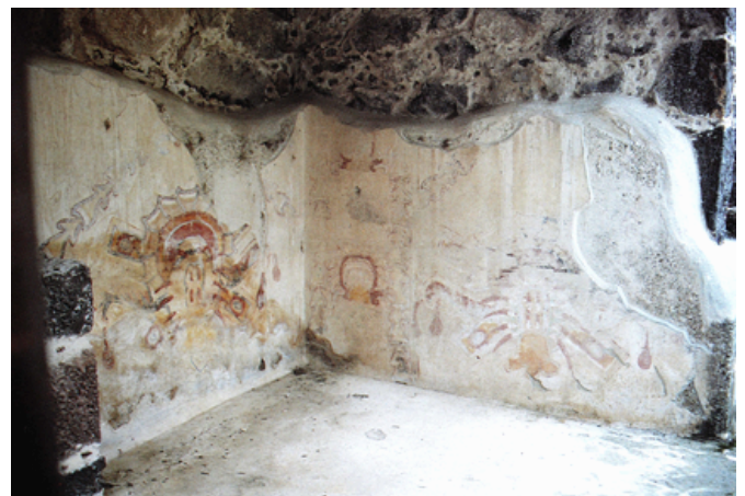
Figura 13. Palacio Atetelco en Teotihuacan. Mural con representación de biznaga. Foto: Pedro Cuevas (1992).

b) O bien que entró en el cañón de Bolaños desde el centro de Jalisco y llegó a Chalchihuites y a Teotihuacan a través del contacto con las rutas de intercambio mencionadas con anterioridad.