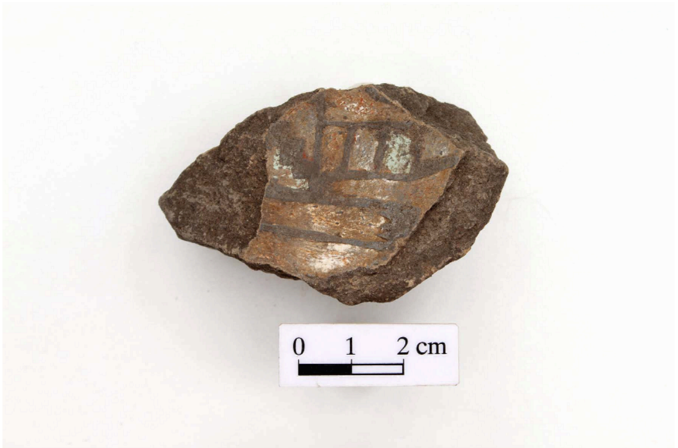
Figura 2. Fragmento de copa con decoración pseudo-cloisonné de La Florida.

metió a un tratamiento de restauración, logrando resaltar los motivos decorativos consistentes en elementos simbólicos, que representan posiblemente penachos, víboras y otros motivos vegetales. El tratamiento que se utilizó en esta vasija fue colocar una gruesa capa de cal de color rosa, sobre la cual se entresacaron los elementos decorativos en color rojo, verde y blanco delimitados por líneas negras. Con este repertorio de material cultural se tratarán de mencionar algunas derivaciones sociales, económicas e ideológicas en torno a este tipo cerámico.