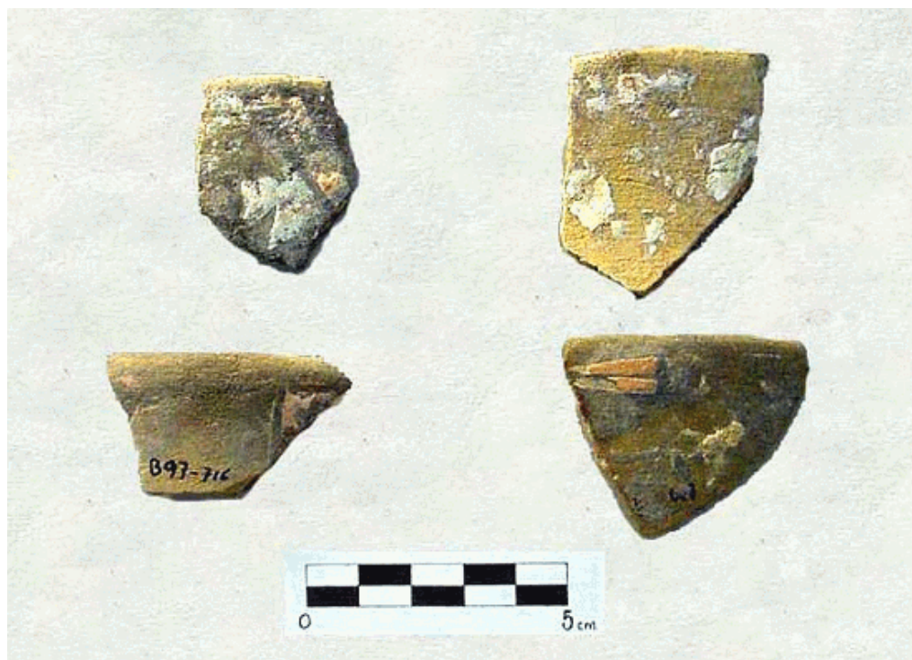
Figura 5. Tiestos de Pochotitán.

Ales Hrdlicka fue el primer investigador que penetró en el cañón de Bolaños; durante sus excavaciones en Totuate, situado en la parte norte del cañón, descubrió varios tiestos con este tipo decorativo; sin embargo, solo menciona «... que son únicos...» e ilustra dos vasijas completas sin citar su procedencia (1903: 396). Al describir el sitio de La Quemada, menciona el hallazgo de cerámica con decoración «incrustada» semejante a la de Totuate (Hrdlicka 1903: 437).