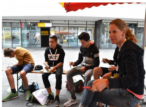
Abbildung 4: Rege Diskussion (eigene Darstellung)

Am ersten Tag wurden die Jugendlichen dazu aufgefordert, sich in den kommenden vier Tagen mit ihrer Identität und Rolle auseinander zu setzen. Anhand von Postkarten mit verschiedenen Gesichtern (jung, alt, Mann, Frau usw.) wurde zusammen diskutiert, was die eigene Identität ausmacht, wie diese bewusst verändert werden kann und welche Risiken aber auch Chancen sich im Zusammenhang mit Neuen Medien ergeben. Die Erkenntnisse aus den Diskussionen wurden für den Einsatz am Nachmittag als ReporterInnen auf einem Flip festgehalten.