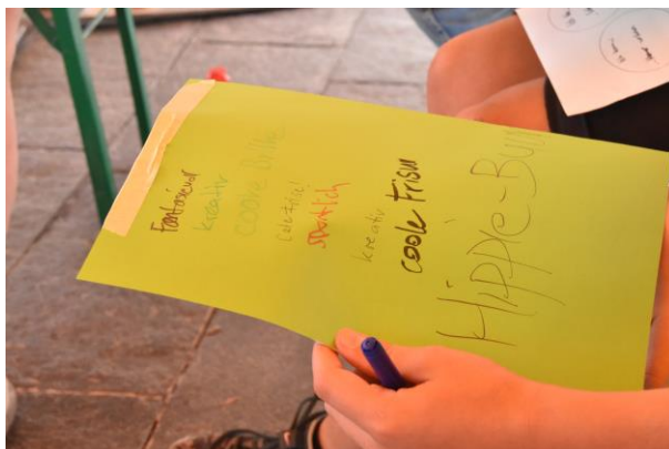
Abbildung 6: Feedback geben (eigene Darstellung)

Am dritten Tag erklärte die bestehende Gruppe, aufgeteilt in zwei Kleingruppen, den neu dazugekommenen Jugendlichen anhand eines Steckbriefs aus der Zeitung, was sie bis anhin zum Thema ‚Identität und Rolle‘ gehört hatten. In einem nächsten Schritt überlegten die Jugendlichen für sich selbst, wie sie wirken und von anderen wahrgenommen werden und hielten die Ergebnisse auf einem Arbeitsblatt fest. Danach wurde die Perspektive verändert bzw. alle aufgefordert, den anderen ein schriftliches Feedback auf einem auf dem Rücken klebenden Blatt zu geben. Zum Schluss wurde das Selbst- und Fremdbild verglichen und einige Jugendliche gaben Auskunft darüber, was sie gefreut hat, was sich bestätigt hat oder was sie besonders überrascht hat.