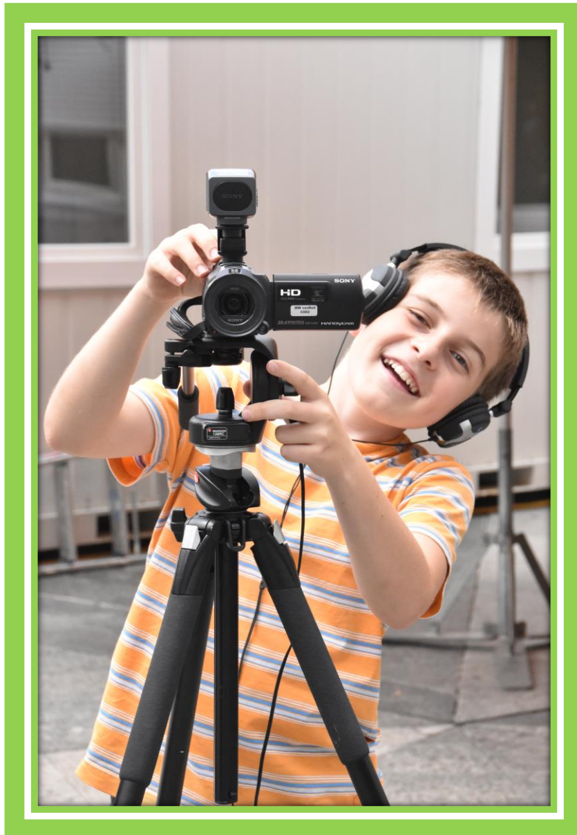
Abbildung 1: Jugendreporter (eigene Darstellung)

Ein neues, mediales Angebot für den Thuner Ferien(S)pass