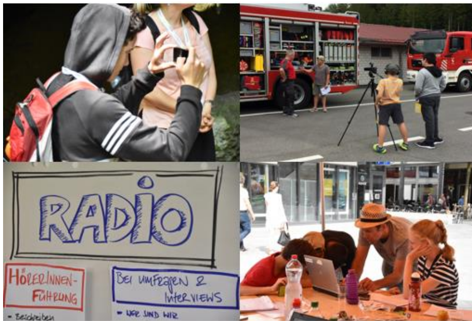
Abbildung 8: Impressionen aus den Projekttagen

Planung dar. Es brauchte viele Absprachen, auch mit den engagierten externen Fachpersonen, damit die Übergänge zwischen den einzelnen Tagesfenstern klappten und nicht zu viele Wiederholungen entstanden. Die Geduld und die Aufmerksamkeitsspanne der Jugendlichen wurden dadurch mehrmals auf die Probe gestellt. Das Credo ‚weniger ist mehr‘ und viele praktische Übungen anstatt langer Vorträge wären belebender gewesen. Für gewisse Themen, wie beispielsweise Radio, wäre es aufgrund der Fülle an Informationen und neuem Wissen optimaler gewesen, dieses auf zwei Tage aufzuteilen.