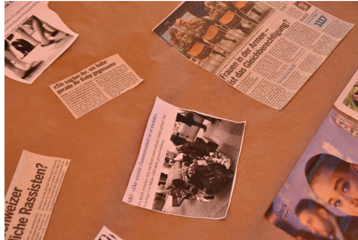
Abbildung 7: Zeitungsschlagzeilen (eigene Darstellung)

Der letzte Tag war dem Thema ‚Ethische Aspekte im Zusammenhang mit der eigenen Identität und Rolle‘ gewidmet. Ein vorbereitetes Plakat mit teils skurrilen, provozierenden und zum Nachdenken anregenden Zeitungsschlagzeilen und Bildern diente als Grundlage für eine angeregte Gruppendiskussion.