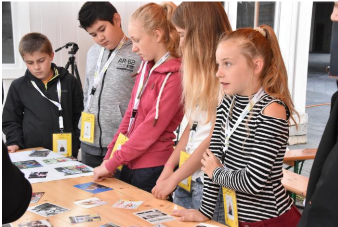
Abbildung 5: Die Gruppe diskutiert verschiedene Rollenbilder (eigene Darstellung)

Der zweite Tag war dem Thema ‚Rolle‘ gewidmet. Wiederum befassten sich die Jugendlichen anhand von verschiedenen Bildern in einer angeregten Diskussion mit verschiedenen Rollen. Ziel war den Unterschied zur Identität herauszufinden und sich bewusst zu werden, in welchen Rollen man sich mehr oder weniger wohl fühlt sowie die Gründe dafür zu suchen. Dies geschah mittels zwei verschiedenen farbigen Post-it in Einzelarbeit. Abschluss bildete eine Sammlung von Vorteilen, Nachteilen aber auch von der Verantwortung, die man in der Rolle als JugendreporterIn des Thuner Ferien(S)passes hat.