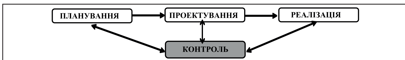
Рисунок 2. Стадії освоєння простору

Опираючись на дане узагальнення, виникає необхідність сформулювати інституціональний закон просторового планування – неможливість використання необхідного простору для існування, розташування та господарювання інституцій, які виступають фактором суспільних перетворень і є основною причиною їх повної відсутності.