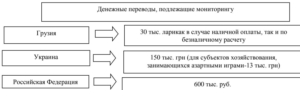
Рис. 1. Денежные переводы, проводимые в Грузии, Украине и РФ, которые подлежат государственному финансовому мониторингу

Законами этих государств определены финансовые операции, которые подлежат финансовому мониторингу, в том числе и денежные переводы (рис. 1).