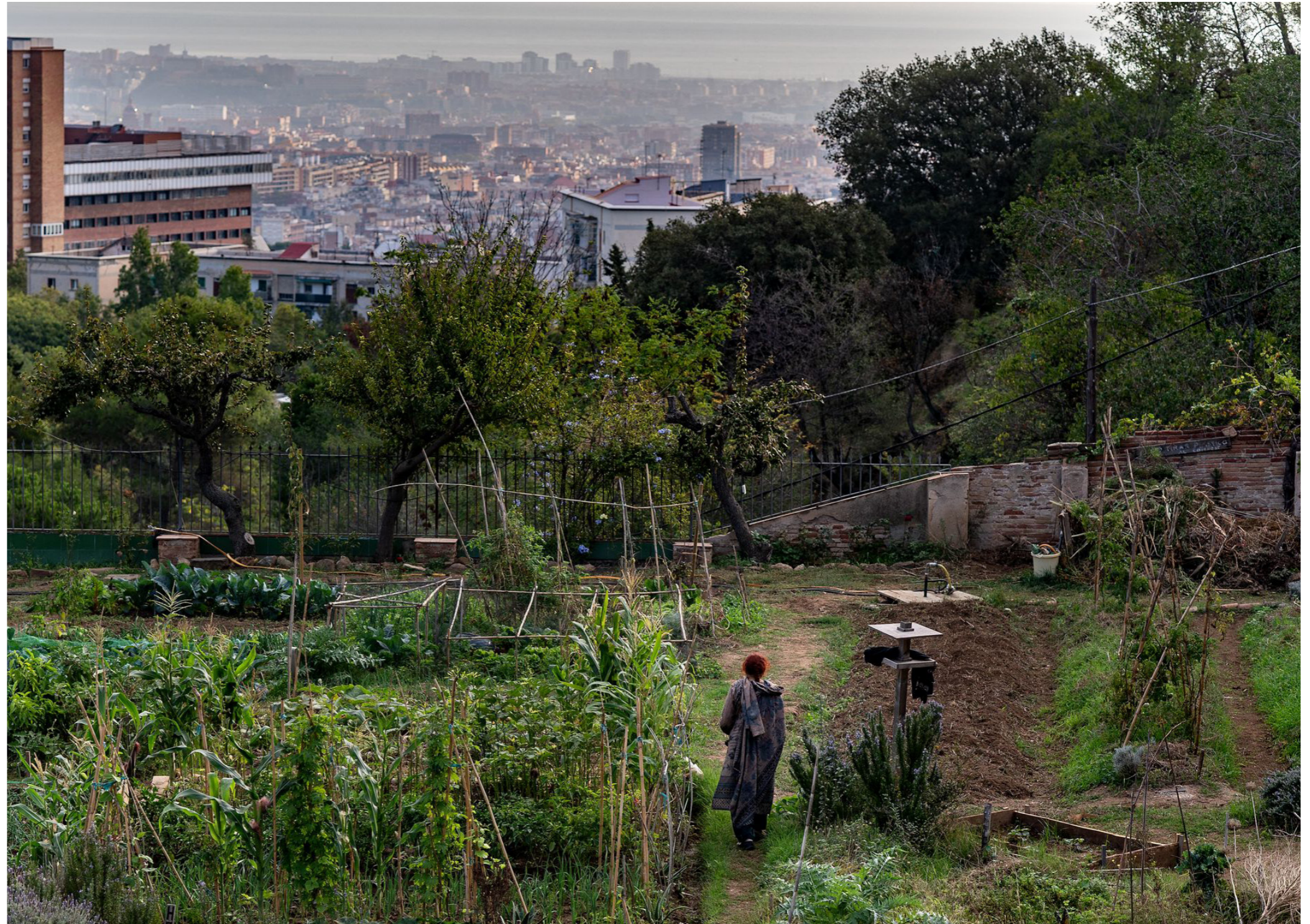
Hort urbà de Can Soler

Un possible punt d'inflexió en l'àmbit dels horts comunitaris de la ciutat és el projecte Agrovallbona. Implica la transformació de les últimes terres agrícoles de Barcelona (6,5 ha) en un complex agroecològic combinant sòl productiu amb horts comunitaris. Aquest projecte s'ubicaria en una de les zones de renda més baixa de Barcelona, i es convertiria en l'hort comunitari més extens de la ciutat. Si es materialitza, també podria esdevenir un projecte exemplar basat en principis de justícia ambiental. El projecte Agrovallbona, però, és un projecte a llarg termini que haurà de sobreviure a molts canvis polítics en el govern local. L'actual primera fase implica una modificació innovadora de l'estatut del sòl que atorgaria protecció i asseguraria el seu ús agrícola: de sòl urbanitzable a sòl no urbanitzable (Ajuntament de Barcelona 2023e). Si es materialitzés, aquest canvi es convertiria en una fita legislativa única i pionera per expandir i protegir els horts urbans arreu del món.