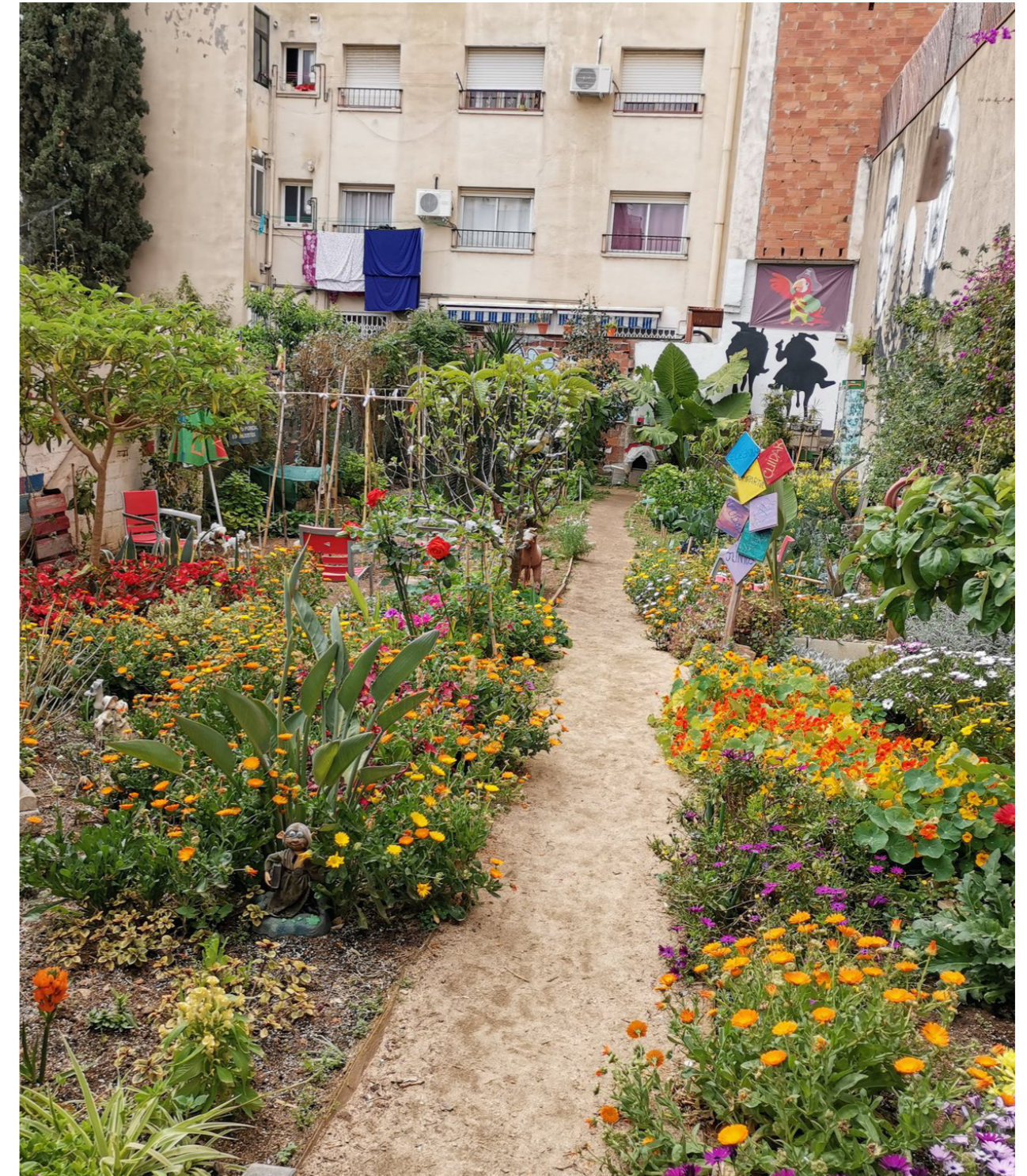
Hort okupat Date una huerta

Al 2015, una sèrie d'associacions d'aquí del barri fan un petit manifest perquè ja se sabia que aquí vindrien els horts urbans. Llavors fan un petit manifest dient que d'alguna manera que això de que sol fos per a jubilats... que es podria intentar fer d'una altra manera. Això dona peu a que aquesta gent s'organitzés i una sèrie d'entitats del barri es van estar reunint fins que van arribar a concretar un petit projecte, que es va ampliar bastant en assemblees a posteriori, per a que l'Ajuntament cedís aquests terrenys a una associació que es va crear a tal efecte per a poder gaudir d'aquest entorn que és realment màgic, meravellós i realment sembla que no estiguis a Barcelona.[...] Vam entrar al maig de 2019 [...] Som el primer hort comunitari reglat de Barcelona. [...] La normativa deia que els horts eren per a persones de més de 65 anys. Nosaltres som l'excepció. Nosaltres tenim des d'associats de 3 anys fins a 90, amb tot el rang d'edat i per suposat, sexe i religió. (Entrevista 4)