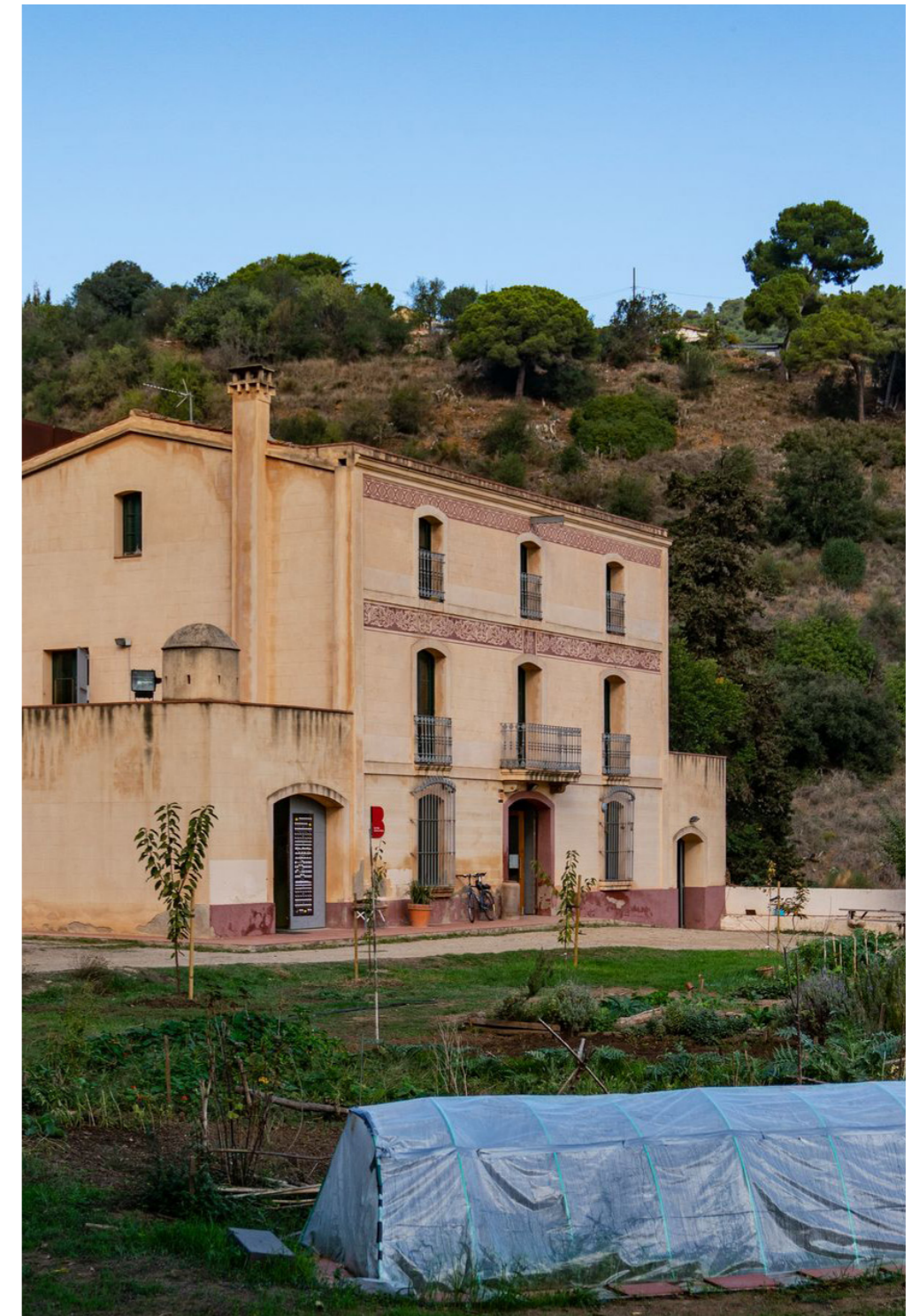
Centre de natura de la masia de Can Soler

Alguns ajuts públics addicionals podrien finançar potencialment horts comunitaris tot i no centrar-se estrictament en els horts urbans (per exemple, subvencions d'acció comunitària o Impulsem el que fas, que finança projectes d'economia social i solidària, o Pla Clima, que finança projectes de lluita contra l'emergència climàtica). Tot i així, molt poques vegades han finançat horts comunitaris.