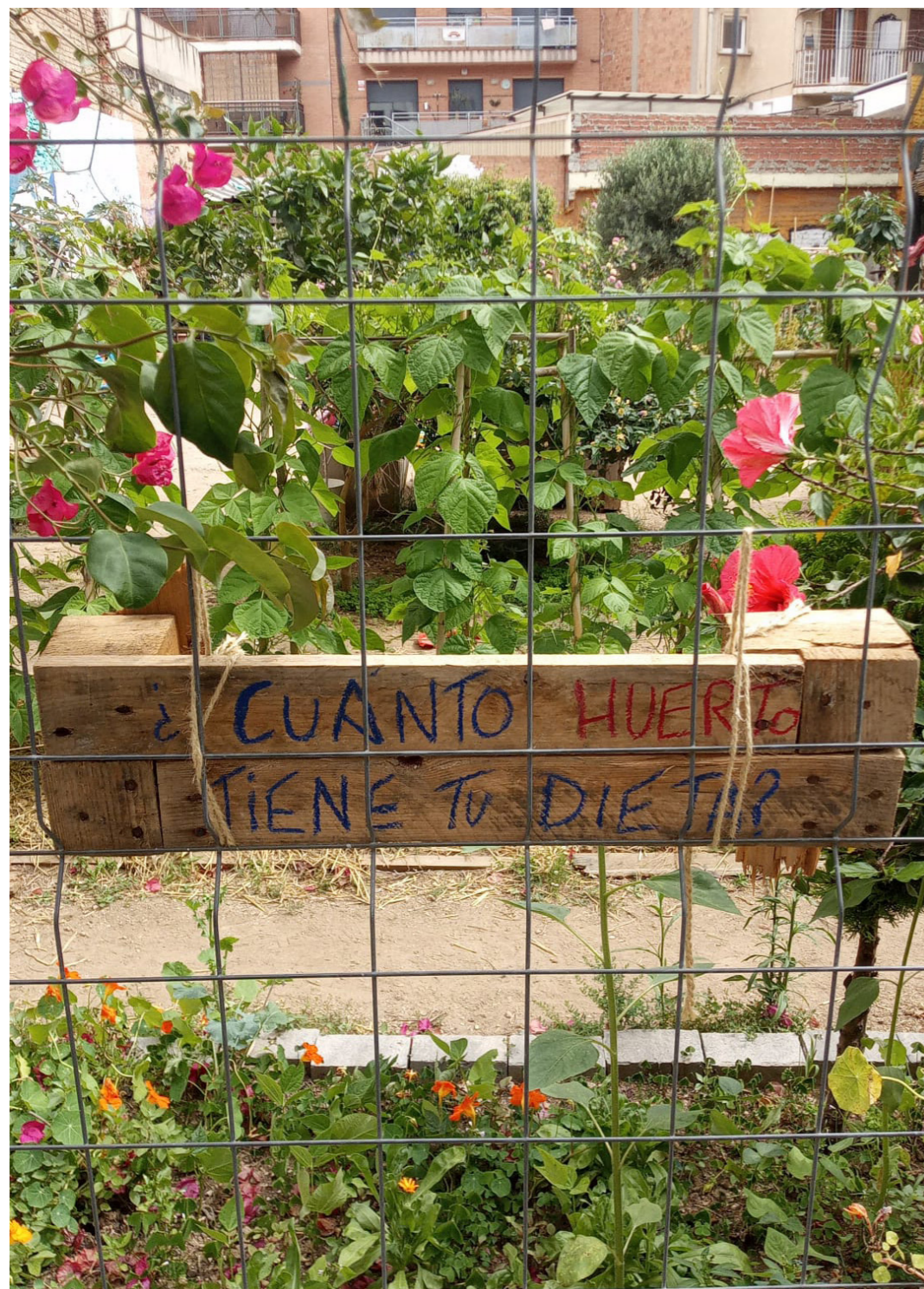
Hort okupat de l'Horta Alliberada (Sants)