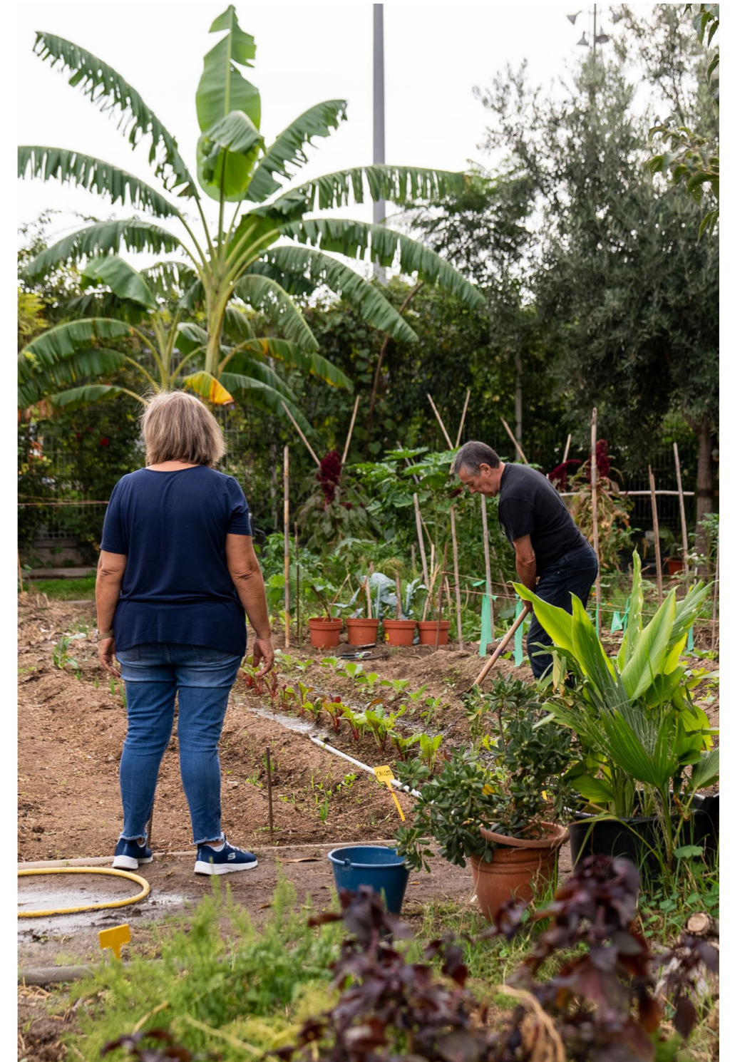
Hort urbà de Can Valent