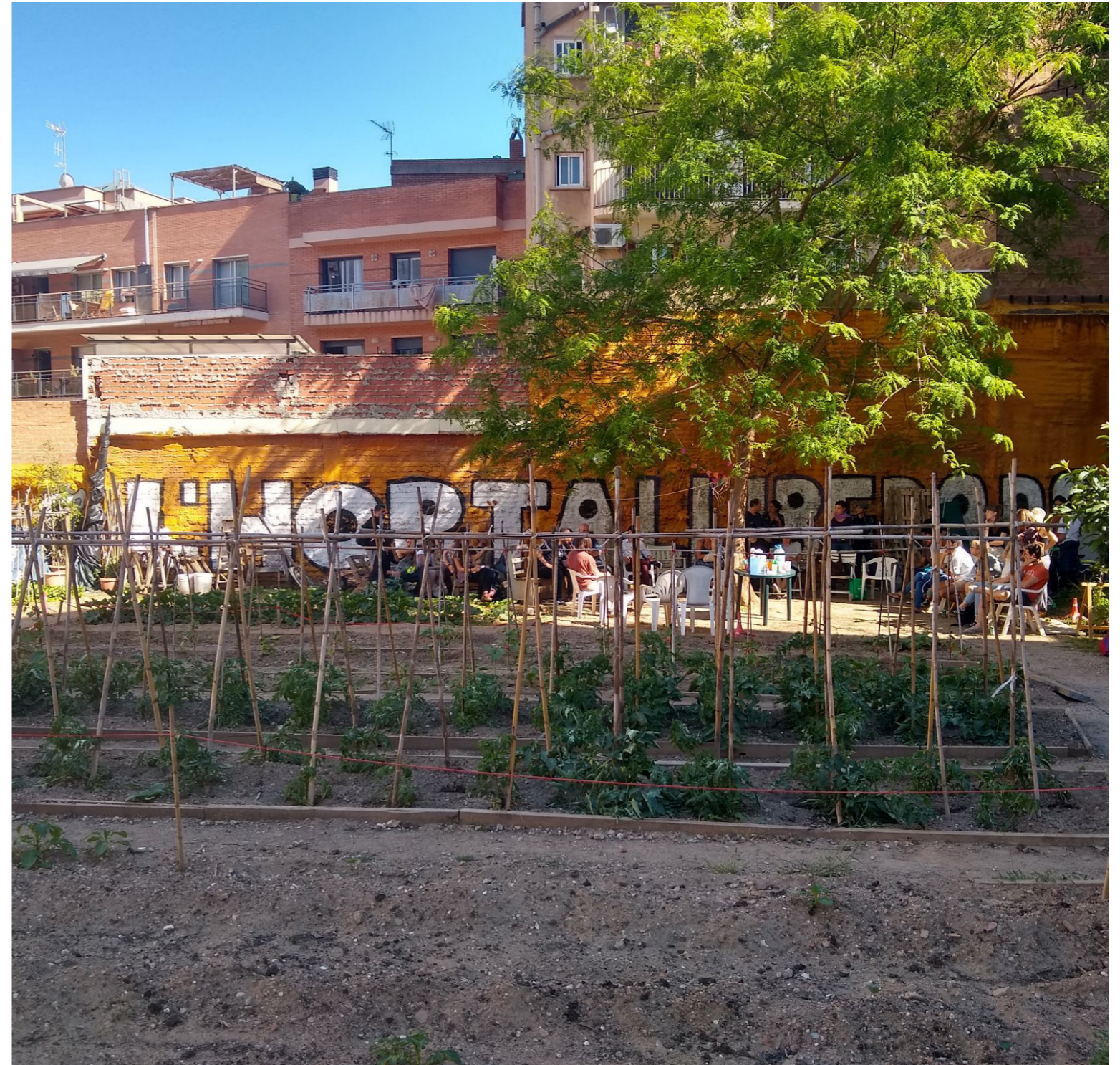
Hort okupat de l'Horta alliberada

oberts a la resta de la societat. El seu ús està restringit excepte si es mostra el projecte a tercers que tenen com a objectiu conèixer-lo (com altres projectes, museus, escoles, etc.).