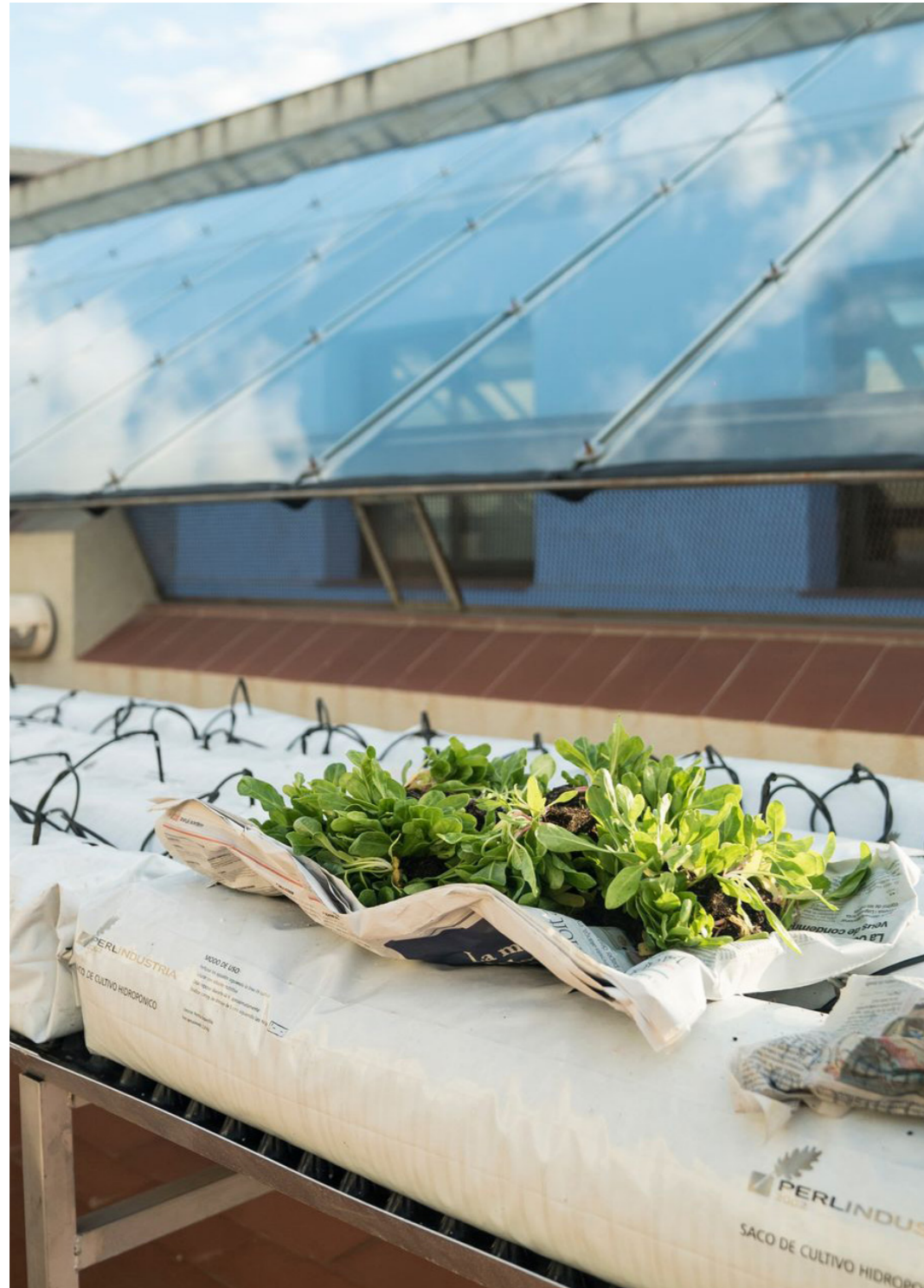
L'hort del terrat

dir, des de tots els àmbits, districtes i professionals implicats (EAU, 2019). Com va dir un entrevistat: