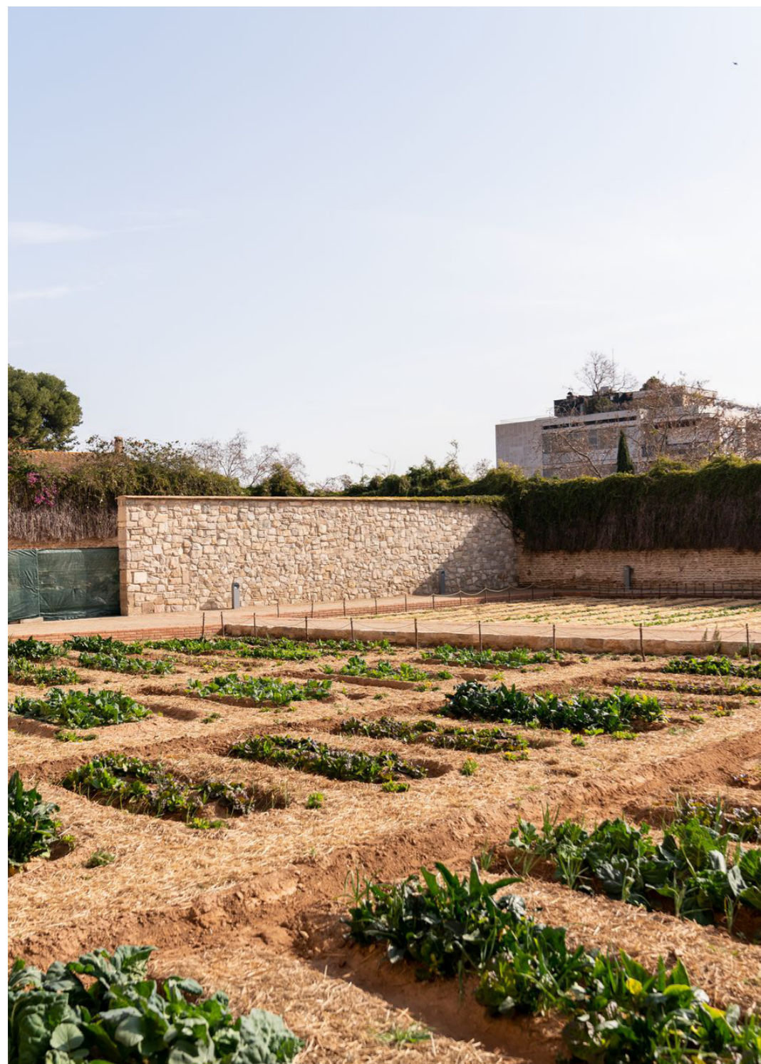
Hort medieval del Monestir de Pedralbes