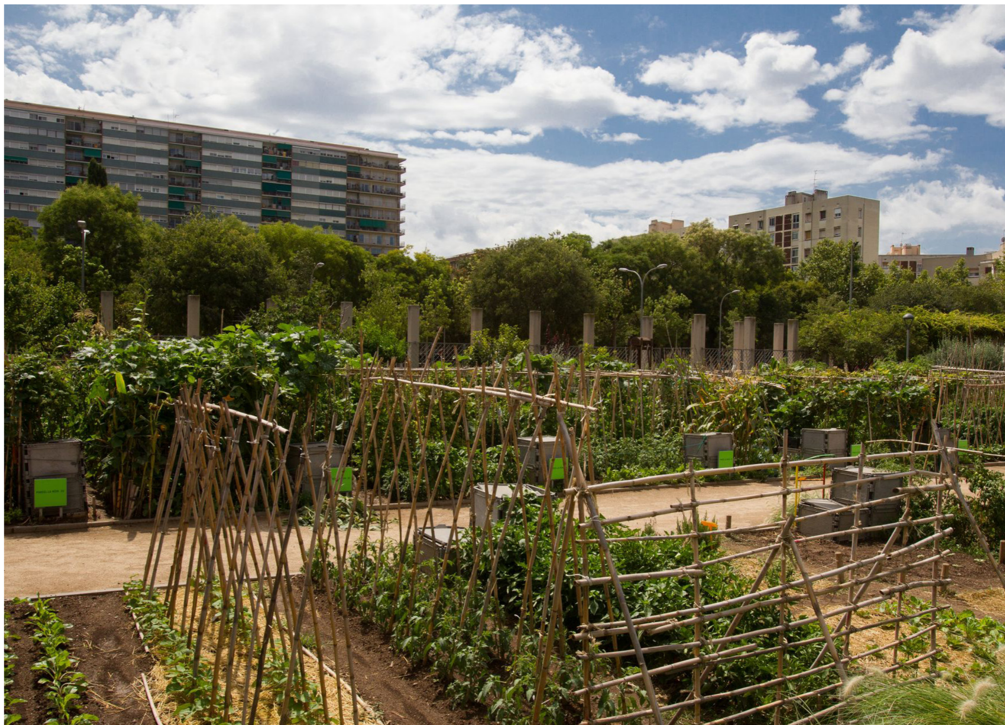
Hort de Can Cadena

L'objectiu principal d'aquest informe és millorar la comprensió sobre la governança que envolta les iniciatives d'horts d'alimentació compartida a Barcelona. Això implica, d'una banda, entendre el marc normatiu i regulador que afecta i condiciona la pràctica d'aquestes activitats, així com conèixer el mapa d'actors implicats en les iniciatives, i entendre el tipus de relacions que s'estableixen entre aquests actors implicats. Així mateix, per poder entendre la governança dels horts d'alimentació compartida és imprescindible apreciar i descriure la diversitat de projectes d'horts compartits que existeixen a la ciutat, així com identificar qui són els seus principals beneficiaris. A més, també és fonamental visibilitzar els principals obstacles que dificulten els beneficis d'aquestes iniciatives i els elements facilitadors que en promouen l'èxit. El propòsit final d'aquest informe és proporcionar recomanacions tant per al govern local com per a les iniciatives d'alimentació compartida i també per al sector privat per donar suport a l'expansió i millora dels horts d'alimentació compartida.