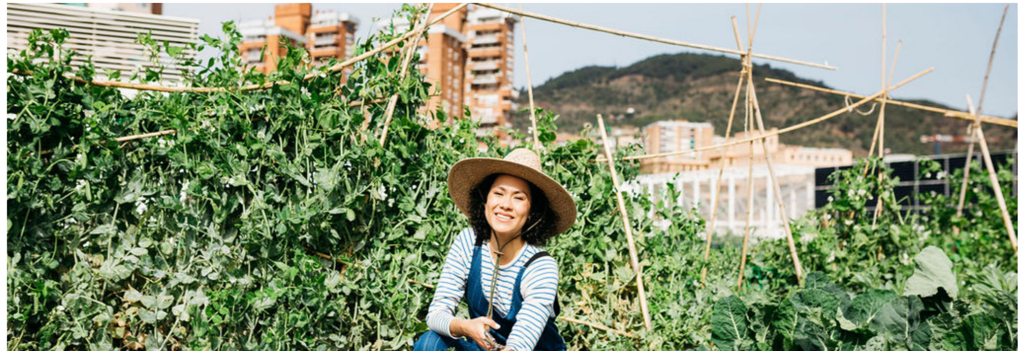
Hort del Mercat de la Vall d'Hebron

ho són, així com entendre més a fons com té lloc l'agricultura urbana d'alimentació compartida a la ciutat de Barcelona. La principal diferència entre aquestes dues categories es basa en les diferents finalitats primàries dels projectes agrícoles urbans i en el diferent pes que la productivitat i el benefici econòmic tenen sobre els beneficis socials i ambientals (és a dir, la productivitat també pot ser relativament important en alguns casos, però no la seva finalitat primordial). Per tant, els horts urbans on es comparteix alguna cosa, d'ara endavant anomenats "horts d'alimentació compartida", són horts urbans on la finalitat primordial del projecte en el seu conjunt està més vinculada amb els beneficis socials que ofereixen (per exemple, la creació de comunitat, la realització d'exercici, aprenentatges, etc.) que amb la seva dimensió productiva, que també podria tenir un paper important, però no seria l'objectiu únic i primordial.