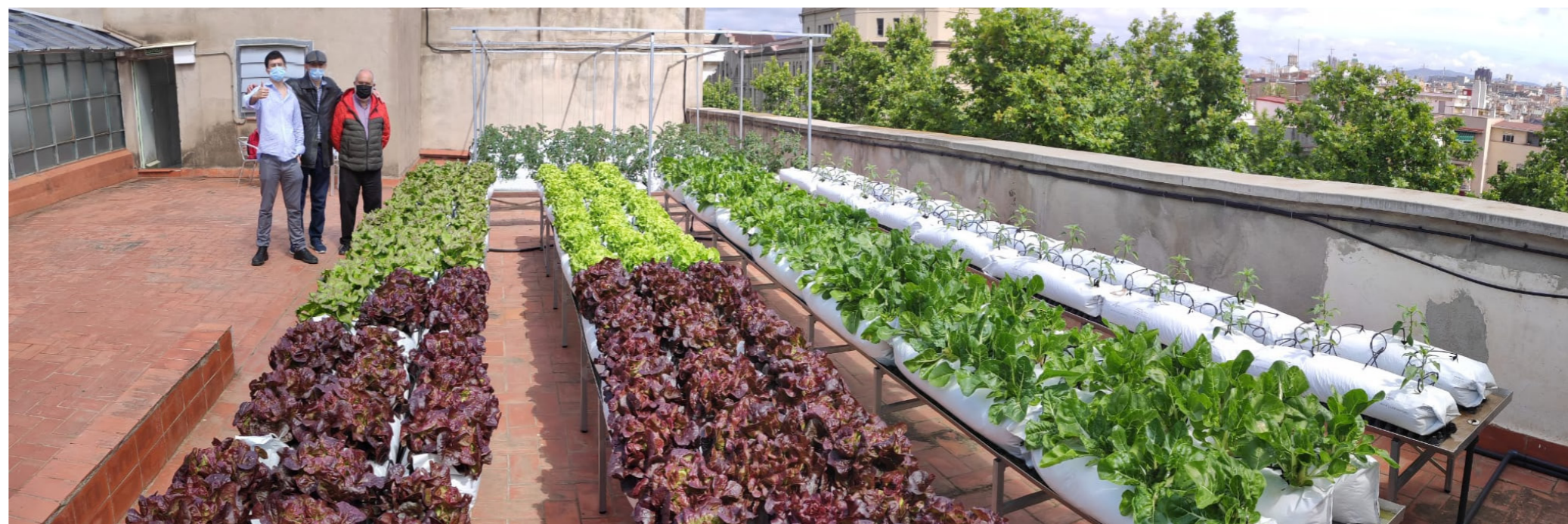
L'hort del terrat

Malgrat el discurs institucional positiu, el suport als horts d'alimentació compartida és mínim. Mentre que l'Ajuntament advoca per democratitzar l'accés a l'hort, els espais d'horts continuen sent mínims en comparació amb les dimensions de la ciutat . Hi ha una necessitat urgent de més espai, suport institucional i finançament privat / públic per ampliar els horts.