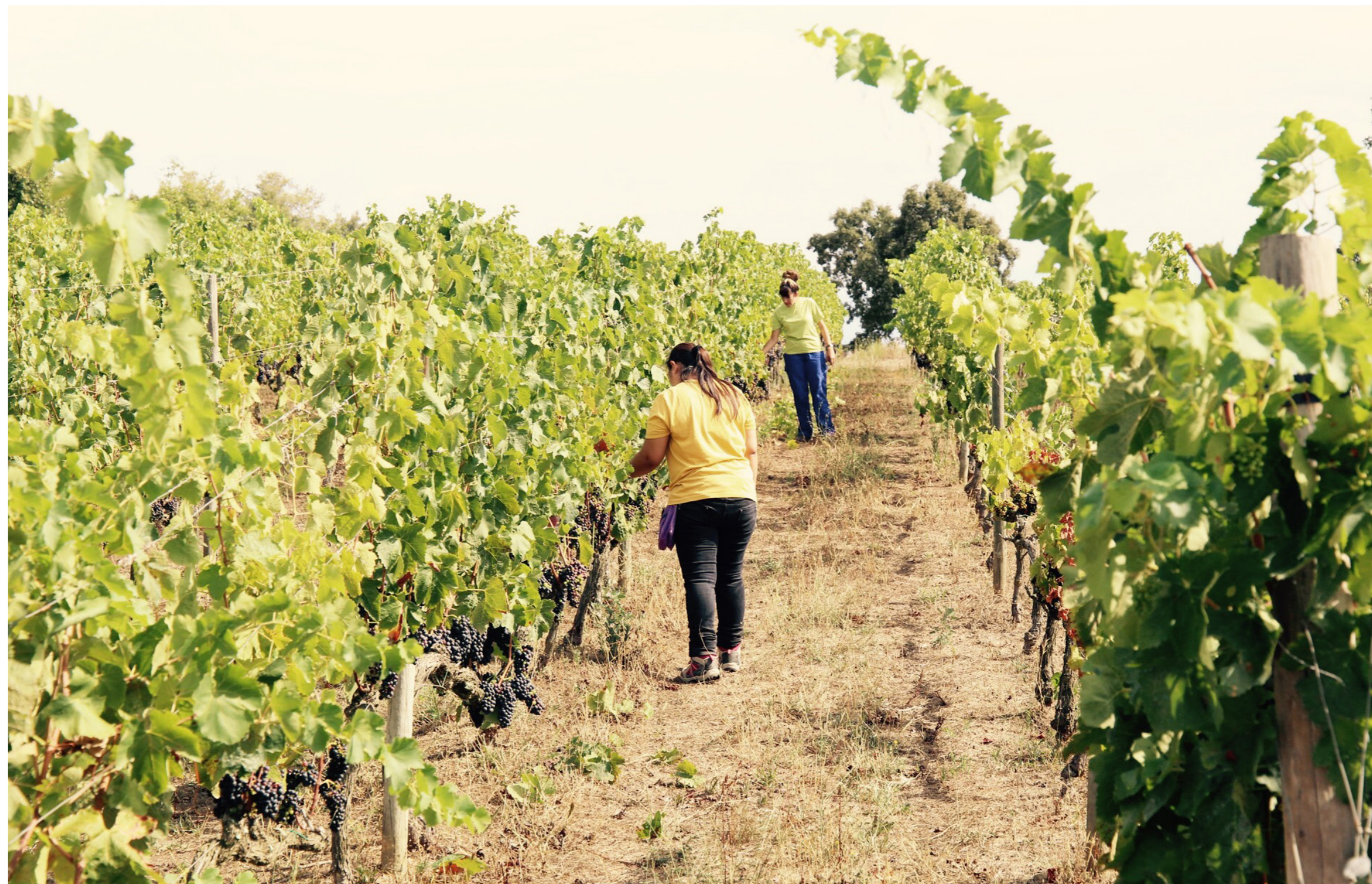
Can Calopa de Dalt

Les explotacions agrícoles d'agricultura social són projectes dirigits per organitzacions econòmiques, la finalitat principal de les quals no és la lucrativa sinó promoure el benestar social a través d'aspectes com la salut, el treball i l'empoderament de col·lectius en risc d'exclusió social. En molts casos són constituïdes com a cooperatives. A Barcelona, només un projecte entra en aquesta categoria: Can Calopa.