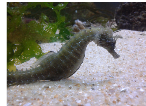
Novo aquário da zona inframareal Da Ria Formosa