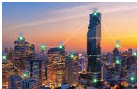
Cloud connection of a lift system. / Connessione Cloud di un sistema di ascensori.