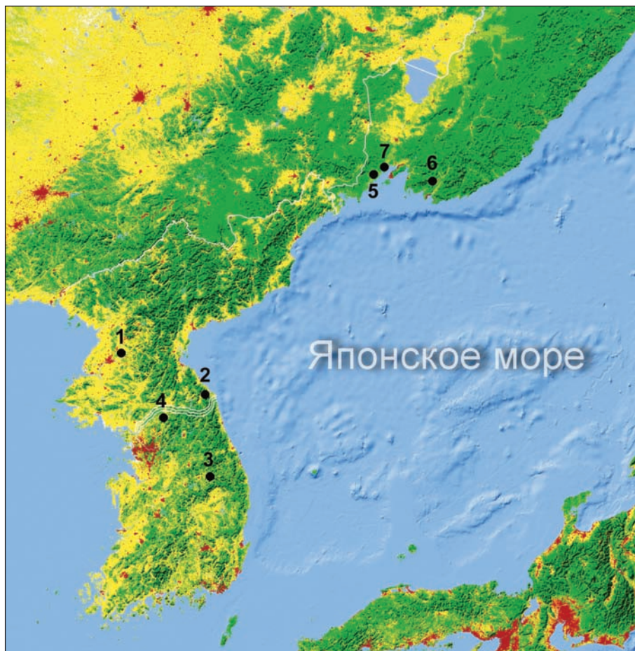
Рис. 2. Известные местообитания улитки Eostrobilops coreana : 1 – Северная Корея, окрестности Пхеньяна; 2 – Северная Корея, Канвондо, хребет Кымгансан; 3 – Южная Корея, Чхунчхон-Пукто, окрестности г. Танян; 4 – Южная Корея, Канвондо, окрестности д. Синчервон; 5 – Приморский край, заповедник Кедровая падь; 6 – Приморский край, хребет Лозовый, пещера Медвежий Клык; 7 – Приморский край, п-ов Песчаный. Условные обозначения: зеленый цвет – леса различной плотности, красный – урбанизированные территории, желтый – сельскохозяйственные земли (по: Jakub [2018]).

на северном пределе своего природного ареала, несмотря на гораздо большую плотность лесного покрова (рис. 2), мало нарушенные дальневосточные смешанные леса с корейским кедром и черной пихтой сохранились лишь на небольших