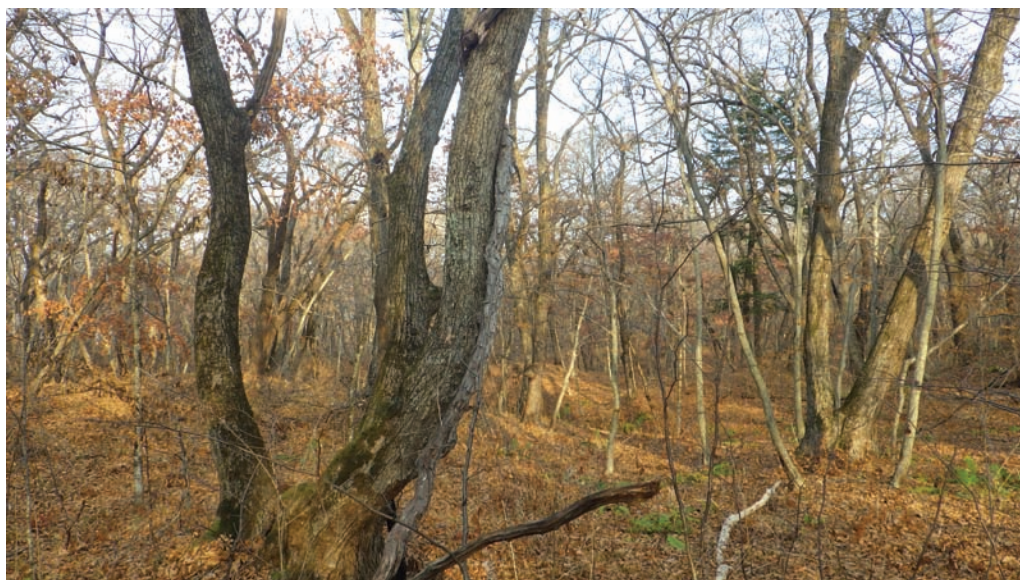
Рис. 4. Смешанный лес в месте обитания Eostrobilops coreana в северной части п-ова Песчаный.