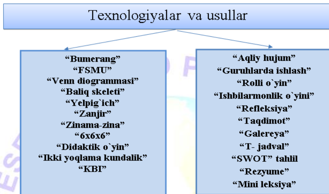
3-rasm. Rivojlantiruvchi ta'limning ayrim texnologiya va usullari

Rivojlantiruvchi ta'limning ayrim texnologiya va usullari: (Ilovalarga qarang.) (3-rasm qarang)