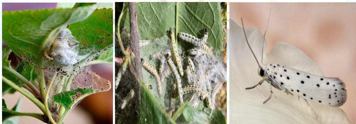
1-rasm. Olma kuyasi Yponomeuta malinellus L. ytuk zoti, tuxum va lichinkalari.

Lichinkalari tuxumdan chiqib namlikka chidamli qalqon ostida qishlash uchun qoladi. Qishdan oldin u tuxum qobig'i va daraxt po'stlog'i bilan oziqlanadi va sovuq kelganda diapauza tushadi. Lichinkalar qalqonlarning ostidan chiqishi aprelning ikkinchi yarimida o'rtacha sutkalik harorat + 12 dan oshib ketganida kuzatiladi. Birinchi yoshda lichinkalar barg eti bilan oziqlanadi, pastki va ustki terisini butun holda qoldiradi. Katta yoshdagi lichinkalar o'rgimchak to'ridan uya to'qiy boshlaydi. Barglar juft bo'lib bog'lanadi, lichinkalar bu barglarni kemirib oziqlanadi. Zararlangan barg jigarrang tusga kiradi buralib qoladi. Ko'pincha barglar butunlay asosiy tomirlarga zararlanadi, shundan so'ng lichinkalar qo'shni shoxlarga o'tadi va o'rgimchak uyalarining koloniyalarini hosil qiladi. Lichinkalar yuqoridan novdaning pastiga qarab ko'chib boradi va barglarni butunlay yo'q qiladi. Butun koloniya qo'shni shoxlarga o'tadi. Quruq va issiq ob-havo qurtlarni rivojlanishi uchun eng qulaydir. Lichinkalarning oziqlanish davri 35-42 kun davom etadi, keyin ular o'rgimchak uyasida g'umbakka aylanadi. Har bir lichinka o'zi pilla to'qiydi.