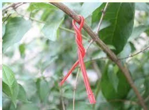
7-rasm. Dezorientasiya uchun feromonlar (chalg'itish).

Dezorientasiya uchun feromonlar (chalg'itish). Usulning mohiyati bog' yoki uzumzorning atmosferasini sintetik feromon juftlari bilan to'ldirishdir, buning natijasida erkaklarning "dezorientasiyasi" ta'siri kuzatiladi: ular urg'ochi kapalaklarni aniqlay olmaydi va natijada urg'ochilar tuxum qo'ymaydi.