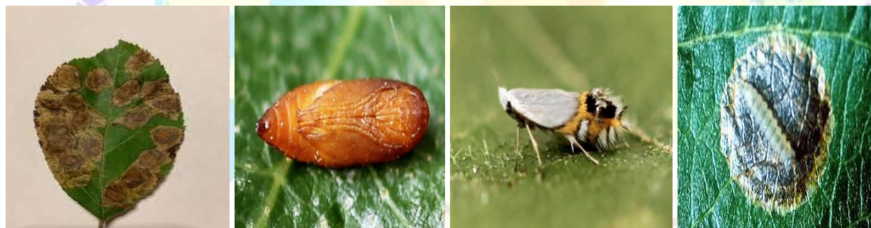
2-rasm. Do'lana girdak kuyasi - Cemiostoma scitella L.ning zarari.

Rivojlanish sikli. Old qanotlari kumushrang kulrang-oq rangga ega, qanot tepasida 3-4 ta uzuq chiziqlari bor. Orqa qanotlari kulrang.