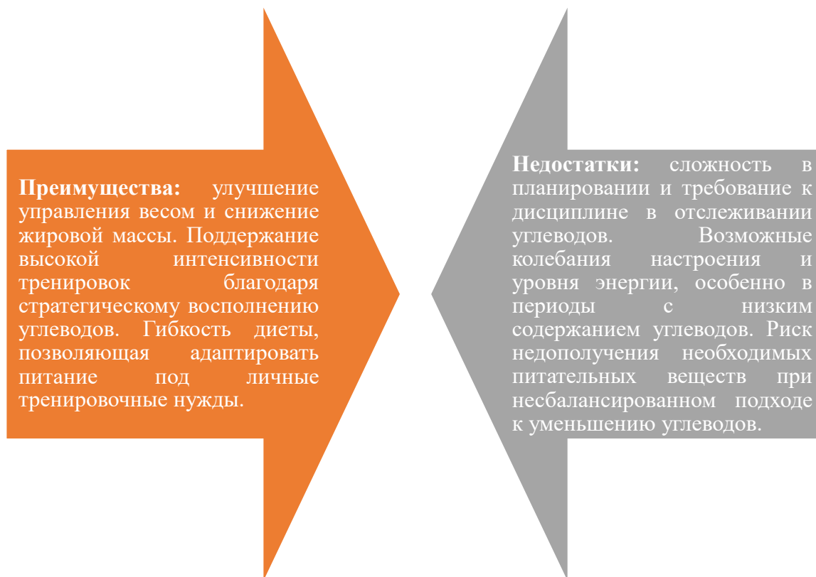
Рис. 1. Таблица преимуществ и недостатков карбоциклинга

Рассмотрим теперь преимущества и недостатки такого метода (рисунок 1).