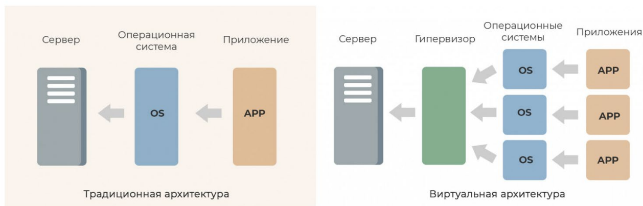
Рис. 1. Типы архитектуры [3]

Возможности, предоставляемые виртуальными машинами, отражают возможности физических машин, но виртуальные машины не работают непосредственно с аппаратным обеспечением компьютера. Вместо этого существует «гипервизор», который действует как посредник между оборудованием и виртуальной машиной. Этот средний уровень служит для защиты главного компьютера, а также для создания виртуальной машины и управления ею.