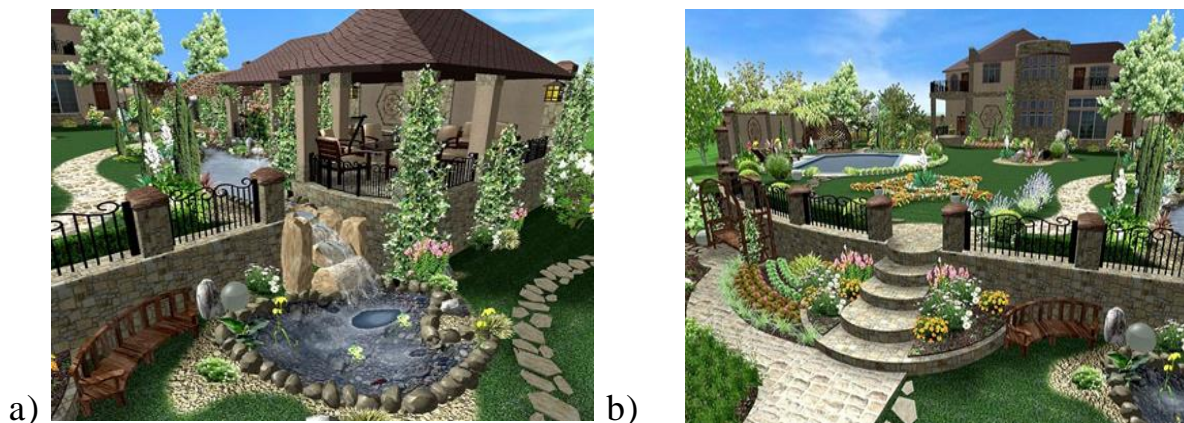
a,b-rasm. Landshaft muhitida MAFlarning qo'llanilishi