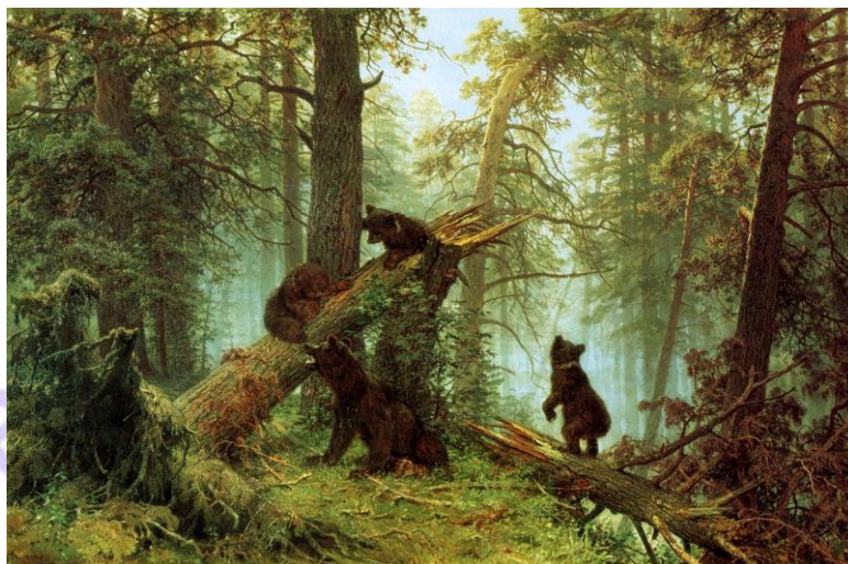
Shishkin “Qarag'ay o'rmonidagi tong”

“Issiqko'l oqshomi” kartinalarida shu holni kuzatish mumkin. Tasviriy san'at asarlarida, jumladan, manzara janrida yaratilgan asarlarda rassomning borliqdan olgan taassurotlari, voqealikka g'oyaviy, hissiy munosabati ham aks etadi.