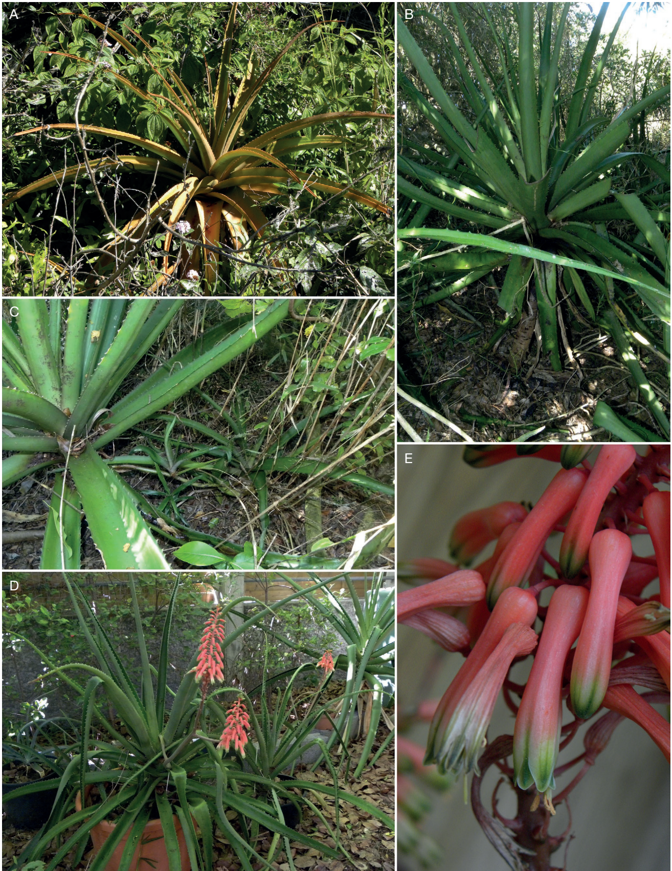
FIG. 1. — Aloe maningoryensis J.-P. Castillon, sp. nov.: A , plante exposée au soleil ; B , port général, avec sa tige sans feuilles persistantes ; C , un gros plant acaule produit une bulbillé qui, à peine enracinée, produit elle-même une autre bulbillé ; D , plante en culture ; E , détail des fleurs.