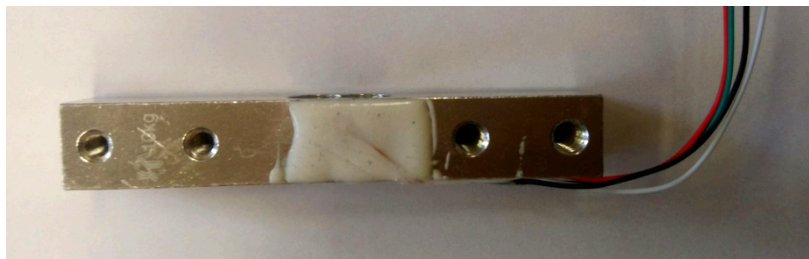
Slika 1: Merne trake koje su postavljene na senzor mase koji može da meri do 10 kg. Za merenje se koristi HX711AD modul (uputstvo je dostupno na https://www.digikey.com/htmldatasheets/production/1836471/0/0/1/hx711.html , pristupljeno 24.03.2024). Fotografisano na Elektrotehničkom fakultetu Univerziteta u Beogradu.