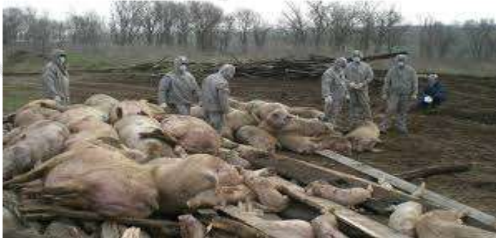
2.6-rasm. Kuydirgi kasalligining tarqalishi.

Etiologiyasi: Kuydirgini qo'zg'atuvchi mikrobn birinchi marta 1855 yilda shu kasallikni nobud bo'lgan ot organizmidan rus olimi Brauelar topgan. Kuydirgi mikrobi (Bakteriya anthacis) uzunligi 5-8mkm., yo'g'onligi 1-1,5 mkm. keladigan tayoqchadir. Mikroskop ostida zanjirga o'xshab qator bo'lib joylashadi. Tayoqchanning vegetativ formasi yuqori temperaturada va turli dezinfeksiyalovchi moddalar ta'sirida bir necha minut ichida halok bo'ladi. Sporalari esa tashqi muhitga juda chidamli, qaynatilganda 30 minutdan keyingina parchalanadi. Tuzlangan go'shtlarda uzoq saqlanadi. 70S dagi issiqda sporalar bir necha soatgacha halok bo'lmaydi.