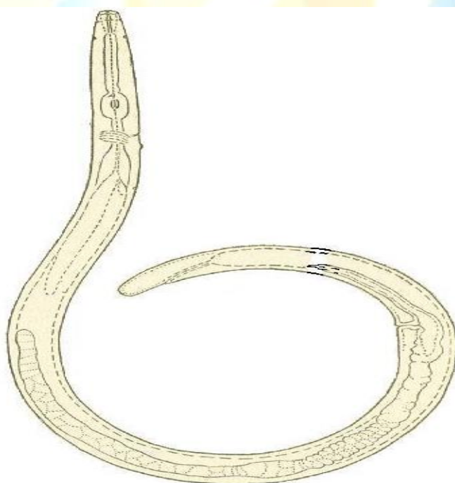
Rasm 1. Suli nematodasi - Aphelenchus avenae (Bastian, 1865).

Ushbu nematodaning urg'ochi va erkak jinslarining uzunligi 0,5-0,9 mm. Erkak jins urg'ochisidan 0,1-0,2 mm kaltaroq bo'ladi. Kutikulasi nozik va mayda halqalardan iborat. Boshi dumaloq shaklda va u gavdasidan sezilarli chegara bilan ajralib turadi. Stiletga aylangan og'iz bo'shlig'ining uzunligiga 13-14 mkm, uning bazal (asosi) qismi yo'g'onlashmagan. Stiletini protraktorlari (harakatga keltiruvchi muskul tolachalari) ignaga nisbatan burchak hosil qilib birlashgan. Qizilo'ngachning oldingi qismi ensiz, orqaga qarab kengayib boradi. Qizilo'ngachning o'rta qismidagimetakarpal bulbusi oval shaklda. Uning qopqoqchasi (klapani) aniq