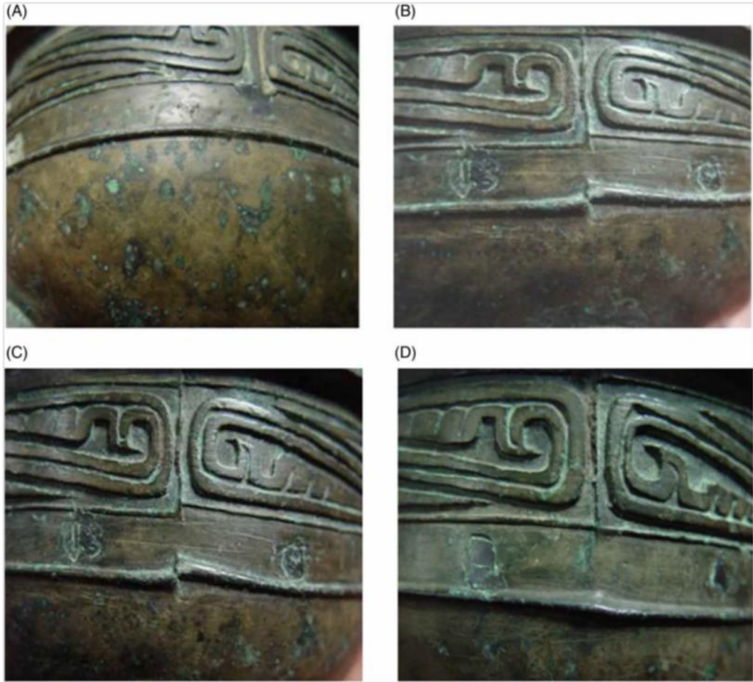
Figür 3: (A) Orijinal patina, (B) Uygulama öncesi yüzey, (C) Uygulama sonrası, (D) Uygulamadan 5 yıl sonrası (Wang et al. 2014).