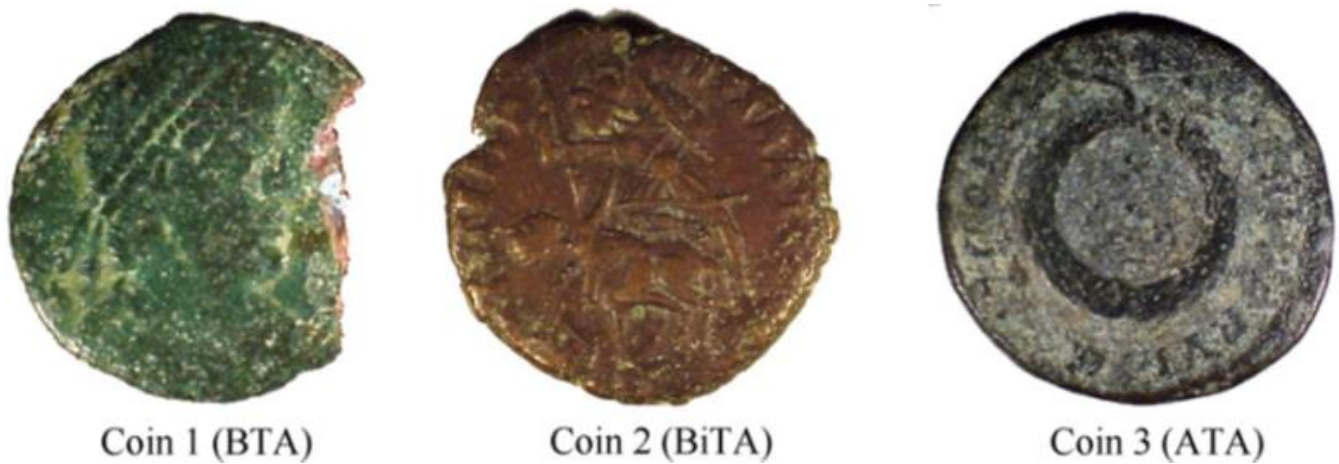
Figür 4: BTA, BiTA ve ATA uygulamaları (Rahmounia et al. 2009).

BTA'dan daha az BiTA'dan daha fazla Fakat BTA zehirli olduğundan dolayı koruyuculuğa sahip olan ve zehirli olmayan ATA'nın koruyuculuğu yeterli bulunmuştur 29 . 2009 yılında yayınlanan bu çalışmada 3 farklı tri-azol tipi koruyucunun etkinlikleri uygulamalı olarak araştırılmıştır.