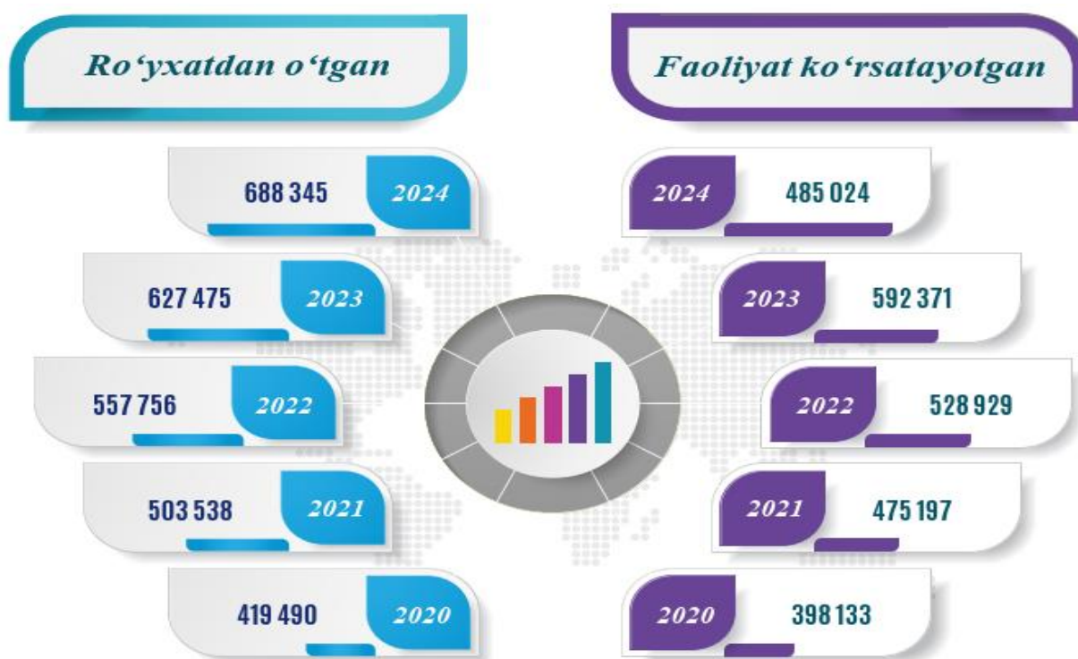
1-rasm. Korxona va tashkilotlar to'g'risida umumiy ma'lumotlar (fermer va dehqon xo'jaliklaridan tashqari, 1-yanvar holatiga ko'ra) 5

Xususan, kichik biznes va xususiy tadbirkorlik mamlakatimiz iqtisodiyotining asosiy bo'g'ini hisoblanib, bugungi kunda mazkur sohani jadallik bilan rivojlantirish, tadbirkorlar faoliyatini qo'llab-quvvatlash, ularning safini yanada kengaytirish va rag'batlantirish bo'yicha keng ko'lamli ishlar amalga oshirilyapti. 2024-yil 1-yanvar holatiga respublikada faoliyat ko'rsatayotgan korxonalar va tashkilotlarning soni fermer va dehqon xo'jaliklaridan tashqari 485,0 mingtani tashkil etdi, ulardan 417,1 mingtasi kichik korxona va mikrofirmalar. Shuningdek, ushbu davrga 688,3 mingta korxona ro'yxatdan o'tib, o'tgan yilning mos davriga nisbatan o'sish sur'ati 109,7 % ni tashkil etdi.