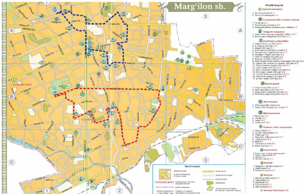
3-rasm. Marg'ilon shahar arxitektura yodgorliklari marshrut xaritasi.

Marg'ilon shahar arxitektura yodgorliklari bo'yicha turistik xarita ishlab chiqilgan. Bu turistik xarita 1 – rasmda keltirilgan bo'lib, xaritaga asosan Marg'ilon shahridagi arxitektura yodgorliklari bo'ylab sayohat marshrutlari, sayohatchilarga qulay bo'lishi uchun ikki marshrutga ajratilgan. Sayohat marshrutida arxitektura yodgorliklari, ziyorat joylari, diqqatga sazovor joylar, hunarmandchilik uylari, turizm markazi, mehmonxonalar, kafe-restoranlar, asosiy ko'chalar, temir yo'l stansiyalari va asosiy turistik marshrutlar loyihasi chizilgan.