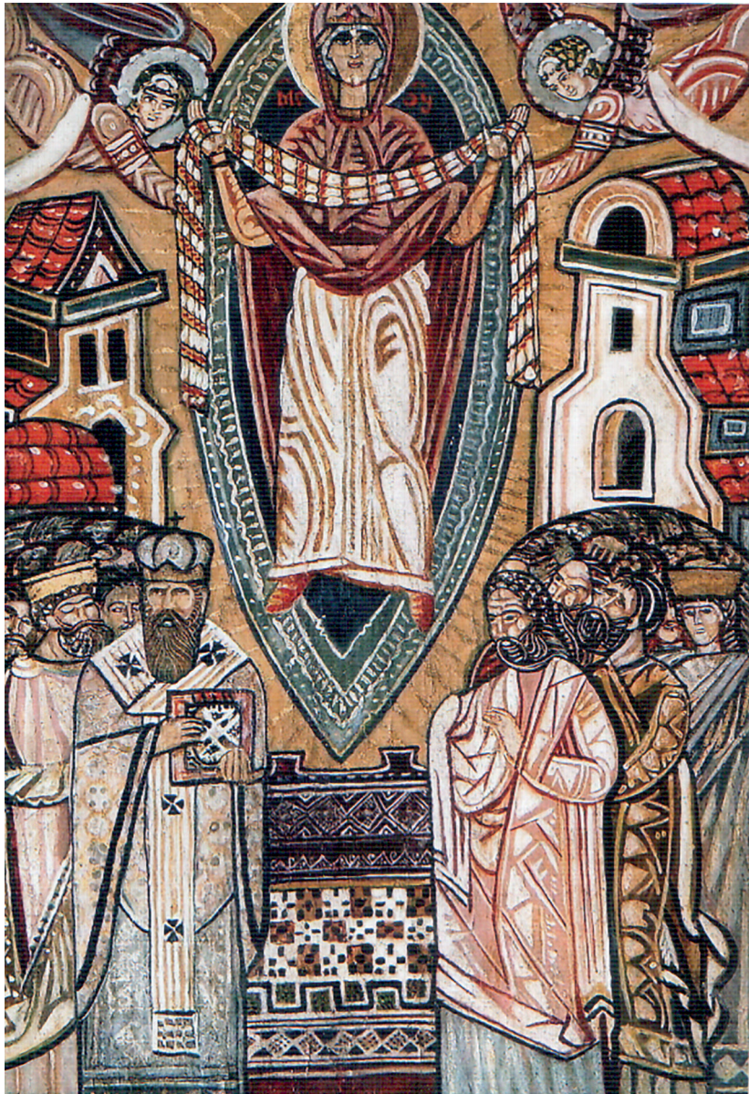
6. Михайло Бойчук. Ікона «Покрова Богородиці», 1910, дошка, темпера, 36,5x24 см;