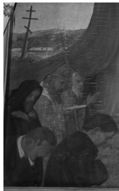
1. Икона «Покрова Богородиці» з портретом Б. Хмельницького, кін. XVII – поч. XVIII ст., Національний художній музей України; 2. Модест Сосенко Фрагмент образу Покров Богородиці у ц. Вознесіння Господнього в с. Поляни;