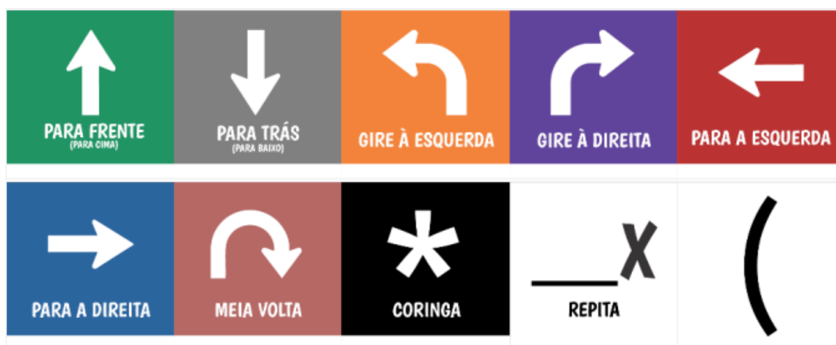
Figura 1 – Baralho AlgoCard em tamanho grande

A proposta de utilizar o AlgoRitmo (BRACKMANN, 2019) e AlgoMovimento (BRACKMANN, 2019) como atividades didáticas que empregam o baralho AlgoCards (BRACKMANN, 2019) em tamanho grande visa aprimorar habilidades algorítmicas e de programação entre os estudantes, especialmente em aulas de Educação Física. O baralho consiste em cartas que representam uma variedade de movimentos e ações, conforme exemplificado na Figura 1.