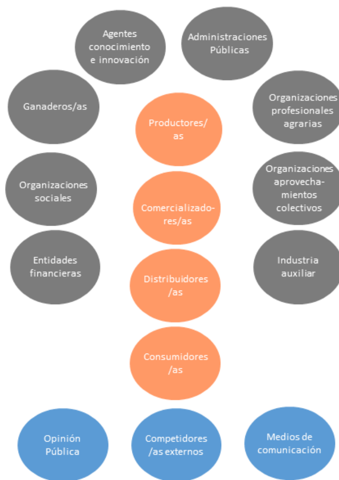
Figura 1. Grupos de agentes identificados durante el análisis del funcionamiento del sistema agrícola de Murcia. Agentes en color naranja - corresponden a los que intervienen en la cadena de valor para la producción, venta y consumo de productos agrícolas; en color gris – aquellos que desarrollan su actividad en el sistema agrícola murciano e interactúan con los agentes y procesos que conforman la cadena de valor; en color azul – hace referencia a agentes externos o indirectos al sistema agrícola murciano que presentan relación con éste.

Para iniciar la primera sesión invitamos a las personas participantes a que respondieran a la siguiente pregunta: ¿Quiénes son los agentes (instituciones, personas o redes) más relevantes en el funcionamiento del sistema agrícola en Murcia? . Les pedimos a cada una de ellas que identificasen entre 3 y 4 agentes, que fuimos plasmando en una pizarra digital visible para todas las personas. Una vez finalizadas las intervenciones iniciales, se inició un diálogo colectivo que permitió completar el mapeo inicial de agentes. A lo largo del diálogo, los agentes identificados se fueron agrupando en función de la actividad principal que ejercen dentro del sistema agrícola. Estos grupos de agentes se representan en la Figura 1 a modo de resumen.