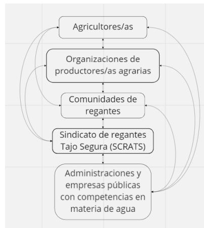
Figura 2. Colaboración entre comunidades organizativas de aprovechamientos colectivos en materia de agua con agricultores, cooperativas, organizaciones de productores/as agrarias, administraciones y empresas públicas en materia de agua a diferentes escalas.