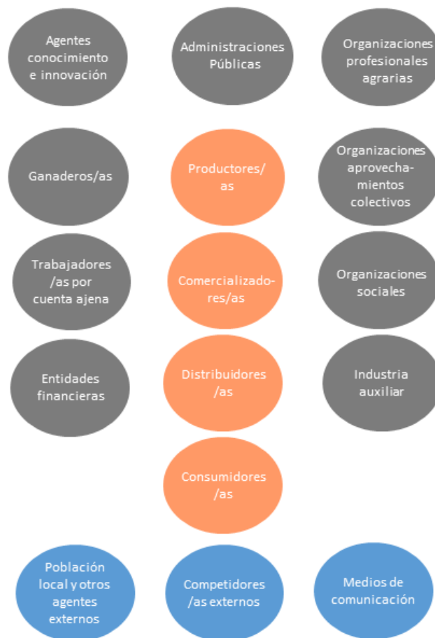
Figura 1. Grupos de agentes identificados durante el análisis del funcionamiento del sistema agrícola de Almería. Agentes en color naranja - corresponden a los que intervienen en la cadena de valor para la producción, venta y consumo de productos agrícolas; en color gris – aquellos que desarrollan su actividad en el sistema agrícola almeriense e interactúan con los agentes y procesos que conforman la cadena de valor; en color azul – hace referencia a agentes externos o indirectos al sistema agrícola almeriense que presentan relación con éste.

Para iniciar la primera sesión invitamos a las personas participantes a que respondieran a la siguiente pregunta: ¿Quiénes son los agentes (instituciones, personas o redes) más relevantes en el funcionamiento del sistema agrícola en Almería? Les pedimos a cada una de ellas que identificasen entre 3 y 4 agentes, que fuimos plasmando en una pizarra digital visible para todas las personas. Una vez finalizadas las intervenciones iniciales, se inició un diálogo colectivo que permitió completar el mapeo inicial de agentes. A lo largo del diálogo, los agentes identificados se fueron agrupando en función de la actividad principal que ejercen dentro del sistema agrícola. Estos grupos de agentes se representan en la Figura 1 a modo de resumen.