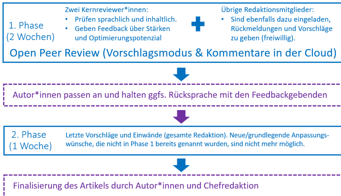
Abbildung 1: Übersicht der Reviewprozesse auf forschungsdaten.info

Vor diesem Hintergrund liegt die Idee nahe, neue sowie inhaltlich grundlegend überarbeitete Artikel einem strukturierten Reviewverfahren zu unterziehen. Newsmeldungen sind aus zeitlichen Gründen sowie aufgrund des Umstands, dass sie auf Pressemitteilungen und direkte Quellen verweisen, nicht Teil des Reviewverfahrens. Auch kleinere Korrekturen und Ergänzungen bestehender Artikel sind nicht Teil des Reviewverfahrens, da sie den Charakter eines Artikels nicht wesentlich verändern. Konkret soll es künftig für jeden neuen bzw. grundlegend überarbeiteten Artikel je zwei Kernreviewer*innen geben, welche den Artikel im Sinne eines redaktionsinternen Open Peer Review sprachlich sowie inhaltlich umfassend prüfen. Deren Aufgabe besteht dabei darin, innerhalb von zwei Wochen möglichst konkret Feedback über Stärken und Optimierungspotenziale des jeweiligen Artikels abzugeben, sodass dieser von den Autor*innen überarbeitet werden kann. Dabei greift das Verfahren auf die neue redaktionelle Grundlage der Cloud und der mit ihr verbundenen kollaborativen