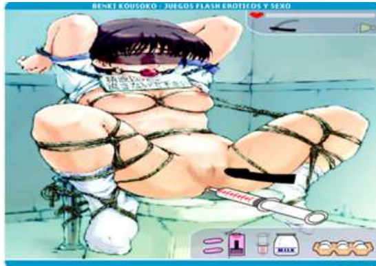
Figura 1. Captura de pantalla del videojuego Benki Kuosuko .

Otro ejemplo es Sociolotron , un juego multijugador que lleva más de 20 años en el mercado, en cuyo argumento aparecen violadores contra mujeres y esclavitud sexual, entre otras muchas cosas.