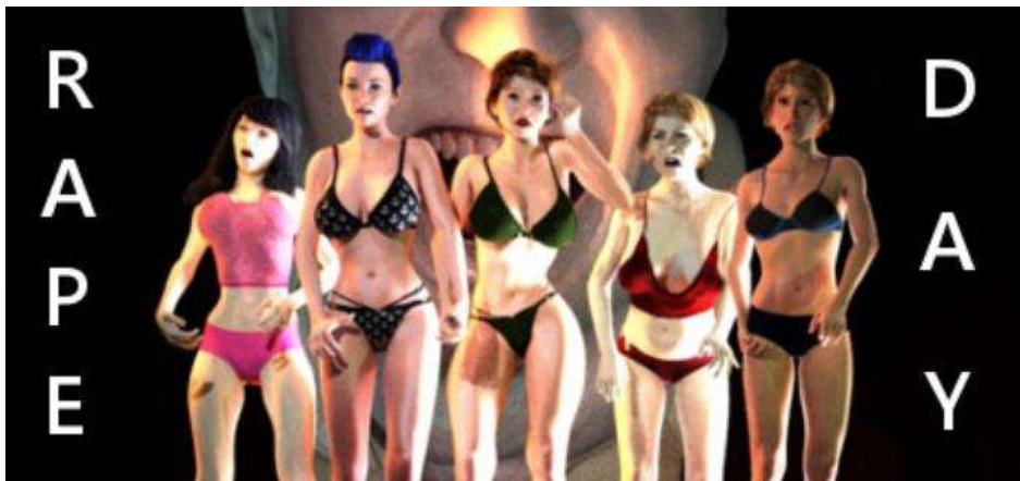
Figura 8. Carátula del videojuego Rape Day .

La moralidad es subjetiva y depende en gran medida de nuestras percepciones y creencias básicas sobre lo que está sucediendo, y aunque creemos que estamos librando grandes guerras contra los malvados villanos, ellos creen lo mismo acerca de nosotros. Las películas que muestran al héroe como un villano son más reales en ese sentido, más completas. Y como la mayoría de la gente, me encanta el porno también. (Frankie, 2019).