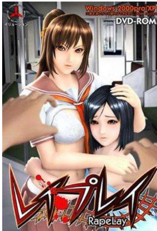
Figura 5. Carátula del videojuego RapeLay .

La carátula del videojuego (Fig.4) es suficientemente representativa, en un primer plano aparecen dos chicas abrazadas, en actitudes diferentes, una defendiendo e intentando proteger entre sus brazos a una niña atemorizada ante unas manos masculinas que se dirigen hacia ellas. Las imágenes de las mujeres semidesnudas, de aspecto juvenil con curvas y senos pronunciados, aunque sus escuetos ropajes poseen un matiz más infantil; se presentan ante el voyeur/espectador/jugador/violador, como jóvenes mujeres hipersexualizadas y plastificadas, con referencias iconográficas a los dibujos Manga, donde las mujeres nunca envejecen.