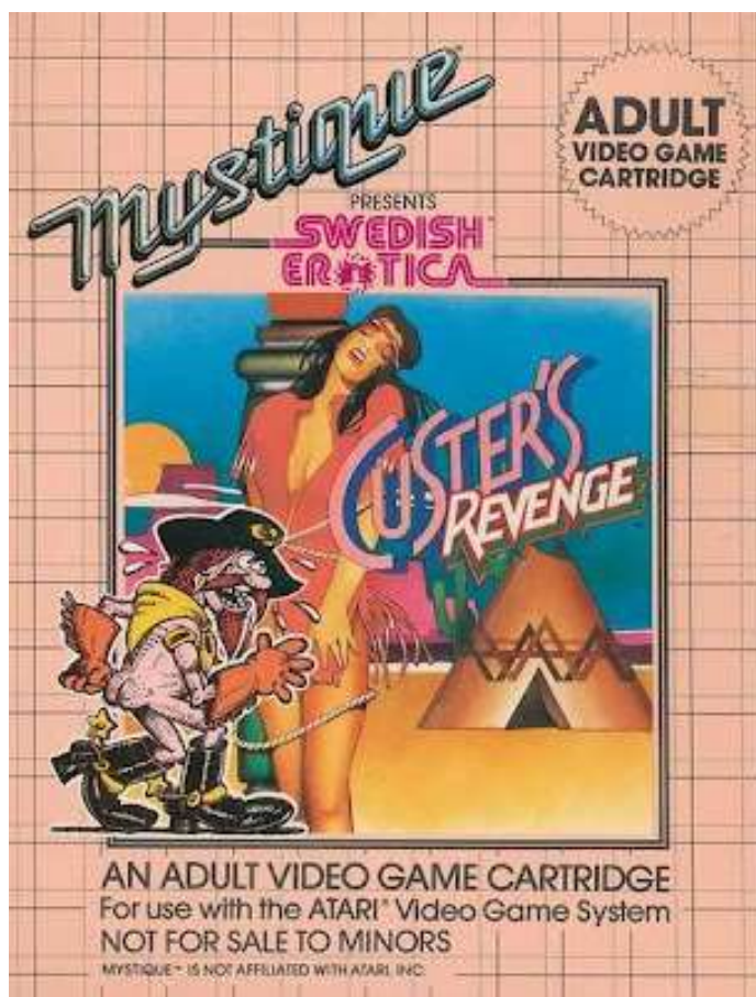
Figura 2. Carátula del videojuego Custer's Revenge .

Este tipo de justificación del delito, también se pone de manifiesto en el videojuego donde podemos apreciar diversos gráficos (Fig. 3 y 4) en el que la víctima se encuentra atada a un cactus, aparece desnuda con grandes pechos, mientras que sonríe ampliamente al ser violada, se evidencia una interpretación patriarcal que adoctrina a los hombres y somete a las mujeres y se establece una relación de poder patriarcal muy alejada de la igualdad de género.