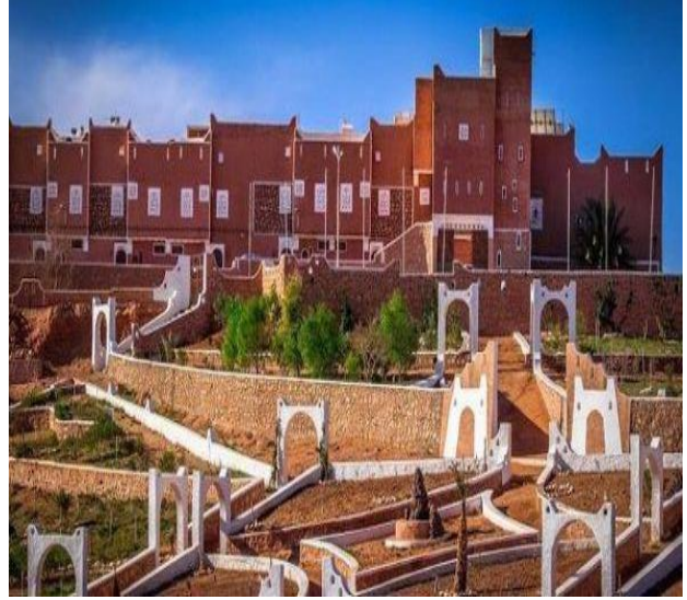
القصور من العمائر التراثية في المدن الصحراوية الجزائرية

أحجامها الكبيرة، وطرق الملح والذهب القديمة، وواحاتها التي شاهدت موجات اللاجئين إليها من بربر وزنوج ويهود ومسلمين، على مر القرون فيأتون إليها ويختفون فيها ثم يستوطنونها فيجعلون منها جنة على الأرض) (بوجدره، 2002، ص65).