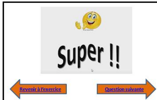
Figure 2. Exemple de l'interface de l'application

Ici nous avons à choisir entre deux propositions de réponses, si la réponse est correcte, nous aurons l'image A, sinon nous aurons l'image B, et nous pourrons refaire l'exercice, ou passer à la suite.