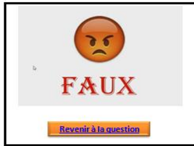
Figure 3. Exemple de l'interface de l'application

Si on choisit la question n°2, l'application se dirigera directement à la page des questions de compréhension :