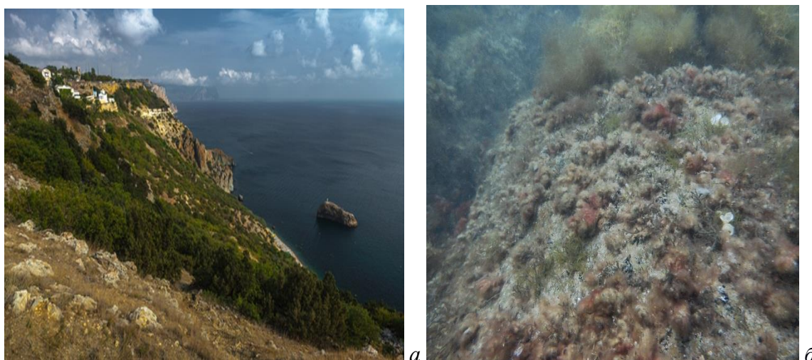
Рис. 1. Памятник природы «Прибрежный аквальный комплекс у мыса Фиолент» а – береговая зона, б – морская акватория.

Водоросли помещали в мешки из мельничного газа и в сыром виде доставляли в лабораторию, где определяли их видовой состав. Идентификацию водорослей проводили по определителю (Зинова, 1967) с учётом последних номенклатурных изменений (Guiry and Guiry, 2023). В лабораторных условиях при обработке материала учитывали общую биомассу (сырую) макрофитов, биомассу литофитов и эпифитов, биомассу «цистоциры» ( Ericaria crinita (Duby) Molinari & Guiry = Cystoseira crinita и Gongolaria barbata (Stackhouse) Kuntze = Cystoseira barbata ) и филлофоры ( Phyllophora crispa (Hudson) P. S. Dixon), которые являются видами-доминантами Чёрного моря. Ресурсы макроводорослей (кг, сырая масса) рассчитаны по методике, модифицированной для морских исследований Q = V \times \text{ПП} \times S / 100 , где Q – запасы (кг), V – средняя биомасса водорослей (кг×м 2 ) в зарослях, ПП – проективное покрытие дна макрофитами (%), S – площадь, занятая зарослями макрофитов (м 2 ) (Блинова и др., 2005). Угол уклона дна не превышал 0,06°, поэтому при расчёте запасов макрофитов он не учитывался. Определение площади акватории осуществляли с помощью программы QGIS .