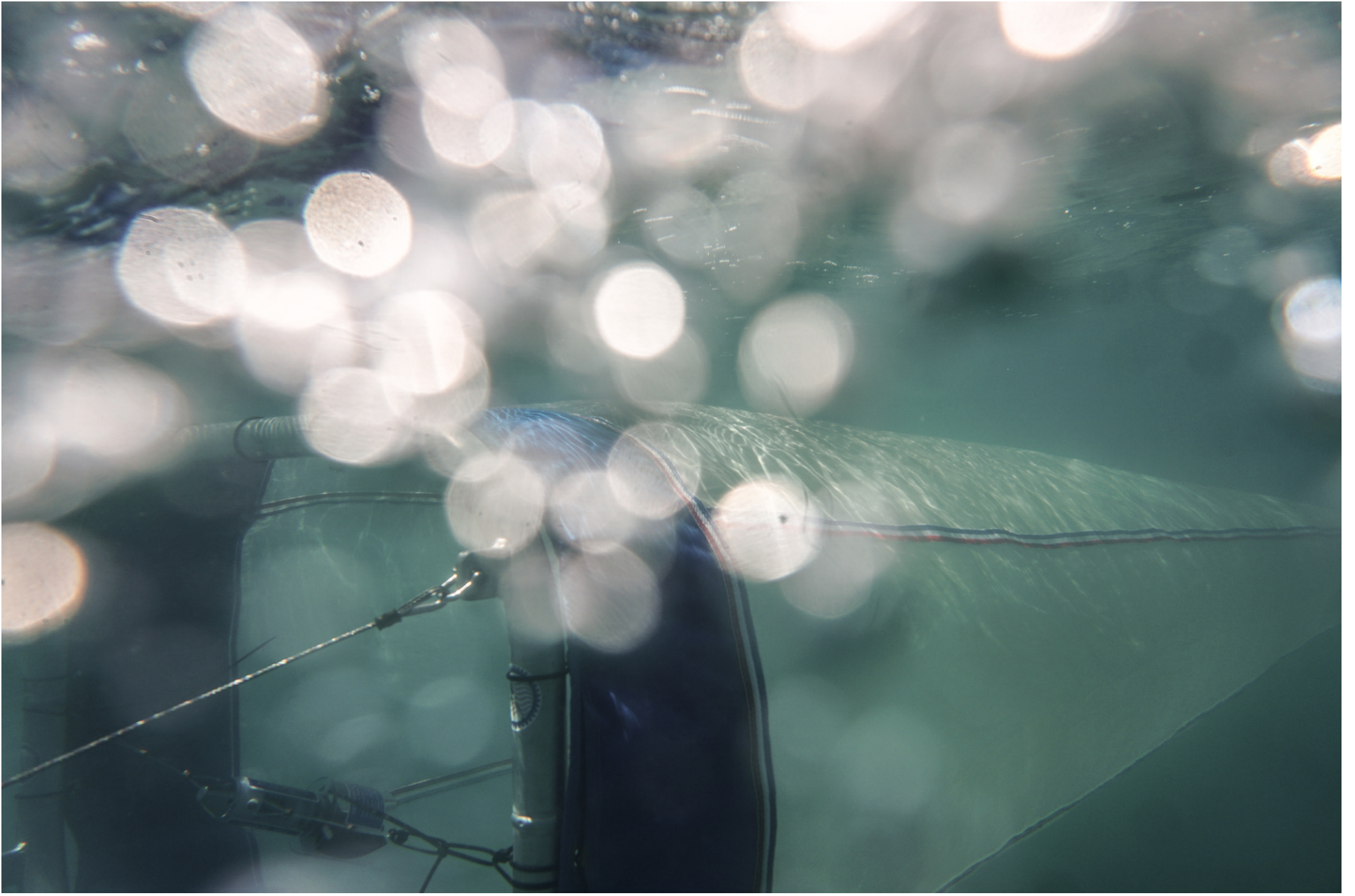
Neuston-net in action // Neuston-net in azione