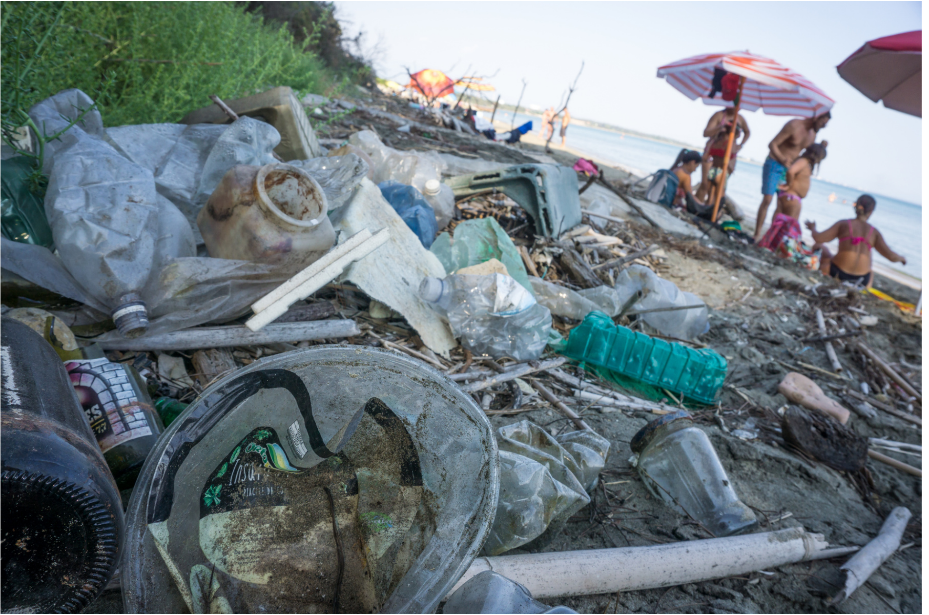
Wastes on the beach // Rifiuti sulla spiaggia