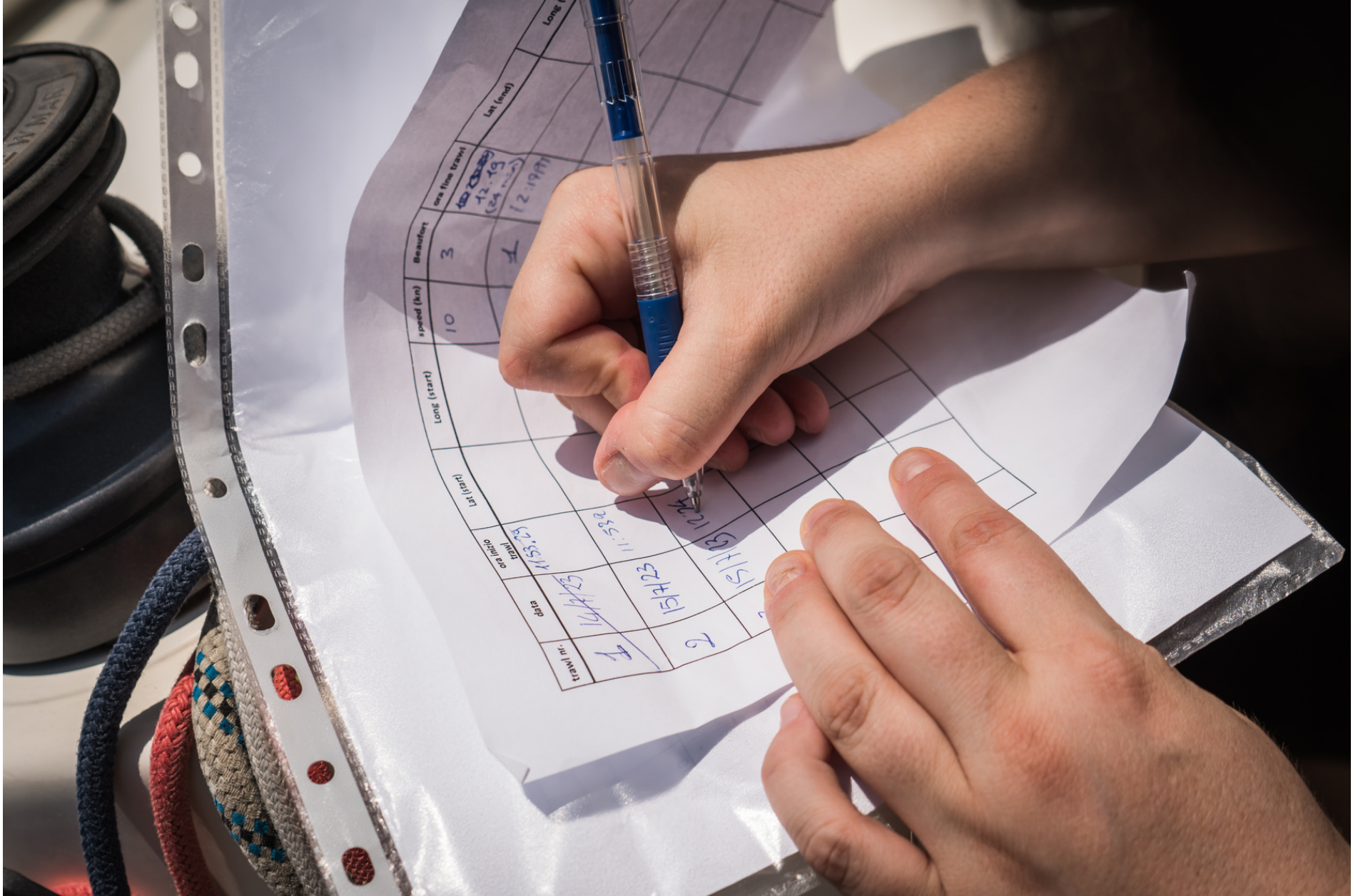
Taking notes of sampling position // Prendere nota della posizione di campionamento