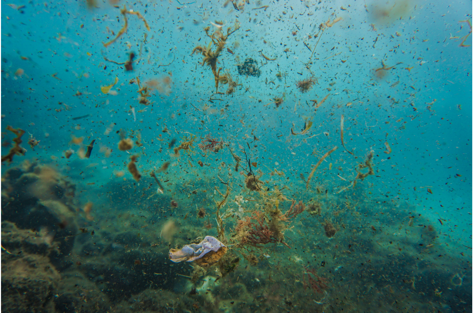
Female absorbent and algal formations // Assorbenti femminili e formazioni algali