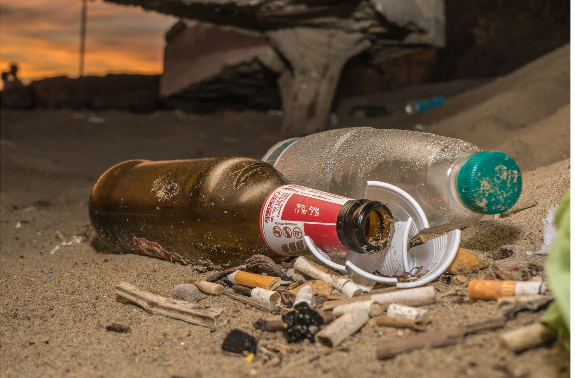
Trash on the sand // Rifiuti sulla spiaggia