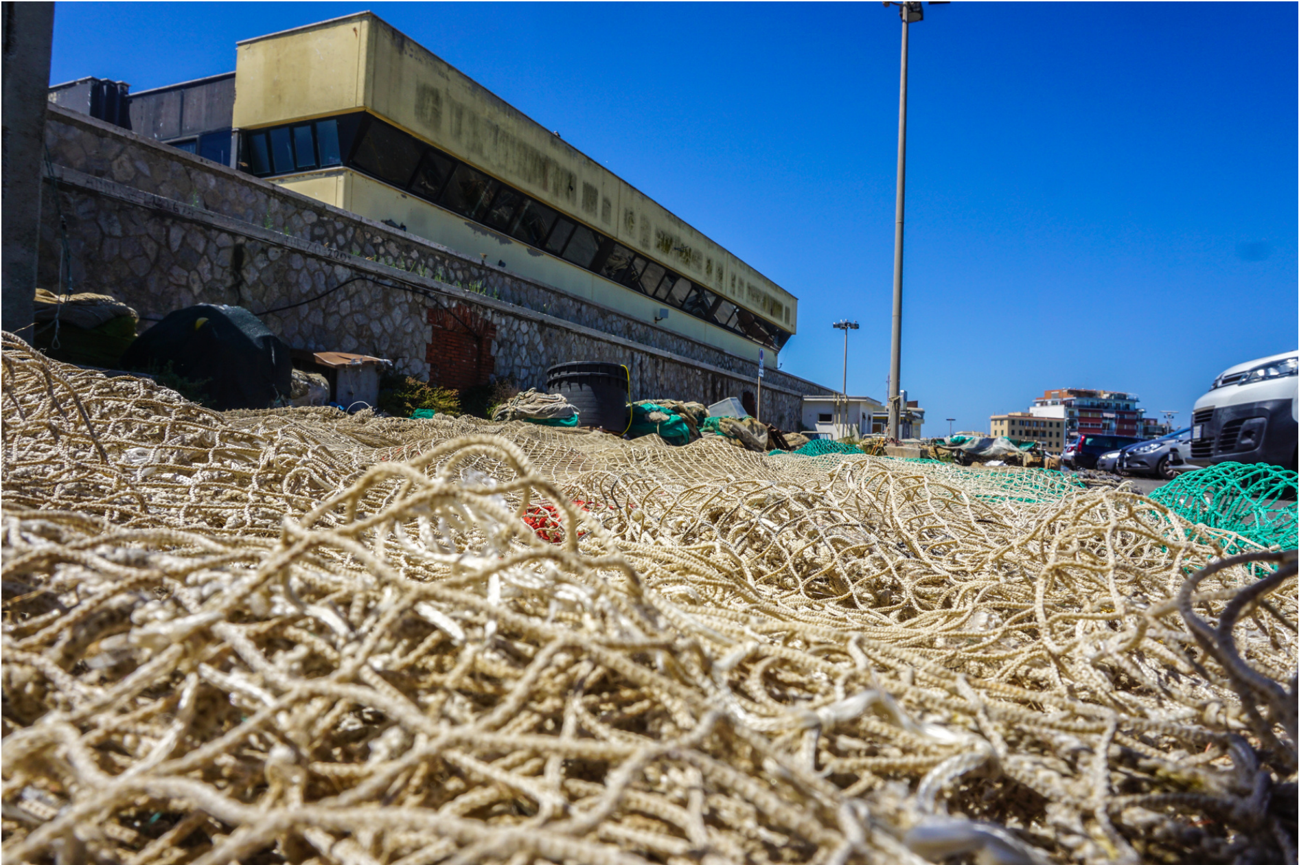
Abandoned fishing nets at the fishermen's harbour // Reti da pesca abbandonate al porto dei pescatori