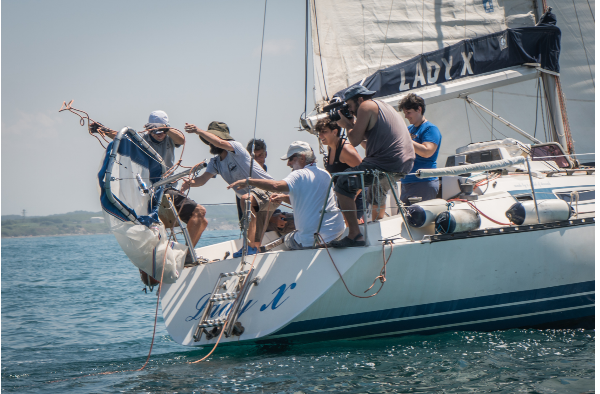
Monitoring microplastic on sailing boat // Monitoraggio delle microplastiche in barca a vela