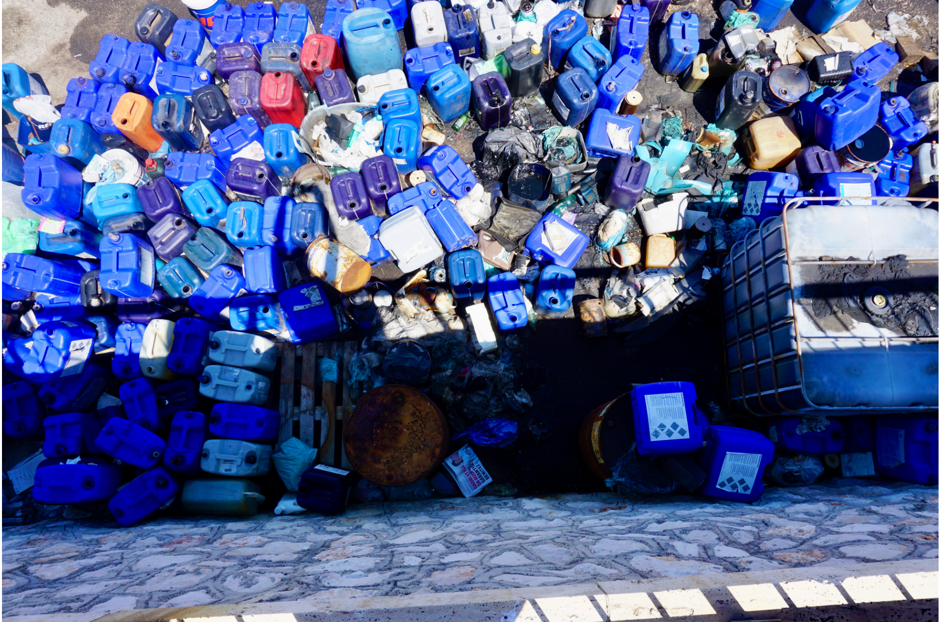
A blue sea of used oil tanks at the fishermen's harbour // Un mare blu di taniche di olii usati al porto dei pescatori