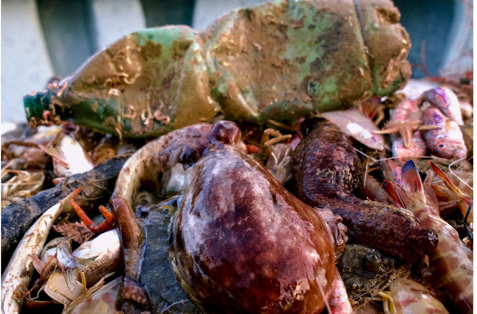
Catch of the day //Pescato del giorno