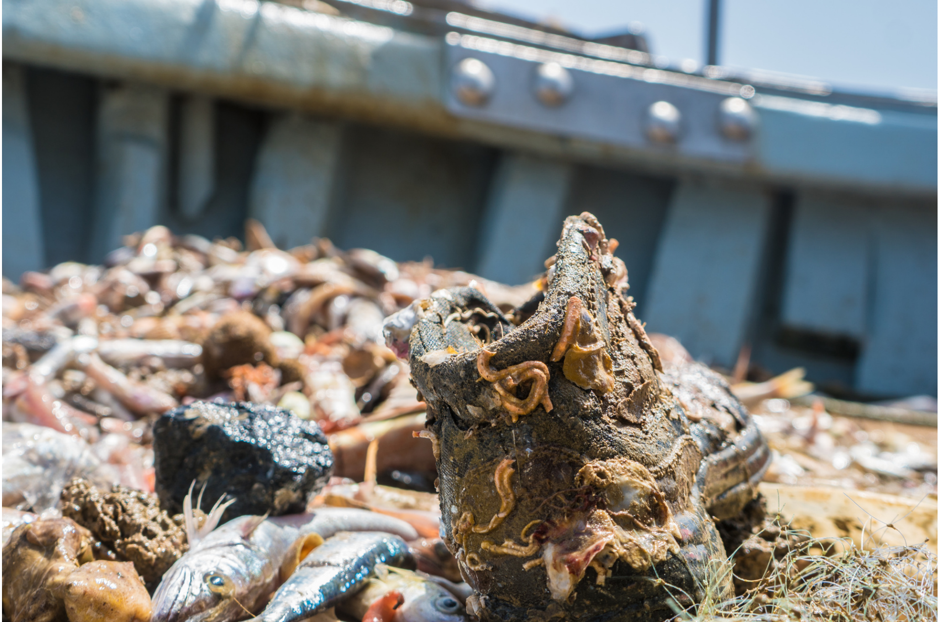
Worm snails on a shoe // Gallerie di vermi di mare su scarpa