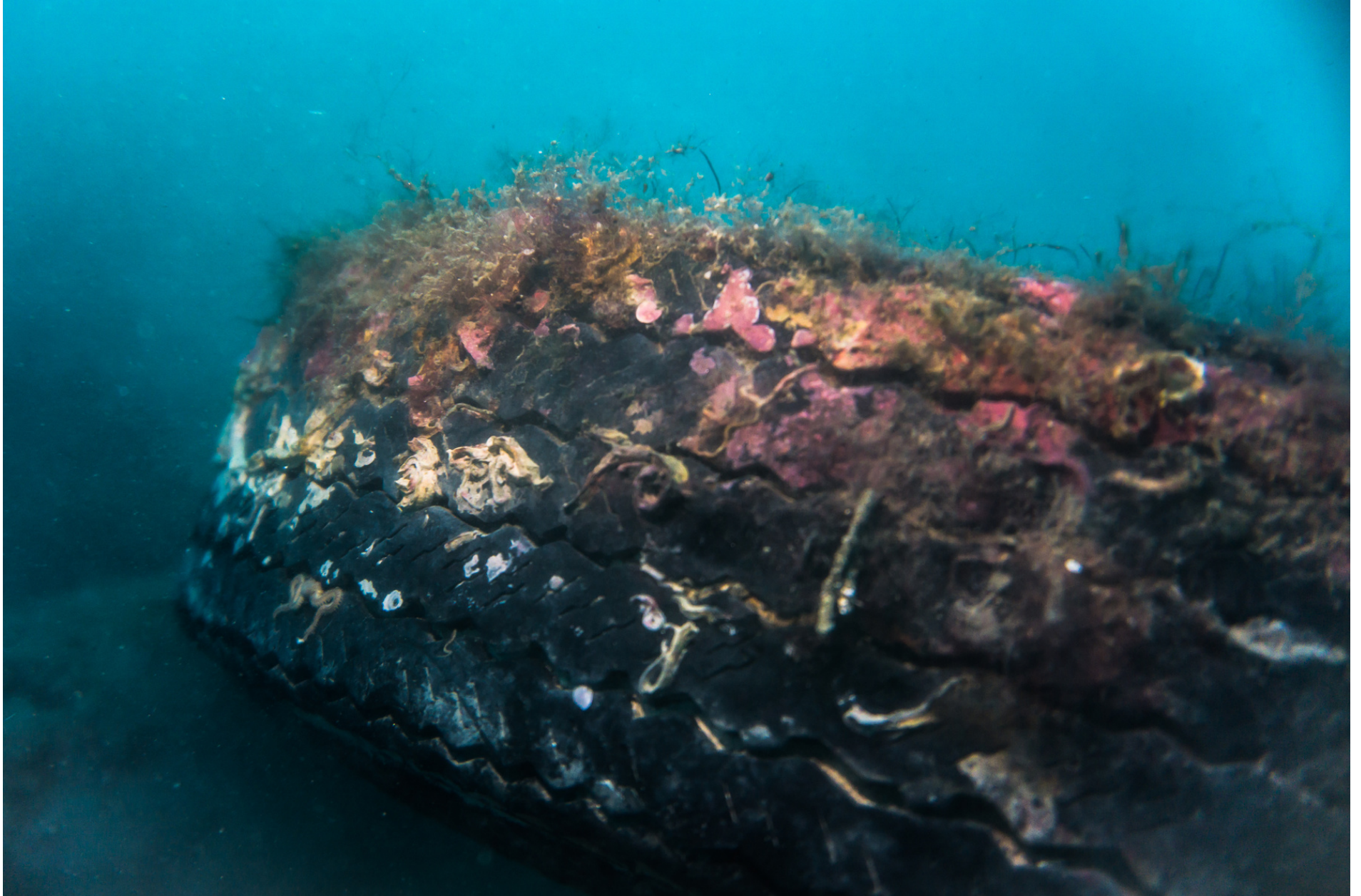
Algal formations on tire // Formazioni algali su gomma