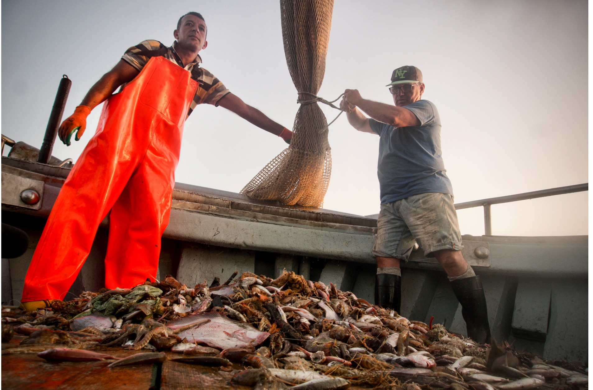
Fishing plastics // Pescando plastica