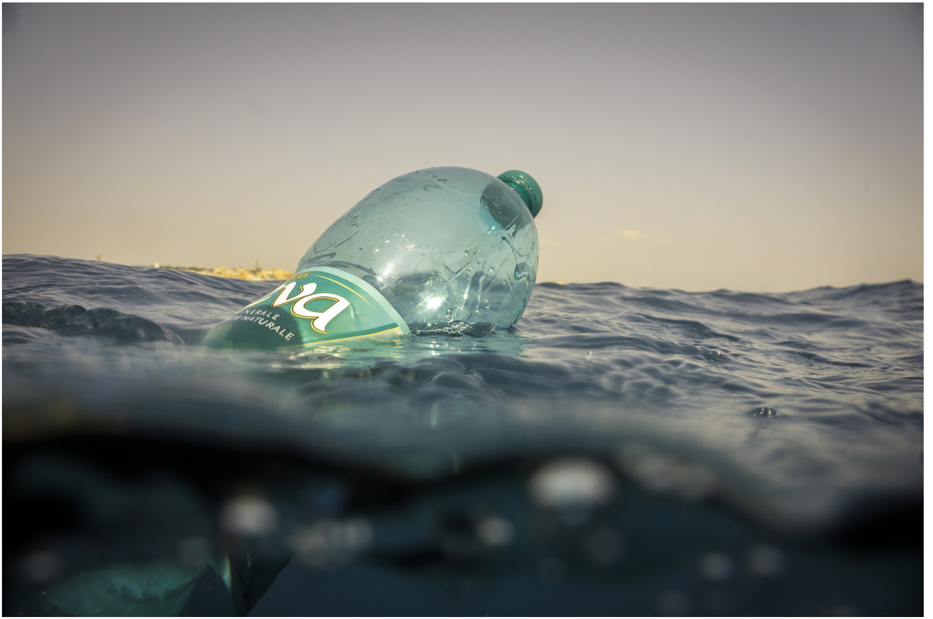
Floating bottle // Bottiglia galleggiante