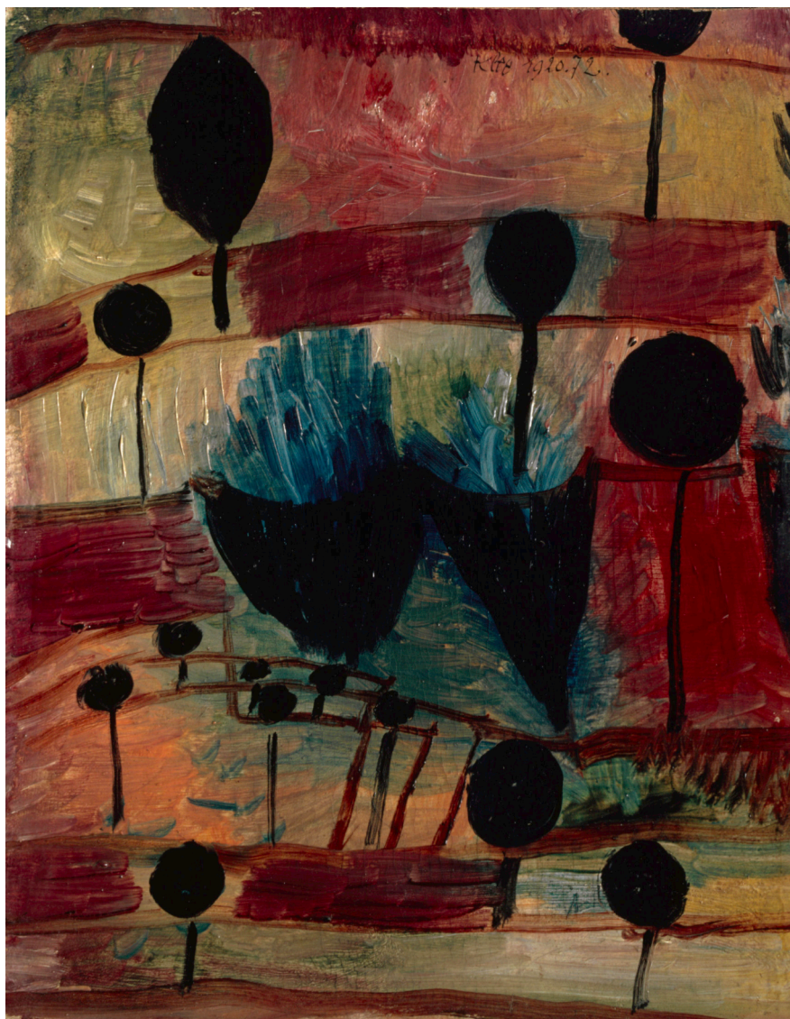
Abb. 1 Paul Klee, Gartenbild mit schwarzen Pflanzen , 1920, 72, Ölfarbe auf Grundierung auf Karton, 21.5 x 16.5 cm, Standort unbekannt