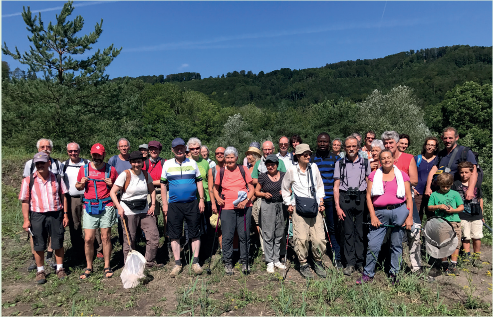
Abb. 2. Gut besuchte Sonntags-Exkursion in die Tongrube Eriwis bei Schinznach Dorf (AG) am 11.8.2019.

etwa den Erwartungen aufgrund des Aktionsradius der EGZ. Es sind dies z. B. Zürich (33.9 %, 1442 Nutzer), Bern (5.9 %, 251 Nutzer), Genf (4 %, 173 Nutzer), Basel (1.9 %, 81 Nutzer), Luzern (1.8 %, 76 Nutzer). Die meisten Besuche der Webseite erfolgten über einen Desktop (62.8 %), 32 % der Zugriffe gingen von einem Smartphone aus, der Rest entfällt auf Tablet-Geräte. Bei der Technik waren keine grösseren Zwischenfälle zu verzeichnen, sodass die Seite stets erreichbar war.