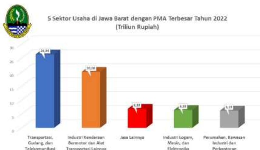
Diagram 3: 5 Sektor Usaha di Jawa Barat dengan PMA terbesar 2022 (BKPM RI)

Adapun struktur sumber investasi Provinsi Jawa Barat pada 2022, terdiri dari Penanaman Modal Asing (PMA) sebesar Rp93,1 triliun (53,3%) dan Penanaman Modal Dalam Negeri (PPMDN) sebesar Rp81,4 triliun (46,6%). Sehingga, PMA merupakan sumber paling banyak berinvestasi di Jawa Barat. Lebih lanjut, mengenai sektor-sektor yang paling banyak dipilih dalam PMA di Provinsi Jawa Barat tahun 2022 tersebut sebagai berikut: