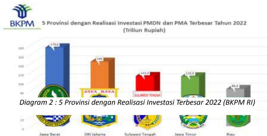
Diagram 2 : 5 Provinsi dengan Realisasi Investasi Terbesar 2022 (BKPM RI)

Sementara itu, pada 2022, realisasi investasi di Indonesia tercatat sebesar Rp1.207,2 triliun atau naik 34% dibanding tahun sebelumnya yang mencapai Rp901 triliun. 18 Adapun provinsi yang menerima investasi paling tinggi di Indonesia tahun 2022 tersebut sebagai berikut: