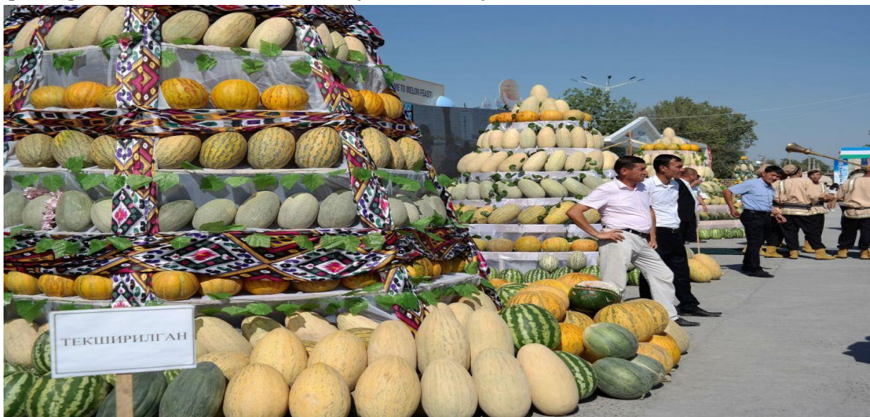
2.1.3-rasm. Sirdaryo viloyatida «qovun sayli» bayrami

«qovun sayli» tashqi turizm ko'rsatkichlarini keskin ravishda oshrishga xizmat qiladigan an'analaridan biridir (2.1.3-rasm).