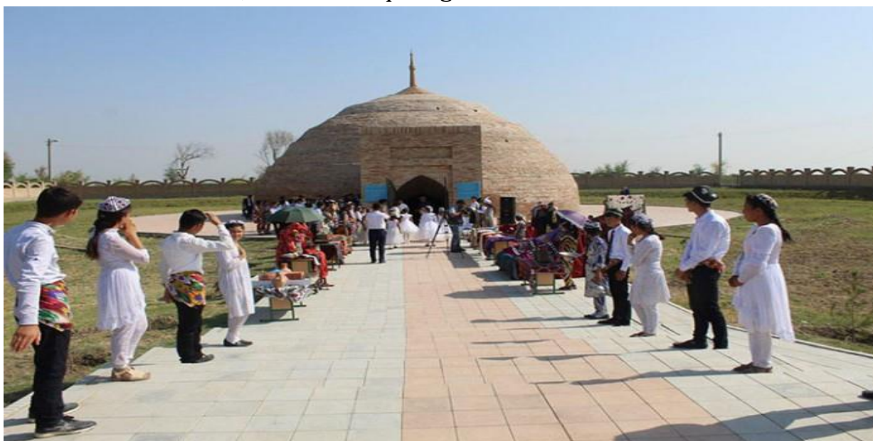
2.1.2-rasm. Sirdaryo viloyatidagi sardobalarda o'tkazilayotgan an'anaviy turistik bayramlar

Viloyat tarixi haqida guvohlik beruvchi yodgorliklardan biri Sardoba tumani hududida joylashgan Sardoba yodgorligidir. Sardoba forsha (sard – sovuq, zah hamda ob –suv) «muzdek suv» degan ma'noni anglatadi. Sardobalar karvon yo'llarida qurilgan va ipak yo'ladagi karvonlarni suvga bo'lgan ehtiyojini qondirgan. Ular hanuzgacha o'z jozibadorligini yo'qotmagan va ichki hamda tashqi turizmni rivojlantirishning asosiy obyektlaridan hisoblanadi (2.1.2-rasm). O'tgan asr tarixchilarining yozishicha, yog'ochli sardobasi yaqinida karvonsaroy hamda bog'-rog'lar bo'lgan. Sardoba gumbazsimon ko'rinishga ega. U nihoyatda sifatli g'ishtdan qurilgan. G'ishtlar kvadrat shaklida bo'lib, ularning hajmi 25x25x5sm dir. Gumbazning ichki diametri 15 metr, balandligi 12 metrni tashkil etadi. Ichki qismida 2 metr balandlikda yopiq, uyasimon tuynuklar joylashgan. O'tgan asrda sardoba ichida Evropaliklar tomonidan quduq qazilgan. Ushbu quduqning devorlari yog'och bilan o'ralgan. Sardoba devorining qalinligi pastki qismida 1,5 metrni tashkil etsa, yuqoriga ko'tarilgan sari yupqalashib boradi. Eng yuqori qismida uning qalinligi bir g'isht ko'rinishida bo'ladi. Suvning aynib qolmasligi uchun sardobada uchta maxsus ventilyasion tuynuklar o'rnatilgan. Gumbazning yuqori qismi ham shu maqsadda ochiq qoldirilgan. Shu sababli ham sardoba suvi muzdek, toza va tiniq bo'lgan.