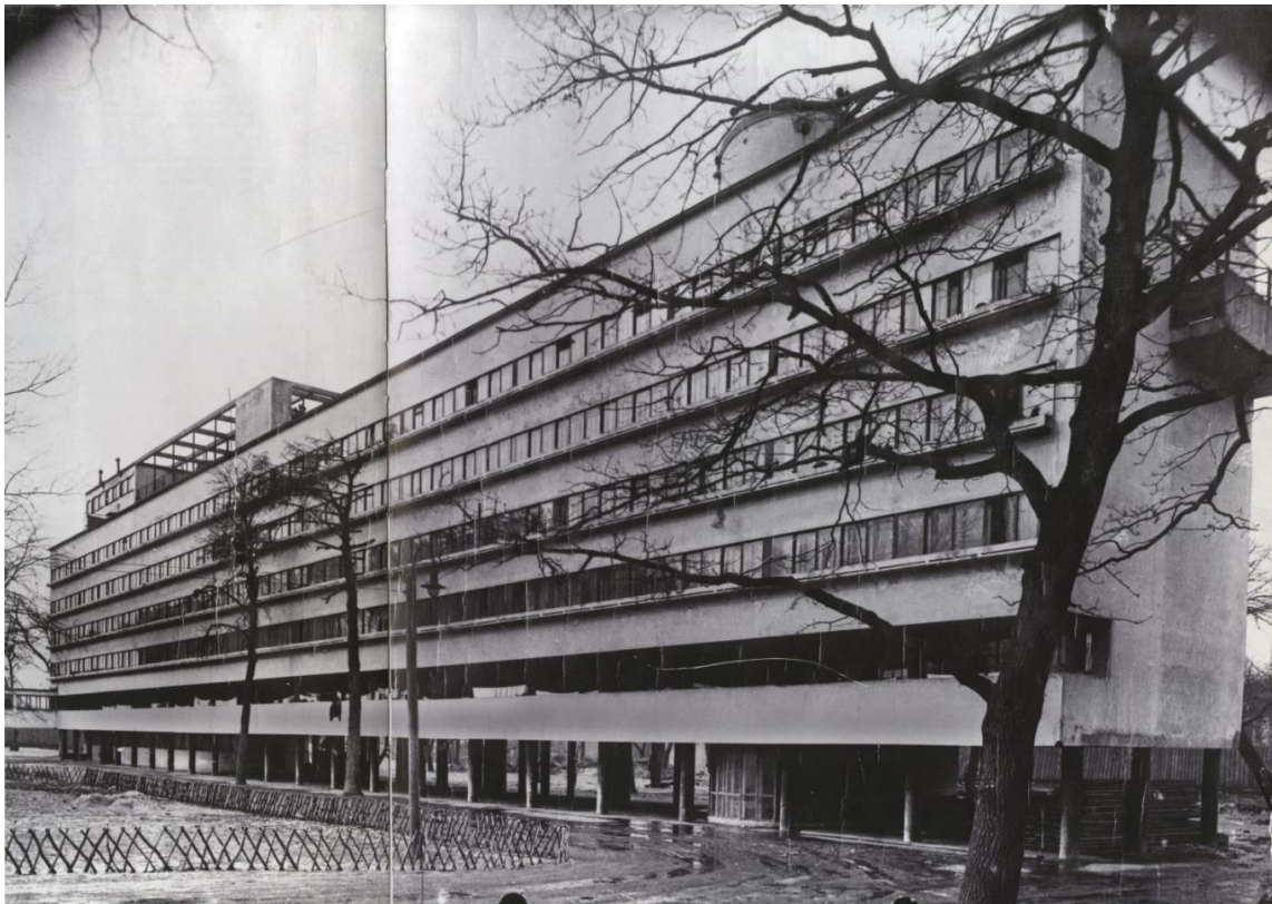
Рисунок 5. Дом Наркомфина в Москве (1930 г.), арх. М. Гинзбург