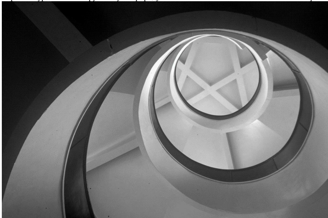
Рисунок 1. Лестница бывшего Клуба НКВД имени Ф. Дзержинского (1931 г.), арх. А. Антонов, В. Соколов, А. Тумбасов