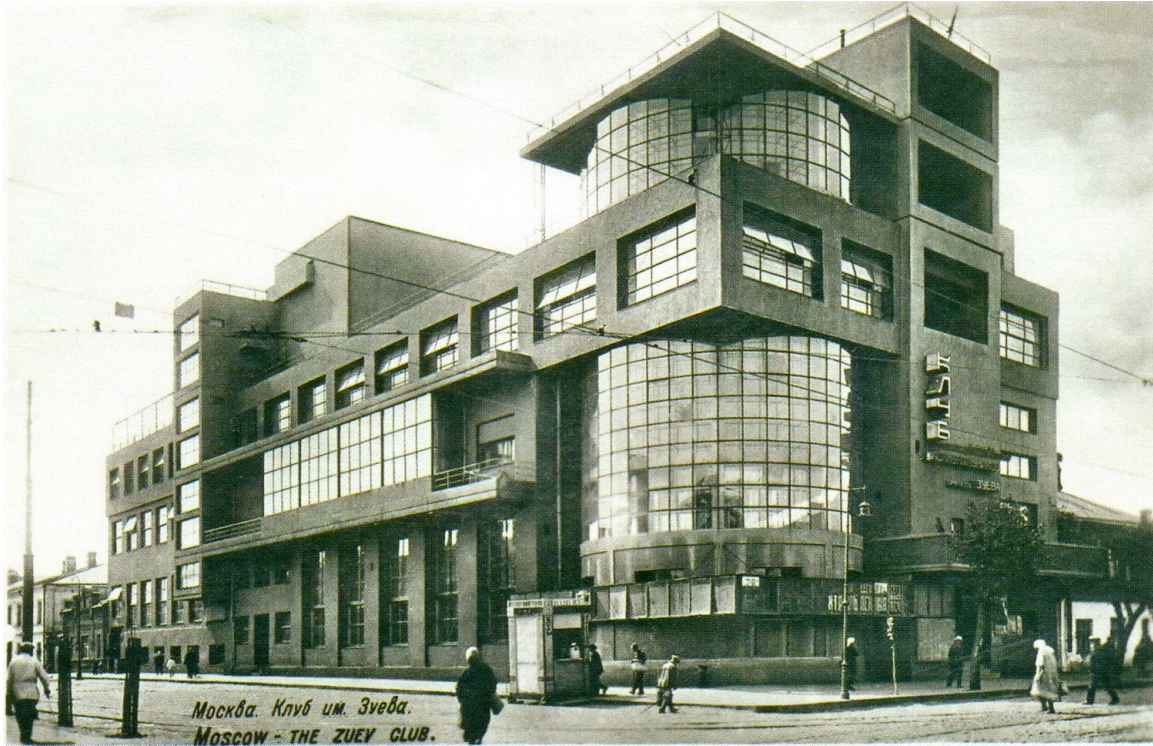
Рисунок 4. Дом культуры имени Зуева (1929 г.), арх. Илья Голосов