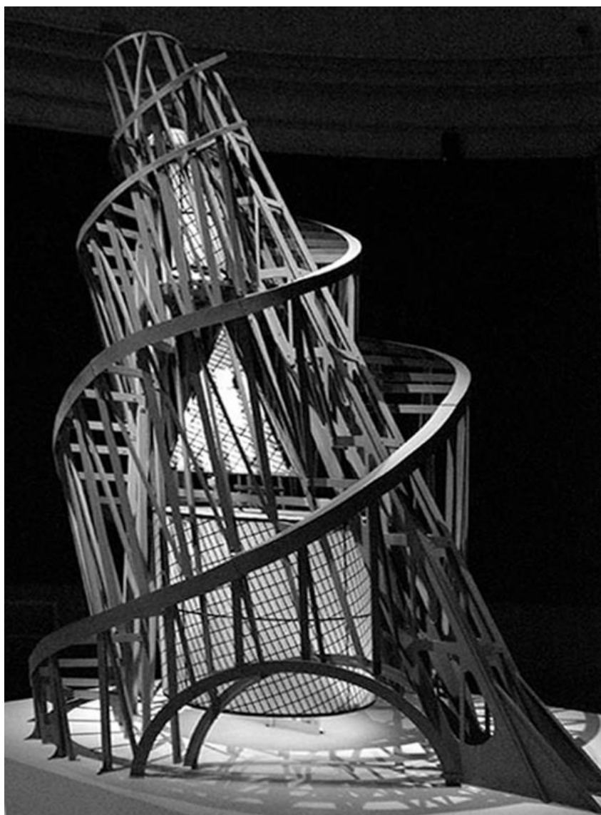
Рисунок 7. Памятник III Коммунистического интернационала (Башня Татлина) (1920 г.), В. Татлин