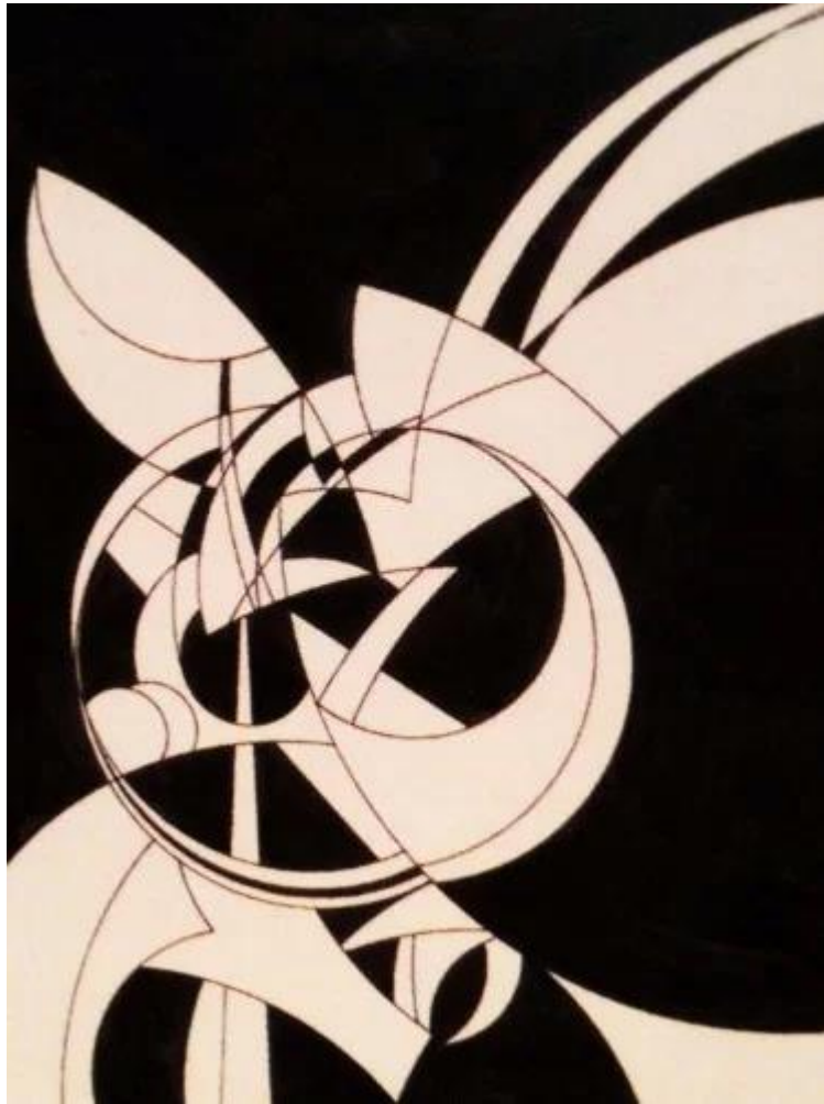
Рисунок 8. А. Родченко. Линейно-циркулярная композиция (1915 г.)