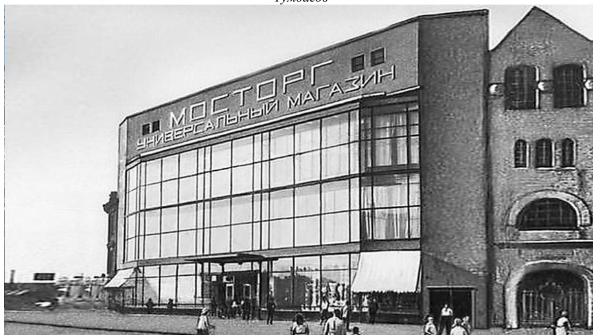
Рисунок 3. Универмаг «Мосторг» на Красной Пресне (1928 г.), арх. Братья Веснины