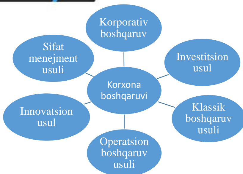
2-расм. Функционал бошқарув усуллари.

Менежмент методологиясини асосий назария йўналишларидан бири бошқарув механизми ҳисобланади. Амалиётда механизм тушунчаси ҳолат ҳисобланиб бир неча бўлак шаклланиб яхлит бир тизим яратилади. Демак, менежментнинг ёки бошқарув фаолиятининг самарадорлигини ошириш учун менежментни яхши шакллантириш лозим. Бунинг асосида бир қанча элементлар, катта ва кичик тизимчалар туради. Фаолиятни тўғри ташкил этиш ва такомиллаштириш учун илмий тадбирлар ва изланишлар олиб боришимиз зарур. Авваламбор, механизмни жорий қилиш учун қуйидагиларни жойлаштириш мумкин. Биринчидан катта тизимлар, сўнгра кичик тизимчалар.