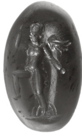
Abb. 5: Granatintaglio, Ende 2./1. Jh. v. Chr. Jüngerlingshafter Eros sucht sich zappelnd aus einer Bügelfalle zu entwinden. Staatliche Antikensammlungen München, Inv. NI 15,046-183.

Von Natur aus braucht der Liebesgott weder Jagdgerät noch Waffen, allein durch seine Schnelligkeit fängt er jedes noch so behände Tier im Flug lebendig ein, was die Vasenmalerei eindrucksvoll in Szene gesetzt hat, wenn er z.B. fliehende Hasen oder Rehe im Flug einholt. 23 Auch das Beschleichen eines fressenden Hasen auf einer Glasgemme ist eines von vielen Beispielen. 24 Aber Eros/Amor ist auch ein listiger Jäger und Fallensteller, der Beute macht, und so beschreiben ihn Literatur und Bildkunst in vielerlei Varianten. Das Motiv des jagenden Eros/Amor findet seit klassischer Zeit Verbreitung und verweist über sich hinaus oft auf einen erotischen Zusammenhang. Spätestens seit