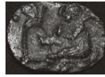
Abb. 2: Einfarbiger Glaskameo, augusteisch. Kindlicher sitzender Amor mit dem Fuß in einer Bügelfalle, darauf der Psyche-Schmetterling. London, British Museum Reg. 1814,0704.1660.