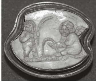
Abb. 3: Glaskameo, fr. Kindlicher sitzender Amor mit dem Fuß in einer Bügelfalle, darauf der Psyche-Schmetterling, ein zweiter Amor mit Palmzweig kommt dazu. London, British Museum Reg. 1923,0401.1003.

Der weinende kleine Gott ist nicht mehr der große Dämon, der Pindar und Sophokles erschüttert, und dem Plato sein herrlichstes Gedicht gewidmet hat. Aber er ist auch noch nicht das unschuldige Eroskind der hellenistisch-pompejanischen Malerei, das in Nachahmung von Göttern und Menschen seine eigene spielerische Welt aufbaut [...] Er steht zwischen beiden und sein Element ist die Ironie. Aber es steht auch eine höhere Macht über ihm. Der Gott selber in Fesseln, da ist's mit seiner Göttlichkeit schlecht bestellt. Auch Aphrodite, die Mutter kann ihm nicht helfen. Sondern Nemesis regiert, die Schicksalsgöttin der neuen fatalistischen Zeit. 17