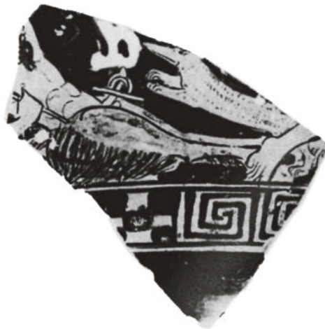
Abb. 8: Glockenkrater, fr., um 400 v. Chr.

Der philosophische Blick auf Eros erkennt ihn seit den platonischen Dialogen als ein Mischwesen, sieht seinen Platz in einem Zwischenraum. Eros hat Anteil sowohl vom Begehren als auch vom Begehrt-Werden, Mangel und Erfüllung kennzeichnen ihn und seine Position ist „zwischen Weisheit