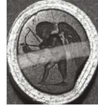
Abb. 1: Augusteische Glasgemme. Amor spannt den Bogen zum Abschuss eines Liebespfeiles. London, British Museum Reg. 1923,0401.483.

Was aber, wenn Eros/Amor selbst in die Falle gerät? Auch dieses Motiv findet sich seit der hellenistischen Zeit auf Ringsteinen: Das mit einem Bein in einer zugeschnappten Bügelfalle steckende, auf der Erde hockende und weinende Amorkind ist ein geläufiges Motiv in der Glyptik der augusteischen Epoche und frühen Kaiserzeit, wurde als Intaglio und Kameo geschnitten und auf Glasgemmen und -kameen vervielfacht (Abb. 2). 5 Der oft ebenfalls anwesende Psyche-Schmetterling lässt vermuten, dass es hier um Reflexe der hellenistischen Dichtung geht, der ungebärdige Eros/Amor, der die Seele quält, erleidet eine Strafe. Wie ein Lockvogel sitzt der Schmetterling auf der Falle oder umgaukelt sie. Schriftlich belegt ist Amors derartige Bestrafung allerdings nicht. Eine Serie von Intagli, Stein- und Glaskameen überliefert den Bildtypus: Entweder ist der in eine Bügel-Falle geratene Eros/Amor ganz allein und hat das Köpfchen traurig in eine Hand gestützt. 6 Der Schmetterling