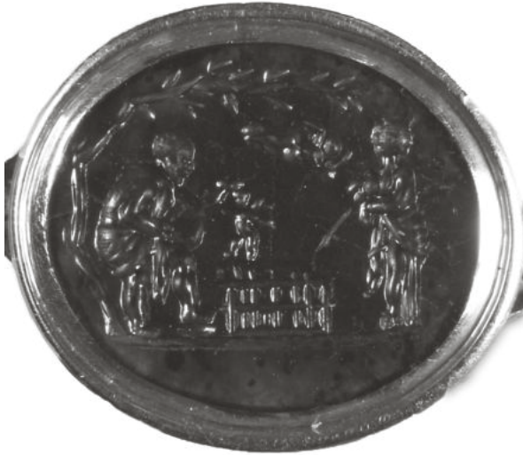
Abb. 9: Plasma, 2. Hälfte 1. Jh. v. Chr. Amorettenverkauf durch einen silenhaften Vogelsteller, Käuferin ist wohl die Mutter, Aphrodite/Venus.