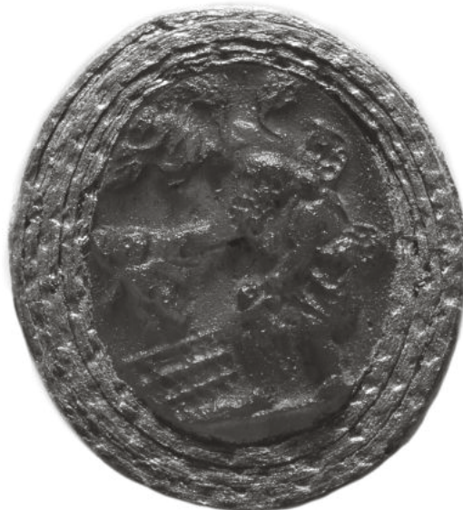
Abb. 10: Braune Glasgemme, Ende 1. Jh. v./1. Jh. n. Chr. Amorettenverkauf durch einen mit Theatermaske gekennzeichneten Alten, der zwei Amores hält. London, British Museum, Inv. 1873,0502.186.