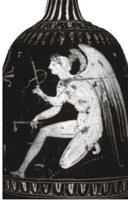
Abb. 7: Gnathia-Lekythos um 340/30 v. Chr. Jünglingshafter kniender Eros hält eine Klapp-Bogen-Falle in der Linken und einen Spannhebel (?) in der Rechten. Philadelphia (PA), University of Pennsylvania: L64.19.

Das Fallenstellen gehört zu Amors Metier und es ist nicht nur auf den Fang von Tieren beschränkt. Der späthellenistische Epigrammdichter Meleagros von Gadara spricht es aus, wem Eros seine Fangnetze stellt: es sind die ψυχαίς, die Seelen der Menschen. 61 Und am Schluss des Epigramms lässt er uns auch noch wissen, dass der Bogenschütze Amor im Auge der Zenophile steckt, der Blick der Geliebten ist die eigentliche Liebesfalle. 62