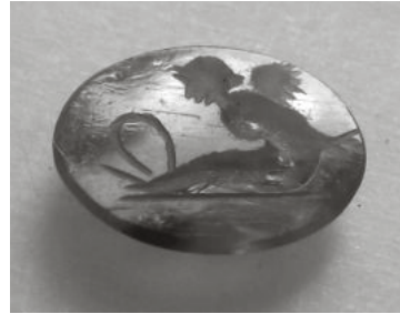
Abb. 4: Karneol. Gelagerte Psyche hat einen Fuß in einer Bügelfalle. Aus Tha Chana (Thailand), Suthiratana Foundation, Bangkok, Inv. TCN 764.