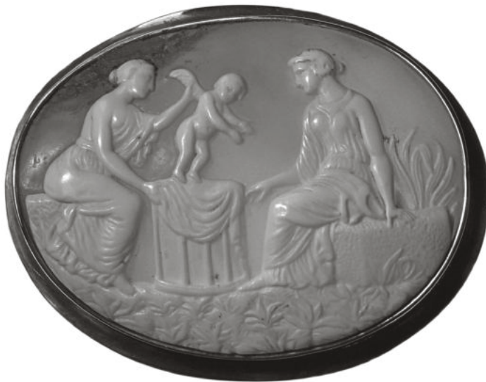
Abb. 11: Als Brosche gefasste Muschelgemme, 19. Jh. Amorettenverkauf durch eine Verkäuferin an eine Kundin. Privatbesitz.

Ganz anders liegt der Fall, wenn Amor selbst in die Falle gerät. Er, der er selbst die Schlingen für andere legt und seine Netze ausspannt, 95 gerade