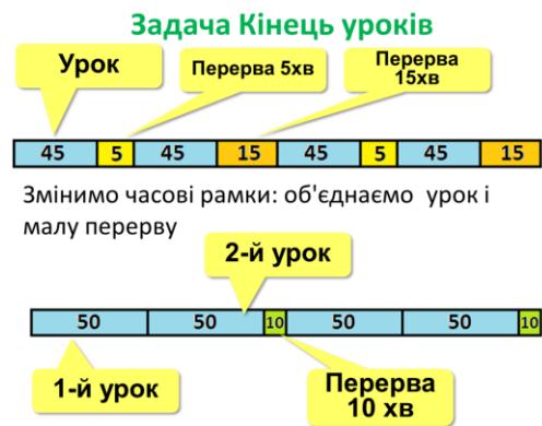
Рис. 2. Спрощення моделі