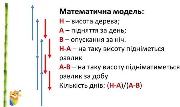
Рис. 7. Модель задачі

Як бачимо, за добу равлик піднімається на (a - b) метрів. Піднімаючись у якийсь із днів на a метрів, він досягне потрібної висоти h . Відповідно, равлик повинен пройти не менше, ніж (h - a) метрів, щоб наступного дня завершити процес підйому. Тому легко визначити кількість днів, коли він досягне висоти принаймні (h - a) метрів. Це буде значення, яке рівне