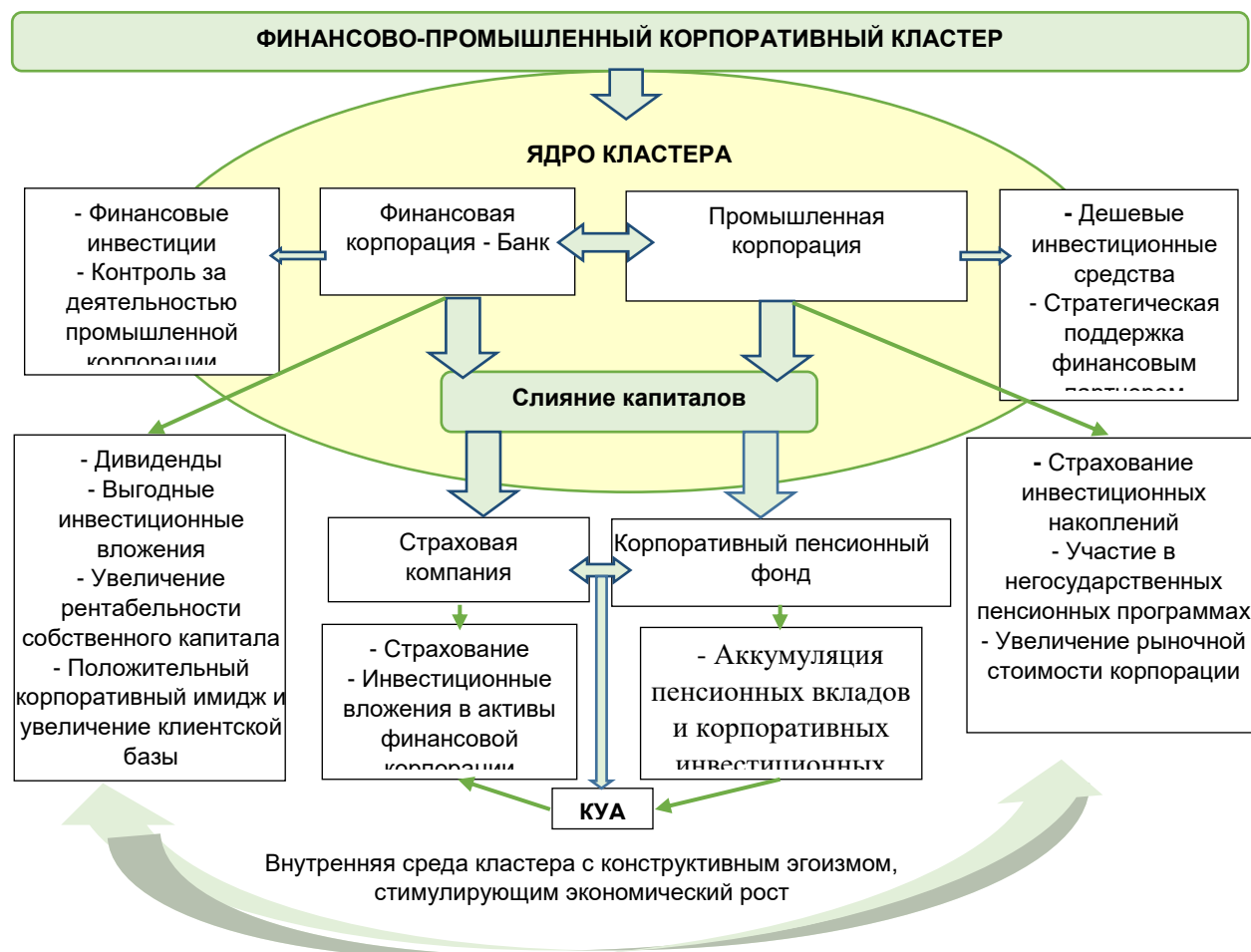
Рисунок 2. Модель корпоративного финансово-промышленного кластера [авторская разработка]

Предположим, старые акционеры оказывают сопротивление и не желают «размывать» часть своих корпоративных прав, делясь ими с новым собственником. В таком случае мы рекомендуем попробовать не корпоративную, а организационную модель ведения совместного бизнеса финансово-промышленных корпораций, каковой является кластер. Со временем в процессе совместной деятельности деструктивный экономический эгоизм с большой вероятностью трансформируется в конструктивный, что станет побудительным мотивом слияния корпоративного капитала. В этом случае целесообразно включить в состав кластера такие финансовые корпорации как страховую компанию, корпоративный пенсионный фонд и компанию по управлению активами (КУА) (рис. 1).