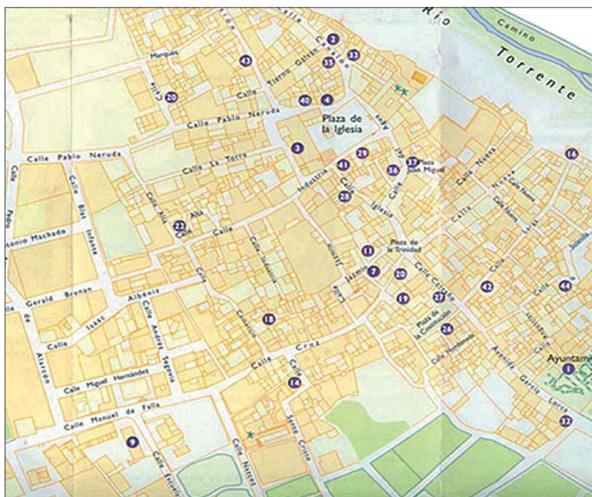
Fig. 10. Centro urbano del lugar de Nigüelas

La visión que nos ha proporcionado el Apeo y las escrituras de censo relativos a los bienes hábices de la Yglesia del lugar de Nigüelas quedaría incompleta si no se hace un estudio arqueológico sobre el territorio. Se tratara de situar y ubicar los restos materiales que son descritos en los dichos Apeos y Deslindes de Bienes, elaboración de una serie de planos, determinar linderos de todos aquellos bienes urbanos de dicha localidad, como puedan ser: Mezquitas, rabitas, zawiya, casas, hornos, mesones,