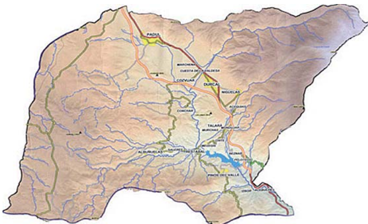
Fig. 8. Localización geográfica del Valle de Lecrín