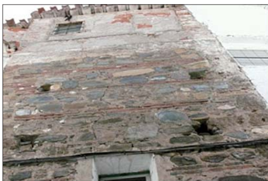
Fig. 6. Torre Alminar de la Mezquita

Una era de cocer pan que esta por encima de la Iglesia, alindando con camino que va a la Sierra y al molino, y por el barranco la acequia que viene del dicho molino y que es de Su Majestad, y viene al lugar y será de medio marjal.