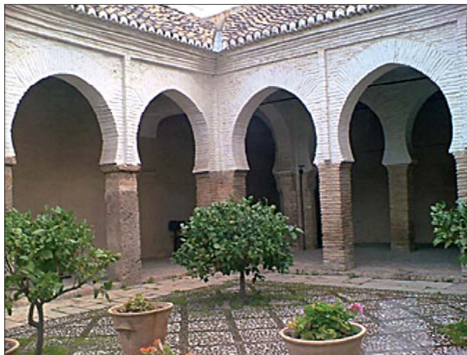
Fig. 4. Patio de una mezquita

Entre los bienes hábices de Nigüelas nos encontramos por un lado una serie de bienes urbanos y por otra de bienes rústicos. Entre los primeros hay que destacar: Casas, hornos, almadrabas, molinos, etc. Entre los rústicos las distintas tierras se pueden clasificar en tierras de: secano, regadío, viñas, árboles, etc.