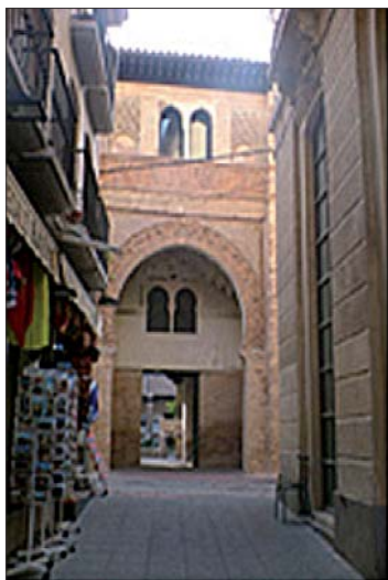
Fig. 2. Corral del Carbón (Fundaq)