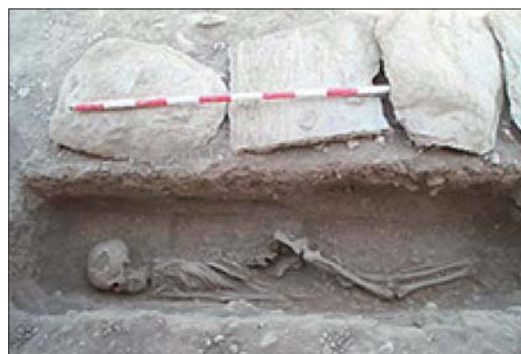
Fig. 7. Macaber