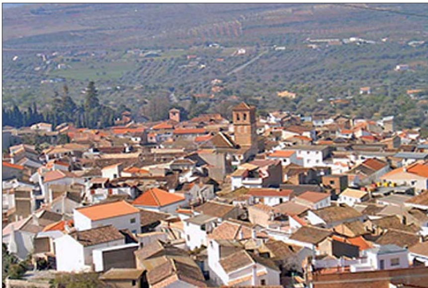
Fig. 9. Vista de Nigüelas

almazaras, aljibes, tiendas, almadrabas, molinos, fuentes, etc. Y en relación a los bienes rústicos, las tierras de riego, de secano, y distribución del agua para el consumo humano y riego. El que estas fuentes nos proporcionen las medidas y la estructura de algunos de los edificios nos va a permitir comprobar sobre el terreno como realmente las estructuras arquitectónicas sobre las que se desarrolló la vida diaria de los musulmanes. Aspecto que no nos ofrecen los cronistas oficiales de la dinastía nazarí en sus famosas crónicas, pues, la vida de las gentes humildes en muy contadas ocasiones mereció ser anotadas por aquellos cronistas.