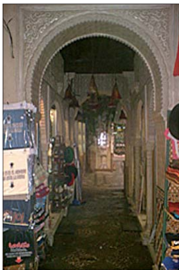
Fig. 3. Alcaicería (Zoco)

Los hábices granadinos podían estar integrados por posesiones urbanas y rústicas. Las primeras podían ser tiendas, grupos de viviendas en sus diversas variedades de casas, macerías y algarfas, o bien hornos, alholíes y tarbeas, etc. A ellas se unían antiguas rábitas, gimás e incluso mezquitas, cuyas denominaciones se confunden en los libros de hábices, especialmente las de rábita y gima.