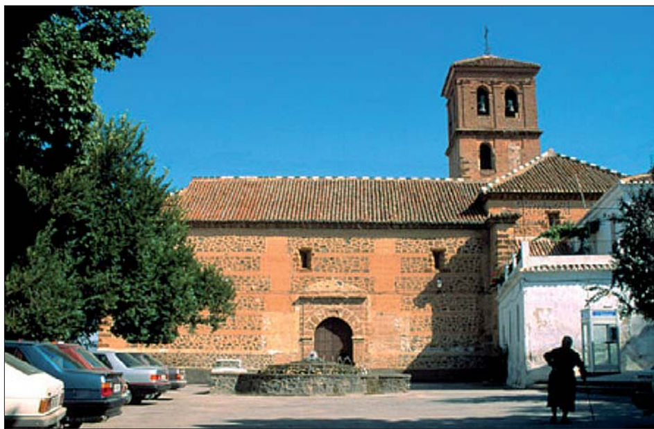
Fig. 1. Fachada principal Iglesia de Nigüelas

Posteriormente con la expulsión de los moriscos y la repoblación de los lugares que habían quedado vacíos en el reino de Granada, se procedió a realizar inventarios generales de todos los bienes, ya sea de aquellos que pasaron a la Corona, como de aquellos que habían sido propiedad de las mezquitas y pasaron a ser propiedad de la Iglesia. Igualmente fueron inventariadas las propiedades de aquellos cristianos viejos que habían residido en estos lugares junto a los moriscos antes de la rebelión. (MARTINEZ, 1986)