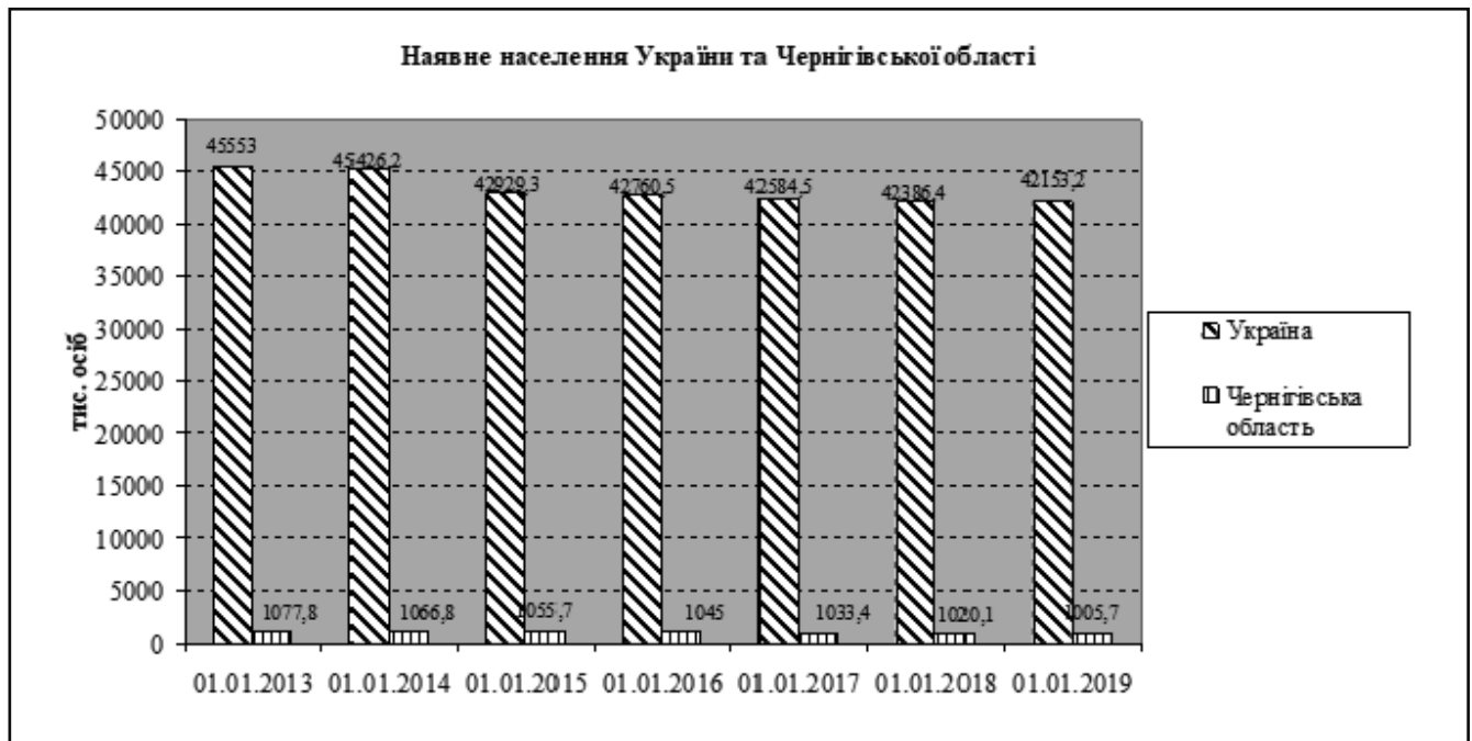
Рисунок 1. Зміна чисельності наявного населення в Україні та Чернігівській області, станом на 1 січня 2013–2019 рр.

Чернігівська область є однією з середньо урбанізованих областей України. Протягом 2013–2019 років рівень урбанізації зріс на 1,7 %, і досягнув 65,2 % (табл. 2). На початок 2013 року міське населення становило 684713 осіб, а