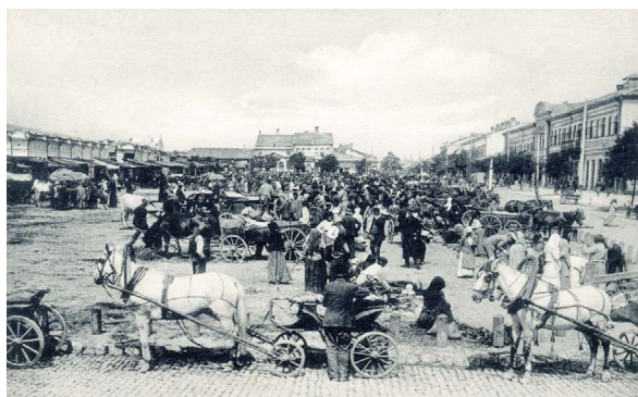
Bazarul din Chișinău la începutul sec. XX