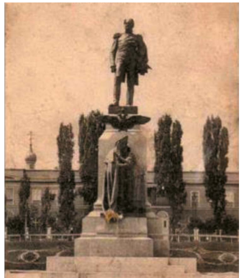
Monumentul Țarului Alexandru I

„Merg tot pe ulița cea mare, spre centru: Alexandrovskaia... Clădirile tot mai arătoase, – mai întâi pe stânga, apoi și pe dreapta... Deși locul în-