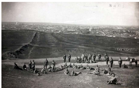
Vedere spre Chișinău de pe dealul Râșcani, 1917