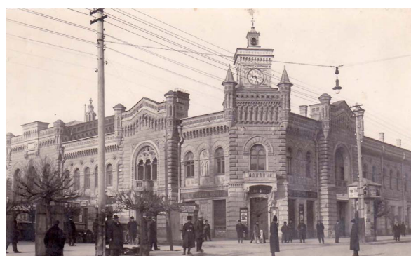
Primăria Chișinău la 1917

luționară, anti-țaristă, la rândul ei generând două curente: unul bolșevic-anarhic și altul regenerator în sens național.