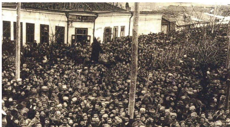
Căderea țarismului întâmpinată la Chișinău, 10 martie 1917

ai ei, capitalul de speranță în făurea unui viitor național al Basarabiei. La redacția ziarului, Ciofleac și-a întâlnit fostul coleg de universitate la Iași, pe publicistul Pan Halippa, care reprezenta „după port, după înfățișare, o părticică din marea Rusie, azi răzvrătită ca și sufletul lui”, cu figura „simplă, modestă, de student”, „de răzeș îndărătnic, nebărbierit”. Portretul făcut lui Halippa e al Basarabiei însăși în acel moment de răscruce, răbufnind cu reproșuri la adresa conaționaliilor regăteni: „Ce-ați făcut, pentru Dumnezeu!» – începu Halippa după ce ne-am strâns mâinile în tăcere. – «Cum v-ați putut lega cu rușii?»”. Cu toate acestea, Halippa l-a introdus în societatea basarabenilor naționaliști, la rândul lor simbolizând „Basarabia «moartă»” din care „se văd moldovenii vii”: