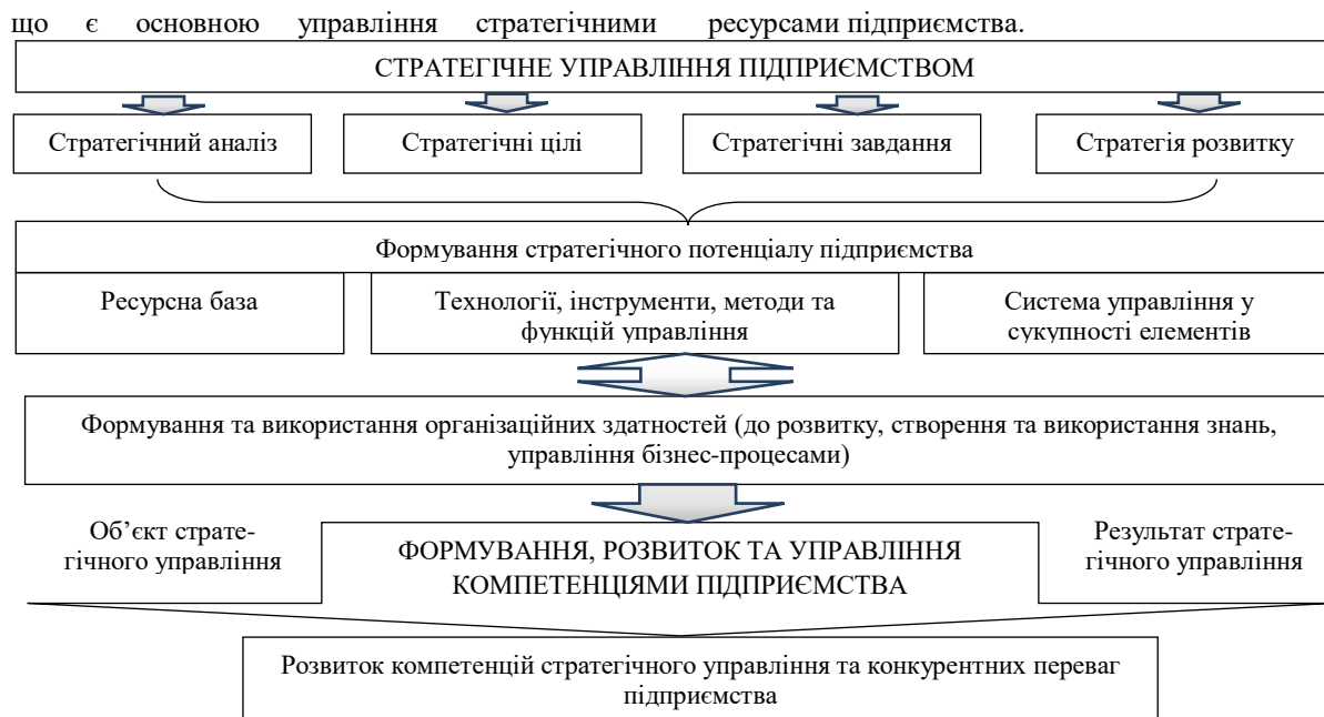
Рис. 3. Моделювання процесу стратегічного управління підприємства з використанням ресурсно-компетентісної концепції