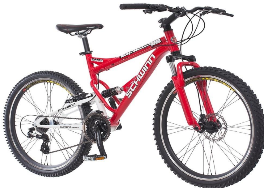
Figura 2. Bicicletă de munte tip „fă singur”