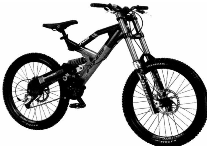
Figura 1. Bicicletă de munte: pentru downhill și Cross Country.